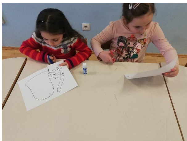
Slika 7. Rezanje škarama po zakrivljenoj liniji