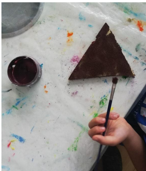
Slika 18. Izrada kostima - jež

Za izradu kostima su nam trebale razne tkanine od kojih smo krojili, rezali i bojali obilježja ježa, lisice, divlje svinje, vuka i medvjeda. Tanji karton smo izrezali u oblik krune, zalijepili ljepljivom odgovarajuću tkaninu i zalijepili uši. Od ostataka tkanine smo izrezali pojas oko struka i na njega zalijepili odgovarajući rep.