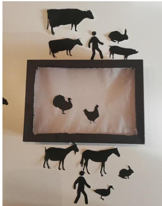
Slika 35. Kazalište sjena

Ponudile smo mu manipulaciju s crnim štapnim lutkama i pripadajuće kazalište sjena. Uz pomoć ponuđenih rekvizita usvojio je nazive životinja. Obradujući priču „Djed i repa“, koja nudi mnoštvo ponavljanja rečenica, počele smo ga poticati na uporabu smislenih rečenica od tri do četiri riječi.