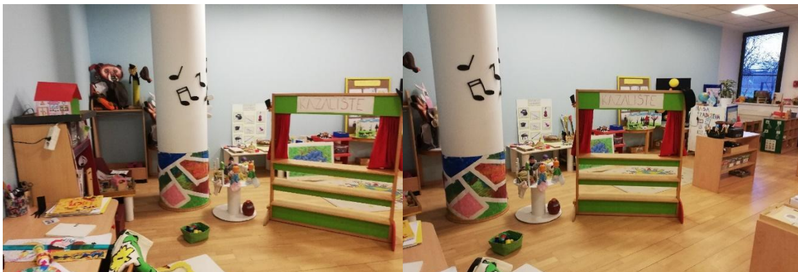
Slika 34. Promjene u sobi dnevnog boravka.

Prateći interese skupine i razvojne potrebe djece, proširen je dramsko-scenski centar, a smanjen je centar istraživanja sa integriranim prometom.