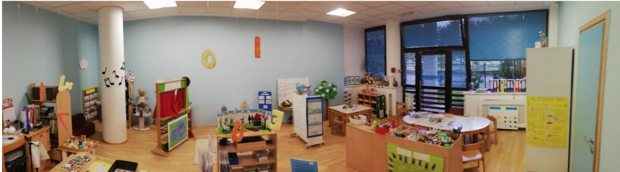
Slika 33. Soba dnevnog boravka