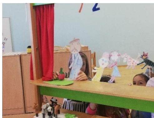
Slika 5. Dramatizacija sa izrađenim štapnim lutkama