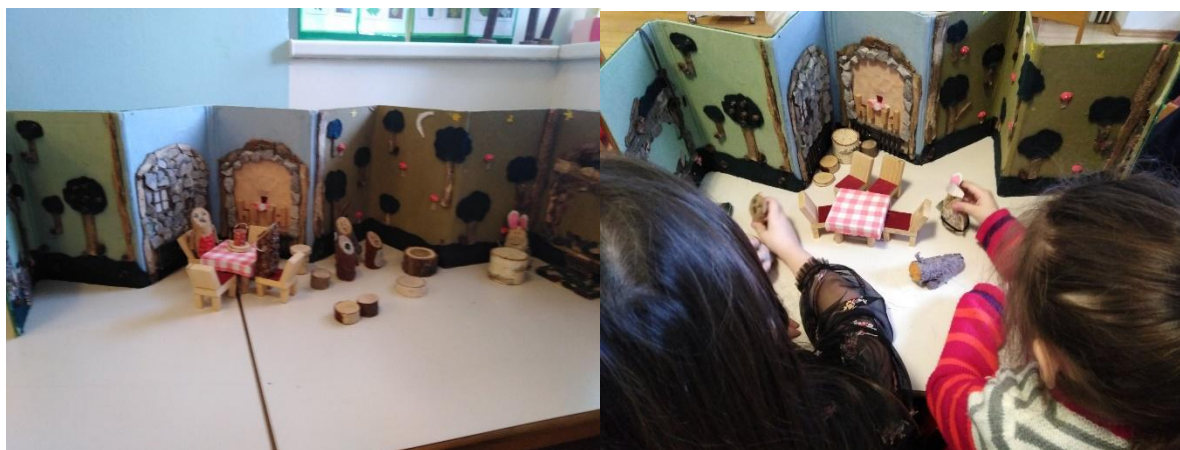
Slika 21. Interaktivna slikovnica „Ježeva kućica“.

Za poticanje upotrebe složenih rečenica i samoinicijativnosti u opisivanju i konstrukciji pravilnih gramatičkih rečenica, djeci su ponuđene interaktivna slikovnica „Ježeva kućica“ i kazalište u kutiji za koje su sami izradili likove od kartonskih tuljaca i kolaž papira.