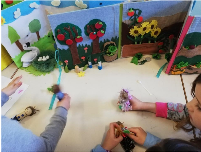
Slika 1. Igre sa stolnim lutkama