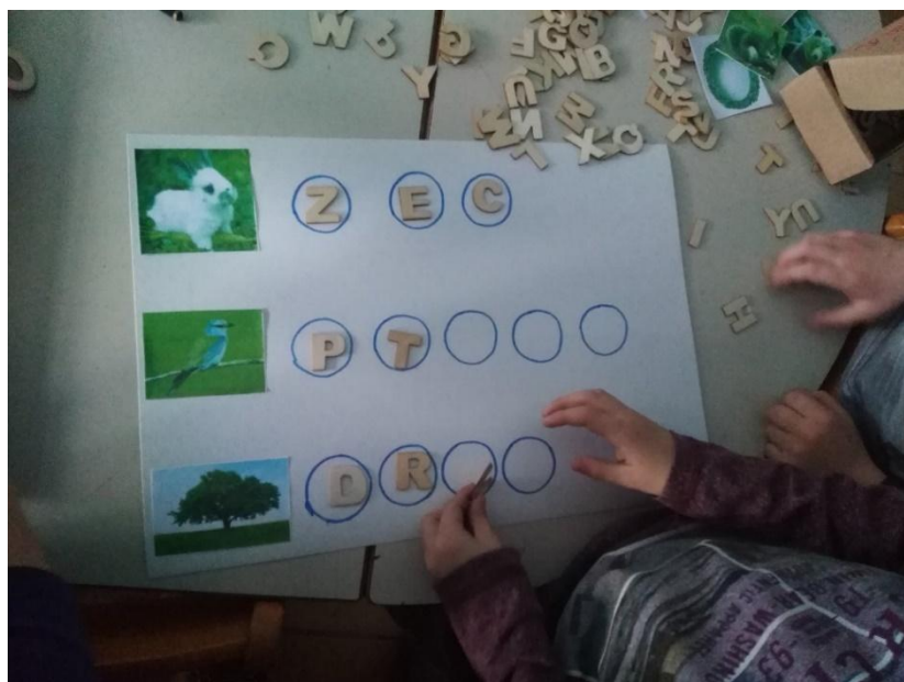
Slika 28. Aktivnost prepoznavanja životinje sa slike i pravilno pisanje naziva