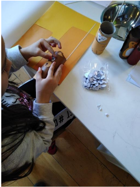
Slika 22. Izrada štapne lutke