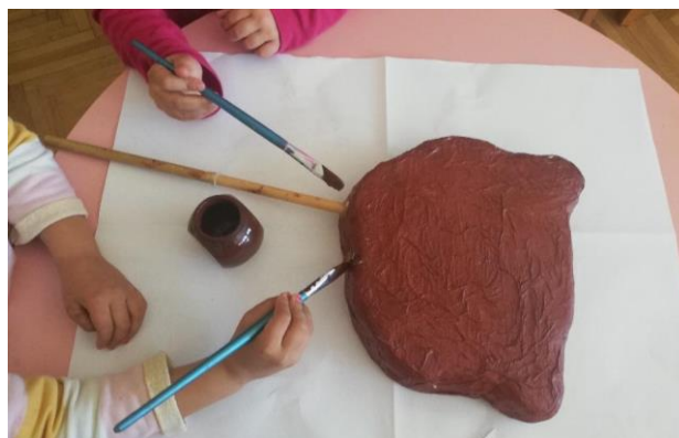
Slika 31. Izrada štapne lutke.

Nakon što smo na stiropor, u odgovarajućoj veličini, iscrtali likove životinja, oni su izrezani skalpelom, a zatim smo ih kaširali sa smjesom za kaširanje i komadima papira, koje su djeca prethodno potrgala na manje komade. Nakon sušenja, obojali smo likove u podlogu željene boje. Bojanje smo ponovili i glave smo učvrstili na štapove. Naknado, nakon sušenja smo iscrtali lica životinja.