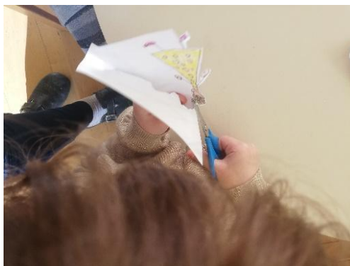
Slika 4. Izrada štapnih lutaka

U međuvremenu dječak A.Š. predlaže drugoj skupini djece izradu štapnih lutaka. U procesu izrade lutaka pomažem na način tako da potičem djecu na crtanje što više detalja kod čovjeka, plastificiranjem radova i lijepljenjem vrućim ljepilom na štapove.