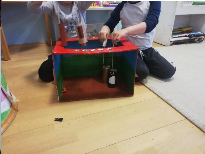
Slika 23. Kazalište u kutiji.