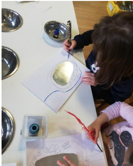
Slika 26. Kreiranje vlastitog ogledala

okvir vlastitog ogledala. Cilj aktivnosti je opažanje omjera veličina predmeta i upoznavanje s novim crtaćim medijem – perom.