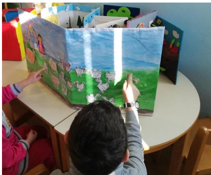
Slika 9. Uporaba interaktivne ploče.

Djeca u odgojnoj skupini su odlučila izrađene plošne lutke upotrijebiti za pričanje priče na novi način, kroz interaktivnu ploču.