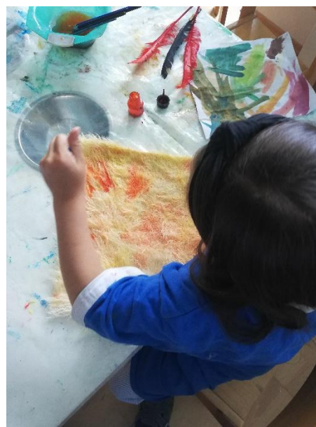
Slika 19. Izrada kostima - lisica