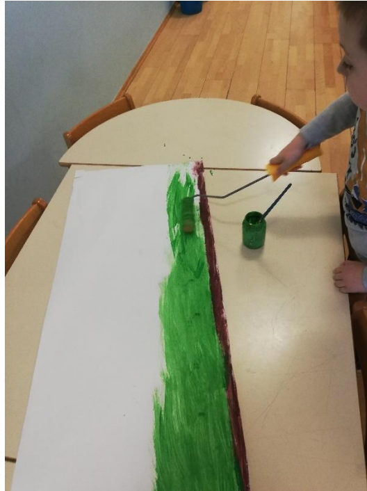
Slika 6. Izrada scenografije

djeci podlogu za crtanje i tražene boje. Dječak M.O. najprije boja s kistom za tempere, međutim vrlo brzo zaključuje da će valjkom ići puno brže.