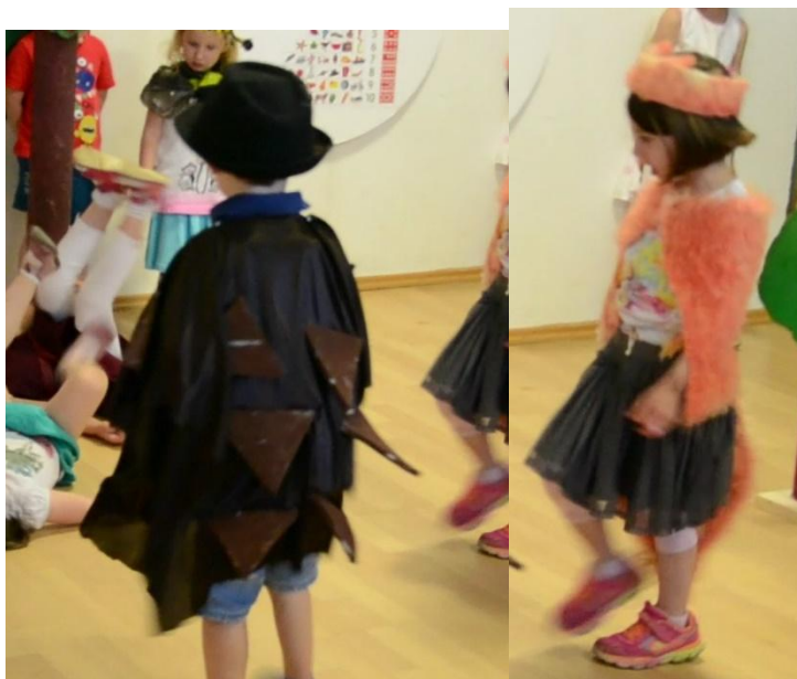
Slika 20. Kostimi – jež i lisica