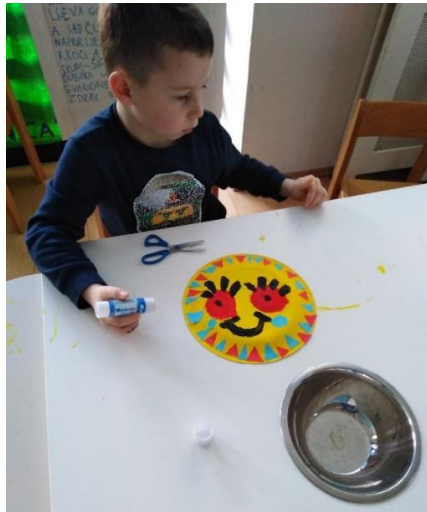
Slika 30. Igre emocijama

Socio-emocionalni razvoj; aktivnosti imenovanja prepoznavanja emocija kod sebe i drugih, te poticanje na razumijevanje uzroka tih emocionalnih stanja.