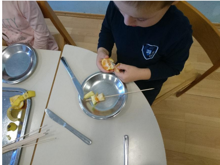
Slika 13. Izrada „Voćnih ražnjića“

jer „jež jede voće i povrće, a najviše voli jabuke. To znam jer mi je deda pokazao kako jež jede jabuku“. Najzdravija hrana koje su se mogli dosjetiti je bila voćna salata stoga smo u suradnji s roditeljima i ostvarili tu aktivnost. Roditelji su donijeli sezonskog voća i daščicu za rezanje za svako dijete, a E.T. se sjetila i donijela štapiće za „voćne ražnjiće“. Cilj ove aktivnosti je bio osvijestiti važnost zdrave prehrane, ali i poticati na pravilnu uporabu noža.