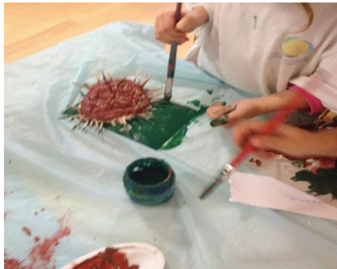
Slika 12. Modeliranje ježa

Pomoću gline djeca su modelirala ježa, od štapića za ražnjiće su izradili bodlje, a kada se skulptura osušila, bojali su u smeđu boje između bodlji, čime su jačali i razvoj koordinacije oko-ruka.