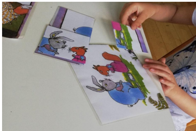
Slika 25. Vježbe vizualne precepcije

Djeci su ponuđene slagalice s likovima iz slikovnice. Ovom aktivnošću smo nastojale potaknuti razvoj koncentracije i pažnje, kao i sposobnost za uočavanje detalja.