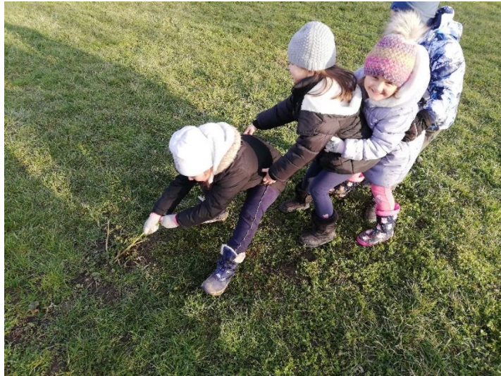
Slika 2. Samoinicijativna igra djece