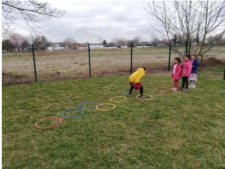
Slika 11. Poligon „Utrka medvjeda i pčela“