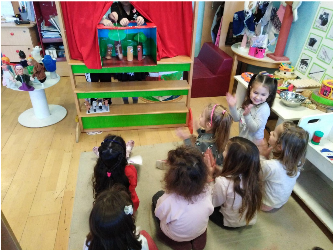
Slika 24. Lutkarska predstava