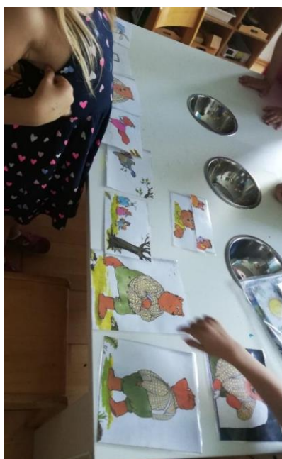
Slika 29. Prepričavanje po slikama.

Pričanje priče po slikama uz poticanje poštivanja pravilnih gramatičkih rečeničnih konstrukcija uz korištenje zamjenica, prijedloga i priloga.