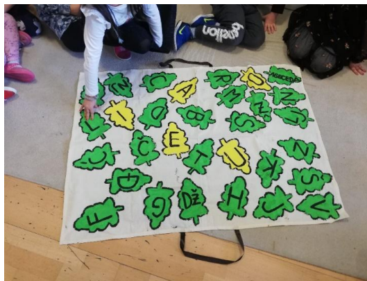
Slika 27. Šumska abeceda

Početno čitanje i pisanje: u „Šumskoj abecedi“ djeca trebaju prepoznati početno slovo svoga imena. Na pitanje zašto su neki listovi druge boje, djevojčica U.V. odgovara „ Na ta slova se plješće “, pritom misleći na provedene aktivnosti rastavljanje riječi na slogove, što su predradnja za govornu analizu i sintezu.