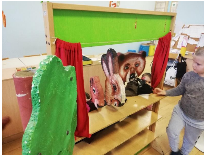
Slika 32. Lutkarska predstava

Radi velikog interesa, prije nego je dogovorena scenografija bila gotova, djeca su se podijelila u dvije skupine, glumci i publika, i počela su izvoditi predstavu na postojećem paravanu u sobi dnevnog boravka. Za potpuni doživljaj upotrijebili su stabla koja smo izradili za predstavu „Ježeva kućica“.