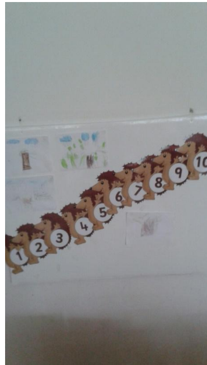
Slika 15. Usvajanje broja po redu