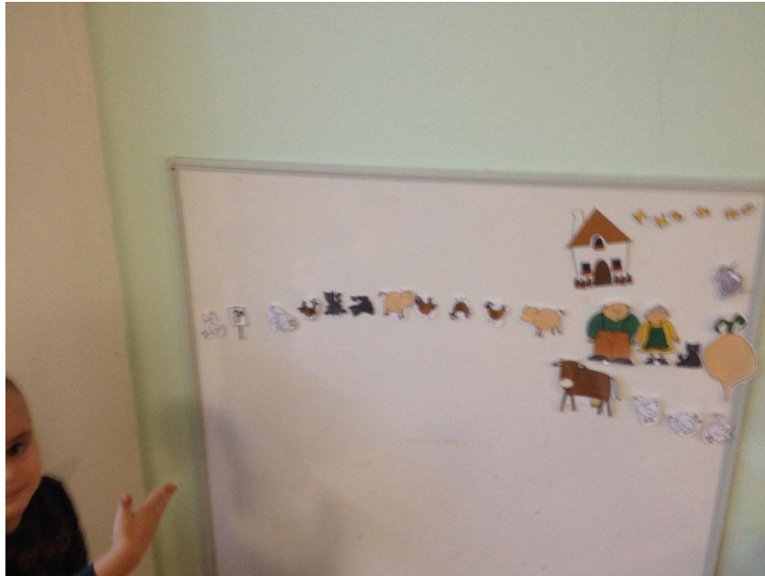
Slika 10. Manipulacija likovima na magnetnoj ploči