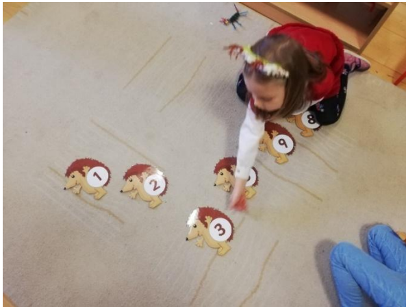
Slika 14. Slaganje brojeva po redoslijedu