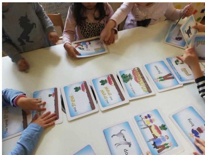
Slika 3. Pričanje priče uz pomoć aplikacija