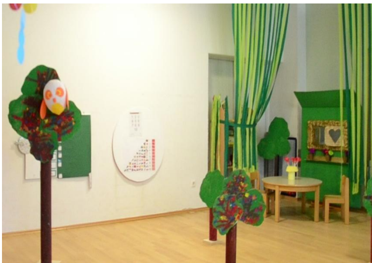
Slika 17. Scenografija