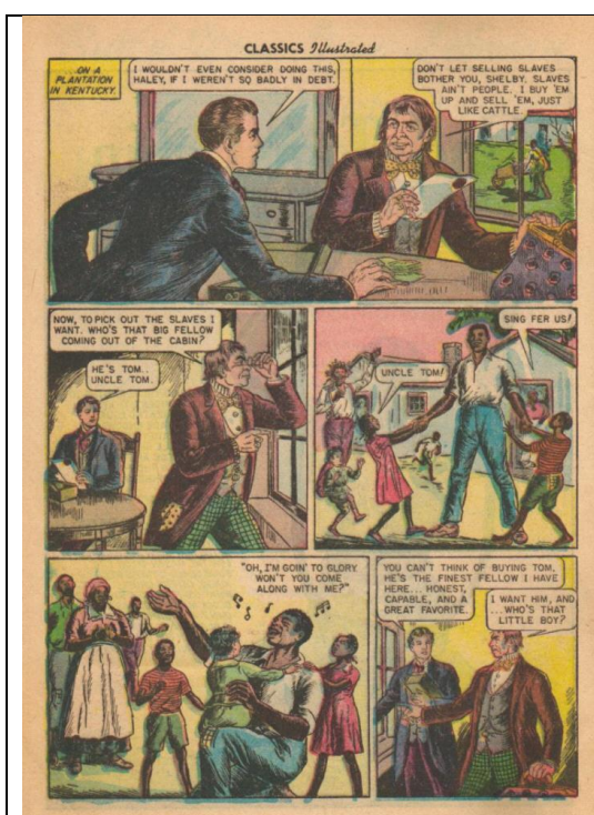
Slika 2-Stranica iz američkog izdanja stripa Uncle Tom's Cabin

Kao što je prethodno spomenuto, slike hrvatskoga izdanja stripa su nove ilustracije koje je izradio Nikola Mitrović. Vizualne razlike između hrvatskog i američkog izdanja stripa očituju se na nekoliko razina. Prva i najupečatljivija razlika između ilustracija dvaju izdanja je boja. Dok je američko izdanje stripa izdano s ilustracijama u boji (Slika 2), u hrvatskom je izdanju jedino naslovna stranica u boji, dok su sve ostale ilustracije crno-bijele (Slika 3).