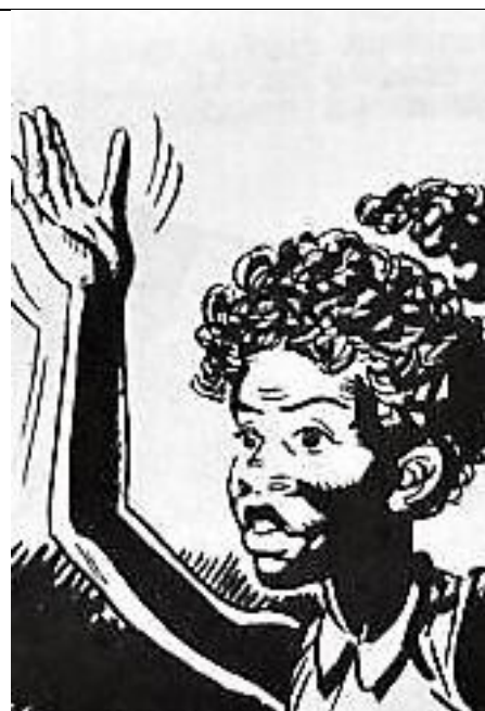
Slika 5-Topsy u hrvatskom izdanju stripa

Iako su prethodno navedene vizualne razlike očite, zanimljiva je i činjenica da se ova dva izdanja ne podudaraju s obzirom na određene prikaze radnje. Naime, u stripovima su dva ista događaja prikazana na različite načine (Slika 6 i 7).