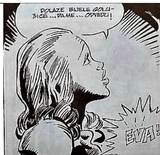
Slika 7-Evina smrt u hrvatskom izdanju

Iz prethodne je dvije slike vidljivo na koji su način sadržaji slika u hrvatskom izdanju stripa prilagođeni. Naime, dok se u američkom izdanju Evi ukazuju anđeli, u hrvatskom je izdanju prikazana samo Eva s pogledom prema gore. S obzirom da je hrvatski strip izdan u razdoblju u kojem je Hrvatska bila socijalistička Republika,