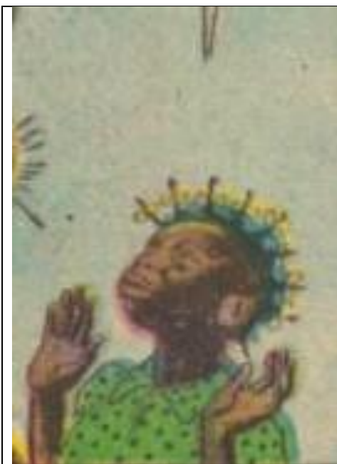
Slika 4-Topsy u američkom izdanju stripa