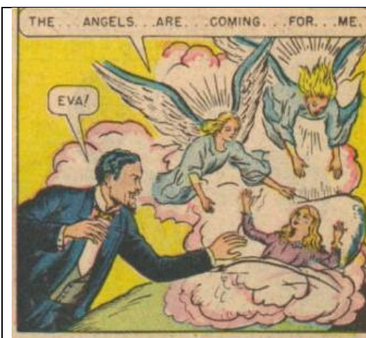
Slika 6-Evina smrt u američkom izdanju

Iako su prethodno navedene vizualne razlike očite, zanimljiva je i činjenica da se ova dva izdanja ne podudaraju s obzirom na određene prikaze radnje. Naime, u stripovima su dva ista događaja prikazana na različite načine (Slika 6 i 7).