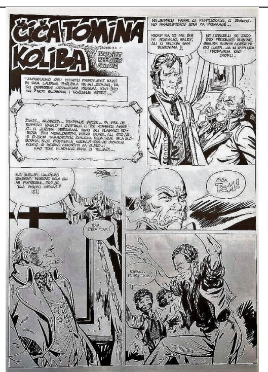
Slika 3-Stranica iz hrvatskog izdanja stripa Čiča Tomina koliba

Dodatna razlika između ova dva izdanja je sam stil, a ujedno i način prikazivanja likova. Dok su u američkom izdanju prikazi nekih likova bliži karikaturi nego li realnom izgledu jedne osobe, stil crtanja korišten u hrvatskom izdanju je iznimno realističan. Ta je razlika očita usporede li se prikazi istoga lika iz američkog i hrvatskog izdanja (Slika 5 i 6).