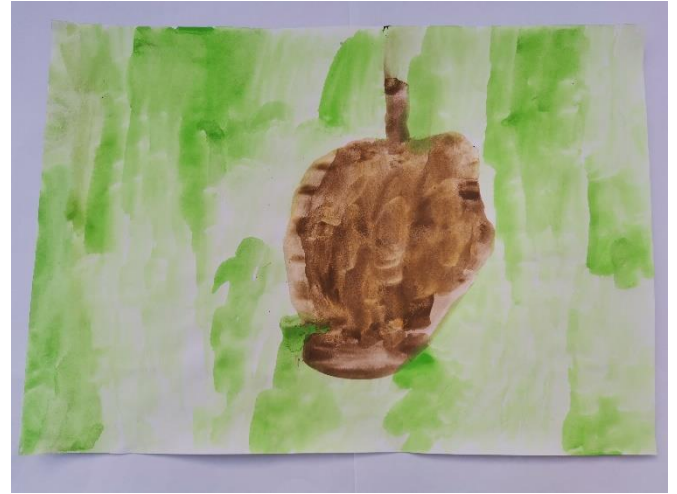
Slika 5: Dijete navodi da je osjetilo nešto tvrdo, dugačko i debelo. Zelena pozadina je jer misli da je pod u kutiji zelen.