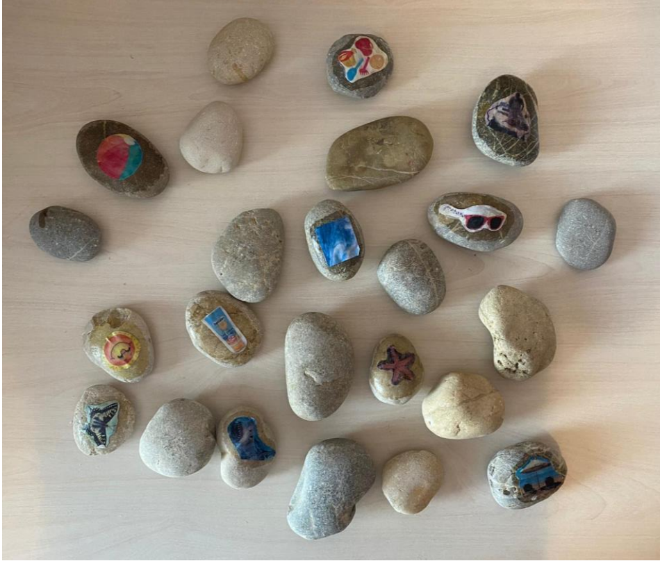
Slika 5. Memory na kamenčićima