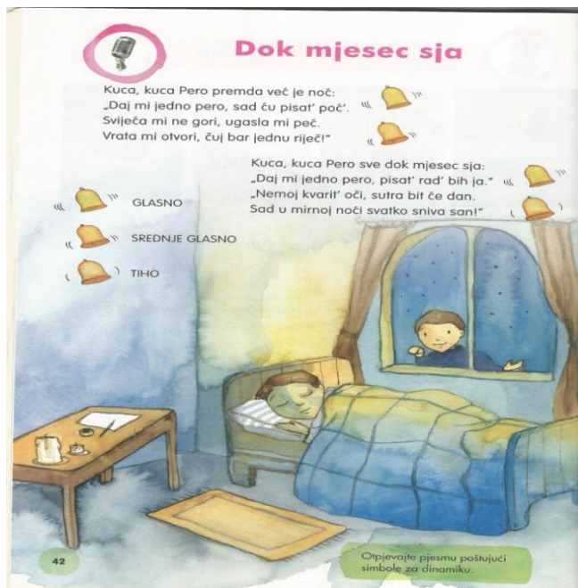
Slika 4. Dok mjesec sja