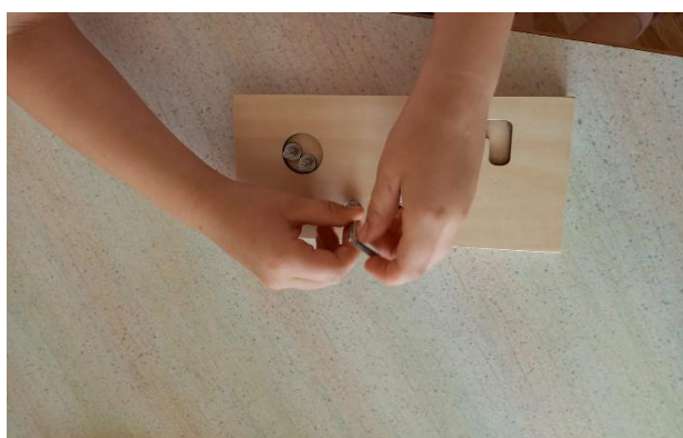
Slika 3 Odvrtnje i zavrtanje vijka (fotografirano u „DV Sopot“)

Pribor koji se koristi u vježbama za praktični život mora biti prilagođen uzrastu djece, npr. u radu će se koristiti maleni predmeti poput male metle, malog čajnika/zdjele/kante i slično. Tu spadaju i posebni okviri koji se koriste za vezanje vezica i vrpce, prišivanje dugmadi, spajanje kukica, lijepljenje čička, rad s iglama i kopčama. Vježbe za praktični život uključuju tri područja: i) brigu za samog sebe (pranje zubi i ruku, obuvanje, oblačenje i skidanje, čišćenje cipela itd.); ii) brigu za okolinu (pranje rublja i suđa, metenje prostorije, brisanje prašine, čišćenje, pranje prozora, briga za biljke i životinje, rad u vrtu itd.); iii) vježbe vezane sa životom u zajednici (pozdravljanje, postavljanje stola, ulijevanje pića, odvrtnje i zavrtanje vijka i sl.) (Seitz i Hallwachs, 1996).