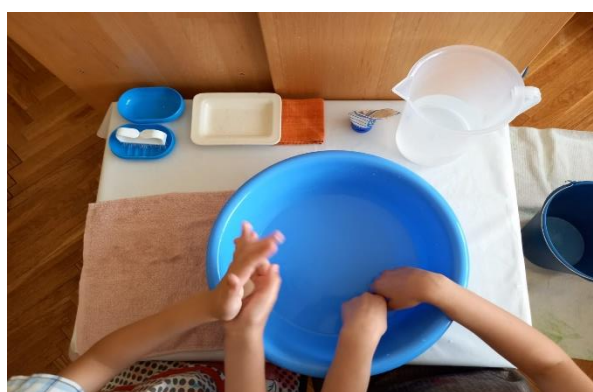
Slika 4 Pranje ruku (fotografirano u “DV Sopot“)