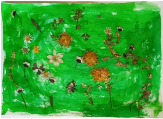
Slika 23. Djevojčica (5,5)