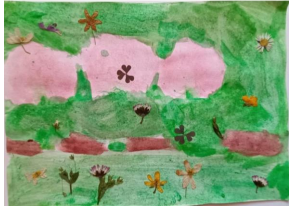
Slika 24. Djevojčica (5)