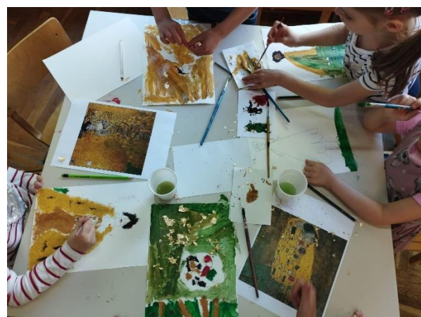
Slika 28. Inspiracija Klimtovim "zlatnim razdobljem"