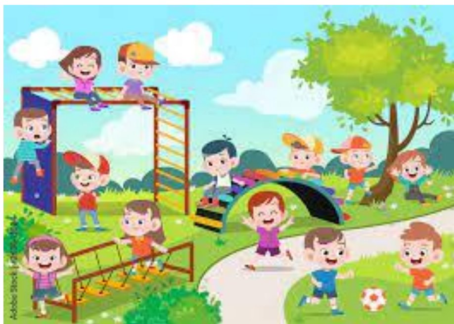
Slika 1. Prikaz ilustracije

Pomoću ilustracija doživljava se, proživljava i proširuje priča i tako se potiče djetetova mašta. Maštovitost se očituje u inspiraciji i stvaralaštvu koje nam omogućuje cjelokupni doživljaj priče.