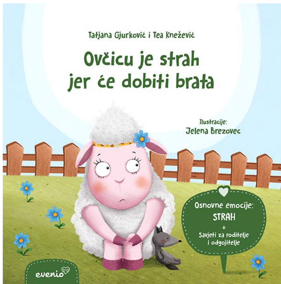
Slika 4. Naslovna stranica slikovnice Ovčicu je strah jer će dobiti brata

Glavni je lik ovčica koja se osjeća poljuljano zbog toga što će dobiti mlađeg brata. Prije je bila razigrana, a nakon tog saznanja postala je zabrinuta i povučena. Osjeća se nesigurno i ranjivo, budi se noću vrišteći da ne želi bracu. More je brige oko toga hoće li joj brat uzeti igračke i zauzeti njezino mjesto u srcima roditelja te hoće li izgubiti njihovu ljubav. Pile, kravica i konjić pokazali su se kao pravi prijatelji jer su joj objasnili da to uopće nije loše. Pile ima više braće i sestara svojih godina i nikada im nije bilo dosadno. Kravici njezina sestra pomaže, a konjića brat nasmijava skačući preko prepreka. Također je tješe roditelji. Ovčici jako godi što su uz nju roditelji i prijatelji i to je dobar primjer pozitivne komunikacije koja bi uvijek trebala biti prisutna. Također je umiruje zagrljaj i dodir, nastavak normalnog života i nastavak aktivnosti koje su se odvijale i prije saznanja da stiže prinova. U ovoj se slikovnici također pokazuje empatičko reflektiranje roditelja i prijatelja prema ovčici. Pojavljuje se usporedba prinove s novim cvijetom u vrtu koji nije smetnja, nego samo dodatno uljepšava vrt, odnosno obitelj. Tekst je pun novih i nepoznatih pojmova za djecu, što potiče na razgovor roditelja i djeteta za vrijeme čitanja i poslije čitanja slikovnice.