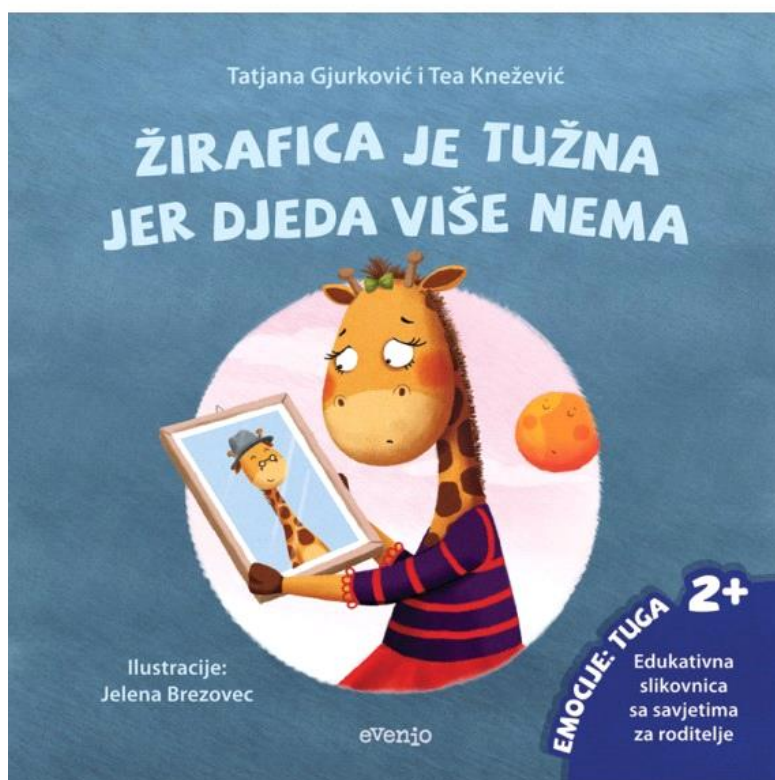
Slika 3. Naslovna stranica slikovnice Žirafica je tužna jer djeda više nema

Žirafica je za vrijeme ljetovanja saznala da joj je djed teško bolestan te da je završio u bolnici. To je za nju bila novost i neobična pojava te nije znala o čemu se radi niti kako se nositi s tim. Ubrzo nakon toga roditelji su joj priopćili da je djed umro. To ju je osobito zbunilo i imala je drukčiji osjećaj tuge, koji se manifestirao kroz zbunjenost i neshvaćanje. Ona nije osjećala tugu zbog djedove smrti jer nije znala što to znači. Ova slikovnica daje nam savjet o tome kako djeci objasniti da im je netko blizak umro. Izrazito je važno objasniti djeci da osoba koja je umrla nije više s nama fizički, ali je zato uvijek živa u našim srcima. Ne treba izbjegavati razgovarati o članovima obitelji koji su umrli, štoviše, treba se često i rado prisjećati lijepih trenutaka s tom osobom. Tako su žiraficu često podsjećali na djeda, prisjećali se zajedničkih trenutaka i uspomena, uživali u plesu i pjevanju djedovih najdražih pjesama kako bi ga oživjeli u svom srcu. Tekst prikazuje unutarnja stanja i razmišljanja likova, a događaji su stavljani u drugi plan.