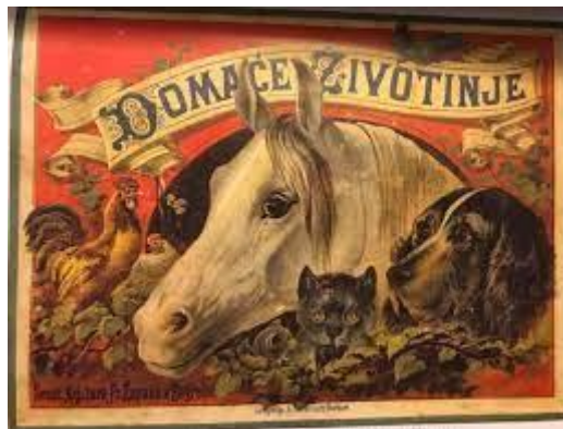
Slika 2. Slikovnica Domaće životinje i njihova korist

Hrvatski bi ilustratori izradili svoje ilustracije koje bi se potom umnožile u stranim tiskarama. Naslov je najstarije hrvatske sačuvane slikovnice, kao što je već spomenuto, Domaće životinje (1885), no prva hrvatska slikovnica za koju se pouzdano zna da je objavljena u Zagrebu bila je Domaće životinje i njihova korist (1863) nakladnika Lavoslava Hartmana. Nažalost, ta slikovnica nije sačuvana, ali je poznato da se njezino prvo izdanje rasprodalo u samo jednoj godini (Majhut, 2013).