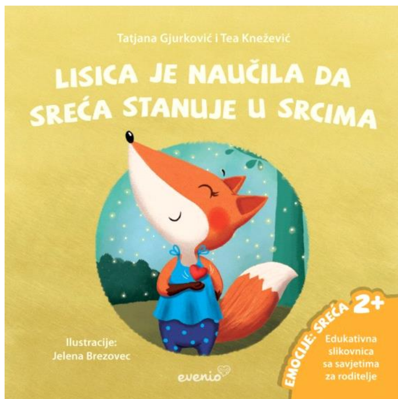
Slika 3. Naslovna stranica slikovnice Lisica je naučila da sreća stanuje u srcima

Kroz slikovnice važno je djeci obznaniti da se sreća nalazi u malim stvarima i svakodnevnim situacijama, a to su u slučaju djece najčešće igra, razgovor s roditeljima, vrijeme u prirodi provedeno s prijateljima ili roditeljima. Primjer takve slikovnice je Lisica je naučila da sreća stanuje u srcima .