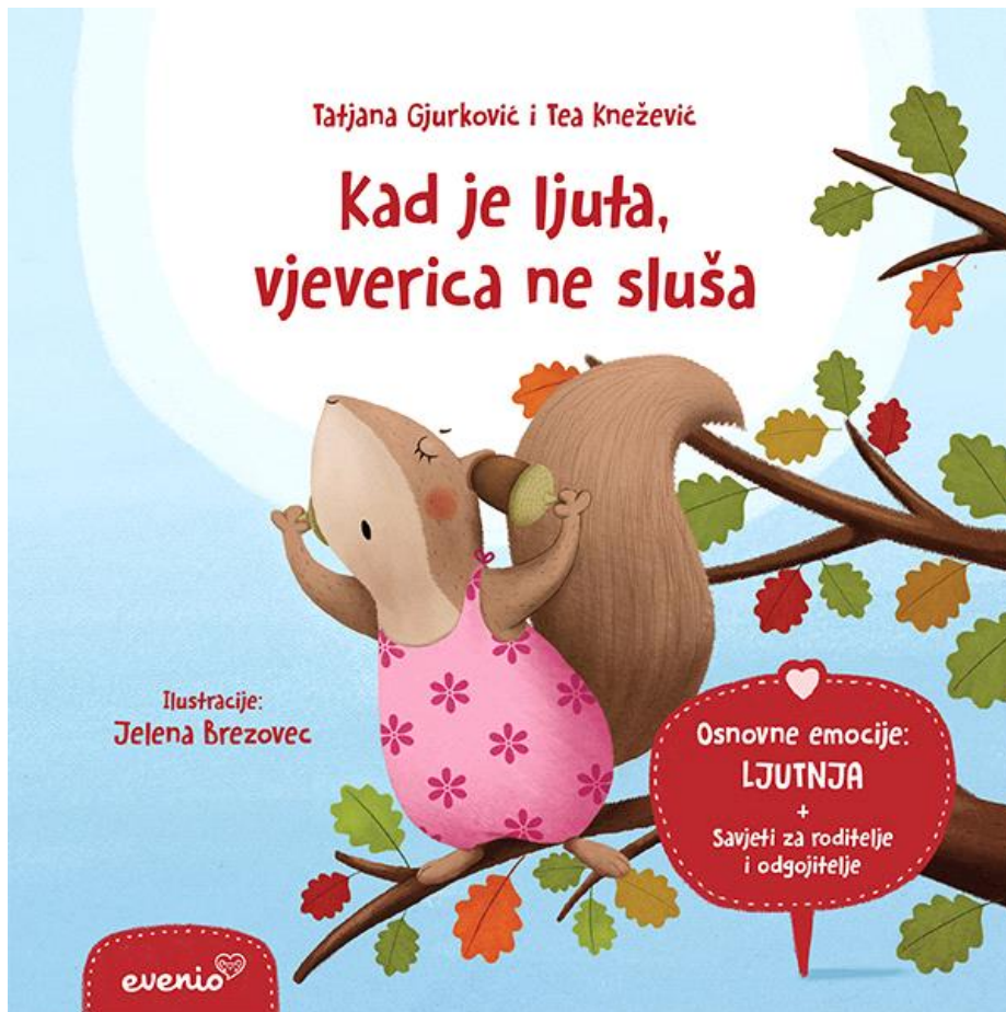
Slika 5. Naslovna stranica slikovnice Kad je ljuta, vjeverica ne sluša

Kada je srušila gnijezdo, prijatelji se naljute, a ona postaje tužna zbog toga što je napravila. To potiče na dodatan razgovor između roditelja i djeteta da mu dodatno ukažu kako nije u redu ljutiti se i ne slušati one koji nam žele dobro. Važno je objasniti djetetu da pravila postoje kako bi se olakšao i poboljšao suživot ljudi. Pojavljuje se lik mudre sove koja je u svojstvu roditelja.