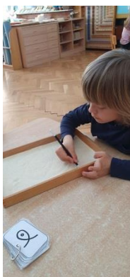
Slika 16. Pisanje kistom