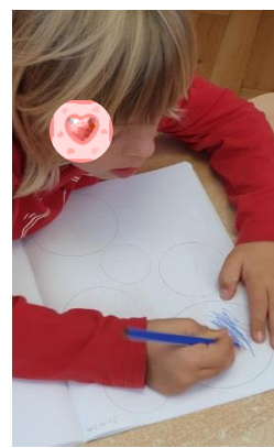
Slika 15. Metalni umetci