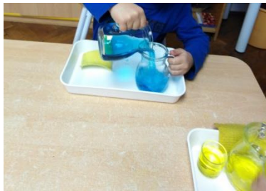
Slika 12. Preljevanje vode iz vrča u vrč