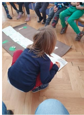
Slika 17. Pričanje priče