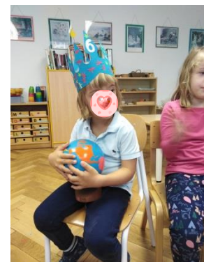
Slika 18. Proslava rođendana na Montessori način