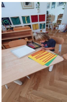
Slika 14. Slaganje trakica po boji i dužini