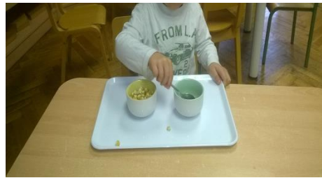
Slika 13. Prenosenje žlicom