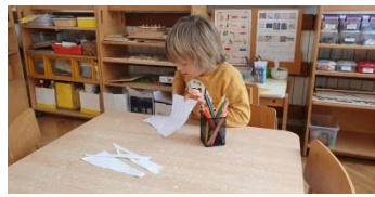
Slika 11. Rezanje škalicama po ravnoj liniji