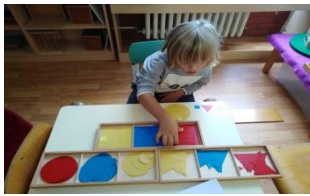
Slika10. Geometrijski oblici