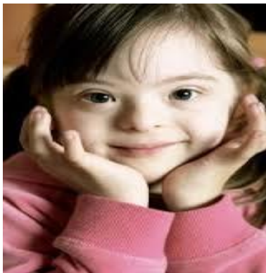
Slika 3. Karakterističan izgled osobe s Down sindromom