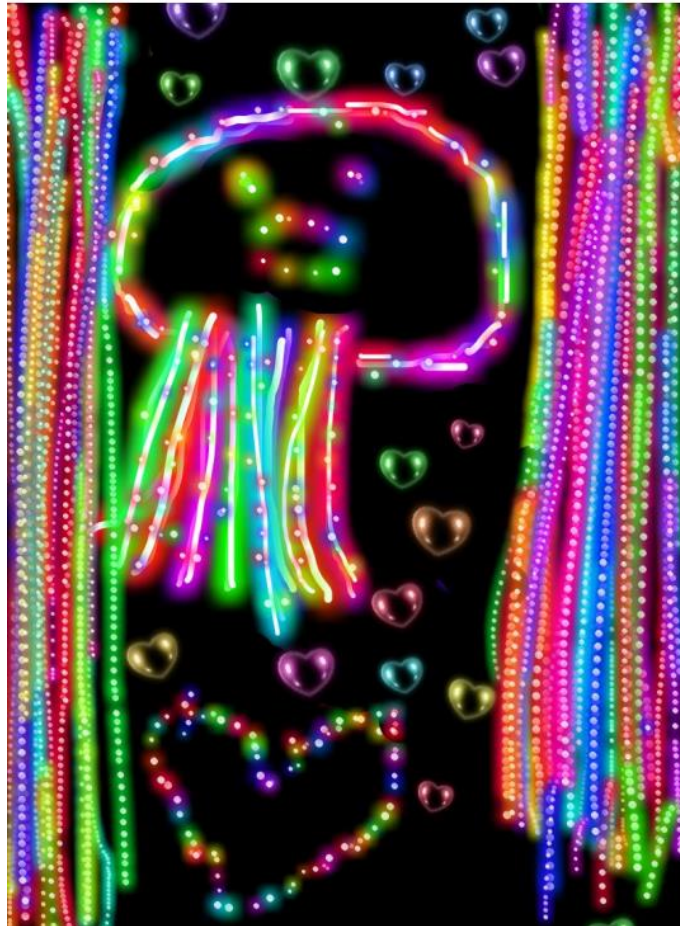
Slika 4 „Šarena meduza“, računalni program „ KidsDoodle “ (Ban, 2017)

Radovi „Riba - pas“ (Slika 3) i „Šarena meduza“ (Slika 4) nastale su pod istim uvjetima kao i rad „Riba s krunom“ (Slika 2), ali je sada djetetu bila ponuđena nova tehnika - crtanje u računalnom programu tj. na tabletu. U radu „Šarena meduza“ (Slika 4) riba poprilično liči na hobotnicu ili meduzu. Ban (2017) uočava kako je dijete kroz korištenje raznih efekata, igrom boja i oblika izrazilo svoje osjećaje te je pokazalo interes za perspektivu, dubinu i izradilo pozadinu.