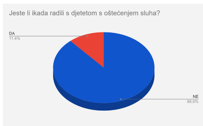
Graf 1. Postotak ispitanika koji su radili s djetetom s oštećenjem sluha

Rezultati istraživanja interpretirani su i prikazani u postotcima i tablično. Jedno pitanje ima ponuđeno DA/NE za odgovor, sve ostalo su stupnjevi slaganja s određenom tvrdnjom (u potpunosti se slaže, djelomično se slažem, niti se slažem niti se ne slažem, djelomično se slažem, uopće se ne slažem). Odgovori su prikazani tablično, osim odgovora na pitanje DA/NE koje je prikazano grafom, zatim se rezultati dalje analiziraju.