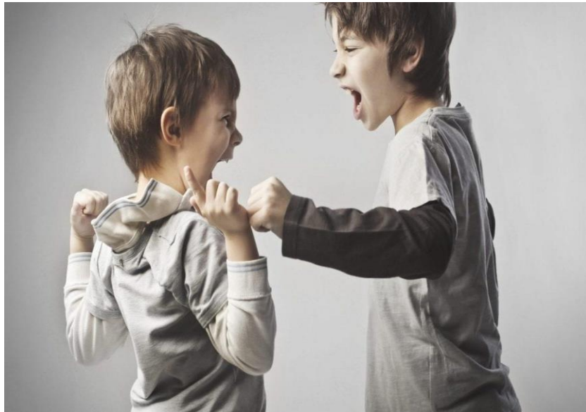
Slika 3, Agresivno ponašanje kod dječaka ( https://centarproventus.hr/agresivno-ponasanje-ivrsnjacko-nasilje-kod-djece/ )

Vrtić je ustanova u kojoj dijete uči, razvija svoje socijalne i društvene vještine. Dijete uči usput promatrajući druge, zatim oponašajući ih, a na kraju uči iz vlastitog iskustva. Agresivnost spada u dječju svakodnevicu, kao i pjevanje, igranje, smijanje i isprobavanje novih igračaka i to zato što je agresivnost dio ljudskog ponašanja (Haug-Schnabel, 1996).