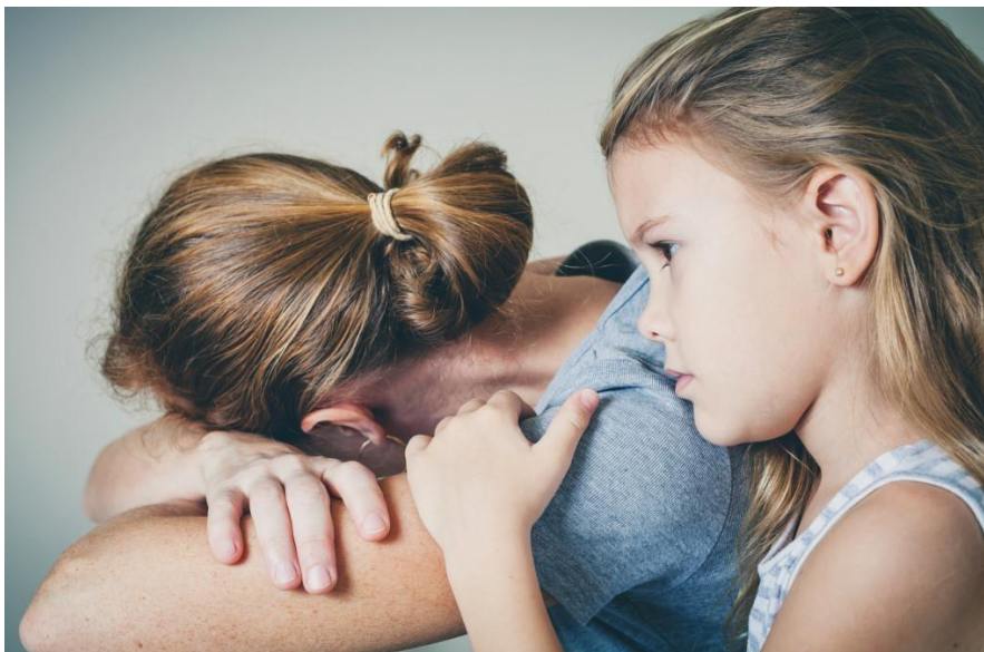
Slika 2. Depresija majke ( https://ljekarnik.hr/2016/02/05/depresija-roditelja-moze-utjecatinaskolske-ocjene-djeteta/ )