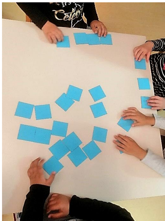
Slika 7. Igra memory sa morskim životinjama

Nakon razgovora i uvida u poznavanje teme uslijedili su didaktički poticaji. Veoma je brzo pozornost djece u skupini bila privučena novim igrama. Djeca su imala pristup važnim didaktičkim igrama memory (Slika 7). Memory je dobro poznata igra djeci u vrtićima, ali bez obzira na to što je često igrana, privukla je djecu. Sva su djeca aktivno bila uključena u igru, nije bilo promatrača. Ova stolno-manipulativna igra, koja razvija koncentraciju i pamćenje, podsjetila je djecu na različitost životinjskog morskog svijeta te je stečen uvid u sam izgled životinja.