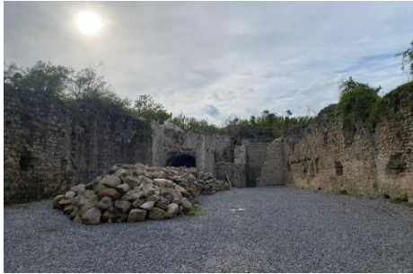
Unutrašnjost utvrde Jelengrada