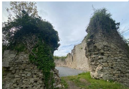
Ulaz u utvrdu Jelengrad