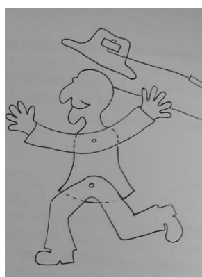
Žica vodilica na lutki