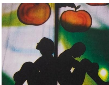
Tijela u kazalištu sjena