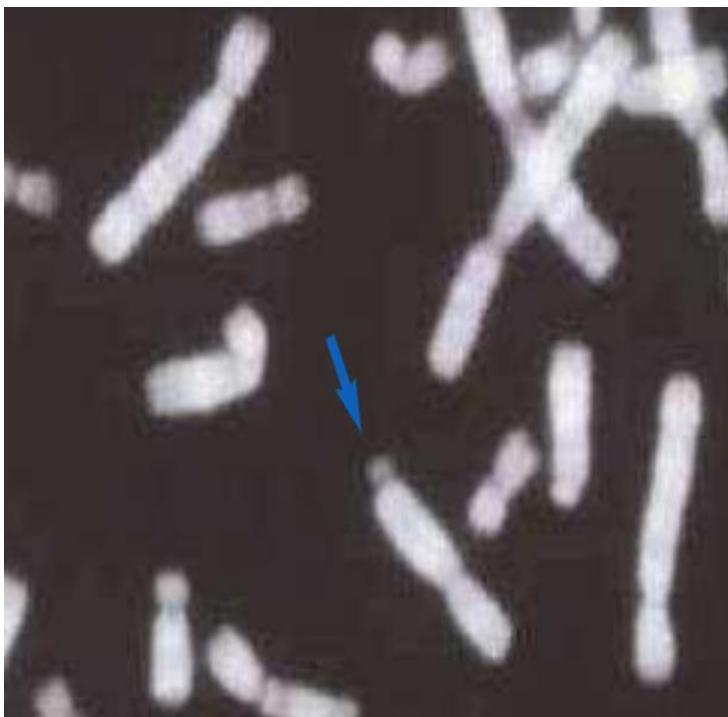
Slika 3. X kromosom na kojem je vidljivo fragilno mjesto

Javlja se sa učestalošću od 1:4000 muškaraca, odnosno 1.8000 žena, pa se danas općenito smatra najčešćim uzrokom nasljedne mentalne retardacije. Dosad je otkriveno jedanaest genskih lokusa (određeno mjesto na kromosomu koje zauzima gen odnosno sekvencija DNK) odgovornih sa devet pretežno neurologijskih bolesti kod kojih se javlja ovaj zanimljiv oblik nasljeđivanja (Barišić, I., 1998).