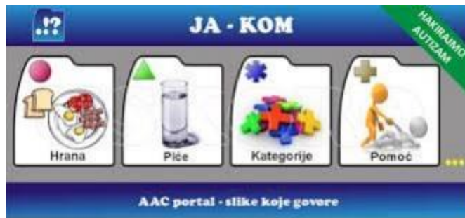
Slika 2. Primjer interaktivne komunikacijske ploče

Organizacija simbola koji se koriste mora biti motivirajuća za dijete i izabrana tako da kod djeteta potiče komunikaciju.