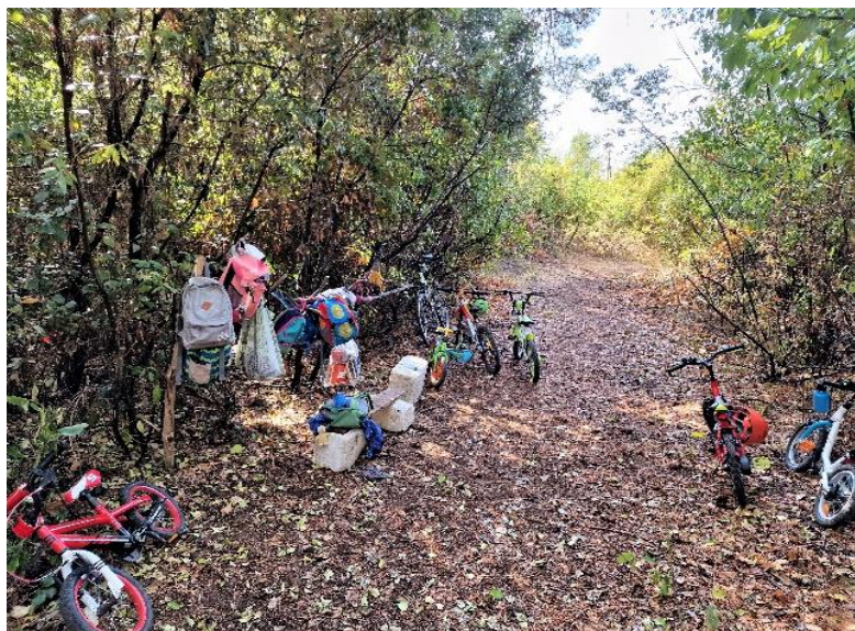
Slika1. Prostor za odlaganje opreme

Druga djeca, roditelji i odgojitelji se druže u centralno prostoru šume i razgovaraju (Slika 2). Atmosfera je opuštena, umirujuća, djeca nemaju nikakvih teškoća pri odvajanju, druže se, razgovaraju i zabavljaju. Uočava se kvalitetna komunikacija u kojoj je prisutna tolerancija i uvažavanje drugih. Djeca formiraju grupice prema zajedničkim interesima i spontano kreću u igru, mogu se slobodno kretati unutar većeg područja (Slika 3).