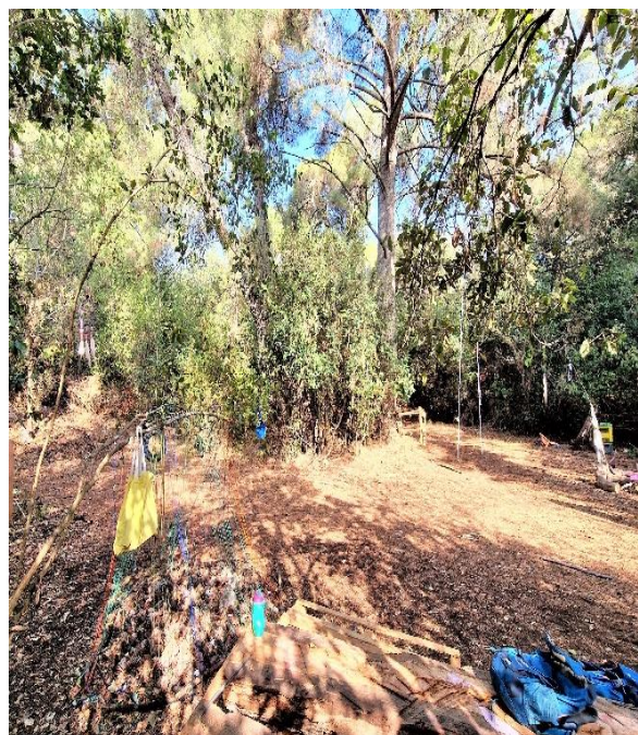
Slika 3. Prostor za igru