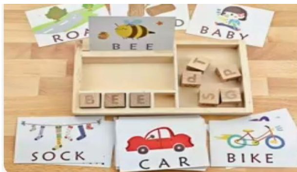
Slika 8- kartice s nazivima