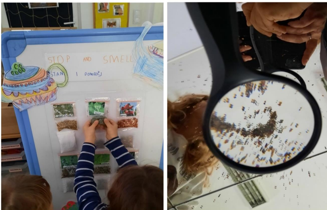
Slike 8 i 9

Slike 8 i 9 prikazuju dijelove istraživačkog centra. Djeca su istraživala strukturu čaja koristeći osjetila mirisa, opipa i vida. Miris i izgled čaja povezivali su s fotografijama biljaka. Posebno interesantan bio je stup „Stop and smell“ jer su djeca uživala u različitim mirisima čaja te su povezivali s onima koja smo već degustirali u skupini. Komentirala su koji čaj vole, a koji ne, mirise itd. Gledala su dokumentarni film o procesu izrade čaja. Istraživala su djelovanje vode na čaj i došli do nekih zaključaka: čaj boja vodu, ali se ne rastopi, ima specifičan miris, itd. Kasnije smo proveli i likovne aktivnosti. Djeca su izrađivala mirisne slike od čaja kombinirajući čaj i boje (tempera i vodene boje). Izradili smo aplikacije za pjesmu „I'm a little teapot.“. U ovom primjeru to su vizualni poticaji koji prate radnju pjesme (čajnici). Prvo smo ih stavili na pano, a kasnije su ih djeca koristila manipulirajući njima uz pjesmu ili u dramskom centru. Time smo uz govor, uključili i izražavanje pokretom i dramatizacijom. Aktivnost smo dokumentirali fotografiranjem i video-snimanjem djece. Igre kao što su „What's missing?“ i „Point to the...“ dobar su medij za proigravanje i ponavljanje vokabulara kroz igru. U početku odgajatelj vodi, ali poslije djeca sama organiziraju igru. Starija djeca preuzimaju ulogu voditelja i pomažu mlađoj djeci. Organiziraju igru „škole“ ili se igraju na tepihu ili za stolom. U igri „What's missing?“ kartice su složene na stolu. Kada djeca ne