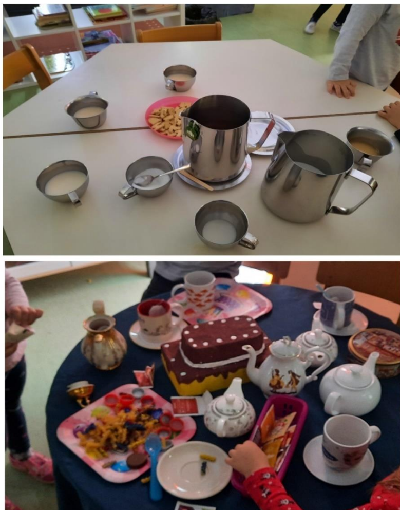
Slike 4 i 5

Na slici 4 prikazana je degustacija raznih vrsta čajeva i čaja s mlijekom koji su djeca spremno degustirala. Djeca su samostalno pripremala jedni drugima čaj uz koji smo ponudili i kekse što je bio dobar poticaj za međusobnu suradnju i komunikaciju. Aktivnost smo nastavili pripremanjem i kušanjem različitih vrsta čajeva. Na slici 5 prikazana je simbolička igra pijenja čaja i pripreme obroka u centru kuhinje. Djeca se dogovaraju, preuzimaju uloge, pripremaju obroke, kuhaju čaj, što se pokazalo kao poticajan kontekst za razvoj komunikacije na materinjem i engleskom jeziku.