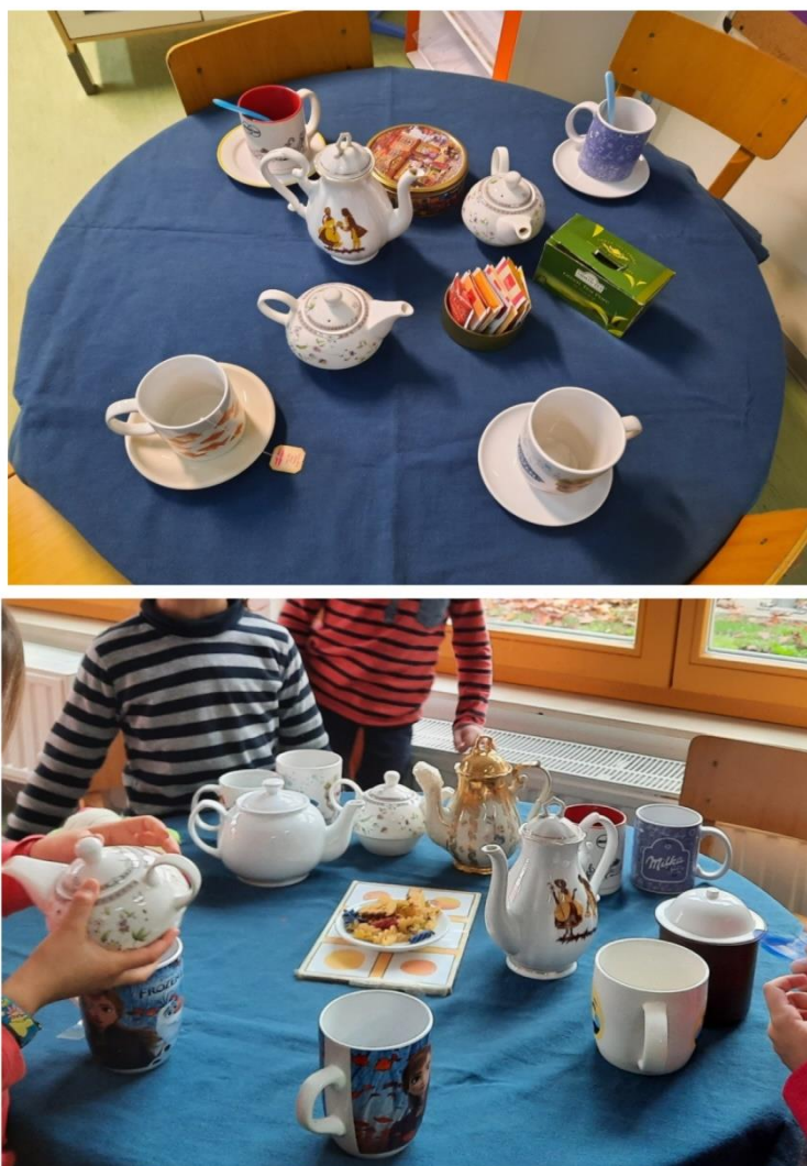
Slike 6 i 7

Slike 6 i 7 prikazuju postavljanje stola i igru koju vode starija djeca. Mlađa djeca se ponekad uključuju prema vlastitom interesu. Njihova simbolička igra usmjerena je na pripremanje i serviranje čaja. Djeca pokazuju veliki interes za učenjem stranog jezika pa zovu i odgajateljicu da im se pridruži u razgovoru i piju čaja. Imenuju potrebna sredstva za izradu čaja, ali traže i našu pomoć odnosno drago im je kad smo i mi uključeni u igru. Djeca na ovaj način uče nove, ali i ponavljaju već usvojene fraze: „Would you like tea?“, „Which one do you want?“, „Be careful!“, „Is it too hot?“, „Here you are.“ itd. U igri često odlaze do panoa i promatraju što je sve potrebno za čaj i provjeravaju dali imaju sve potrebno i što još treba donijeti. Djeca uče jezik situacijski, kroz igru te međusobno komunicirajući i dogovarajući se.