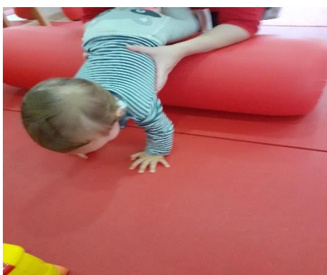
Slika 4: Vanjska (ispravna) rotacija ruku; prsti ispruženi