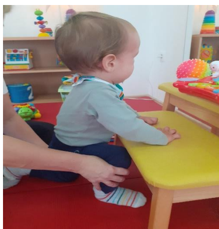
Slika 5: Vježbanje desnog iskoraka