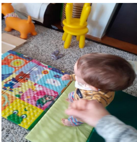
Slika 2: Hodanje