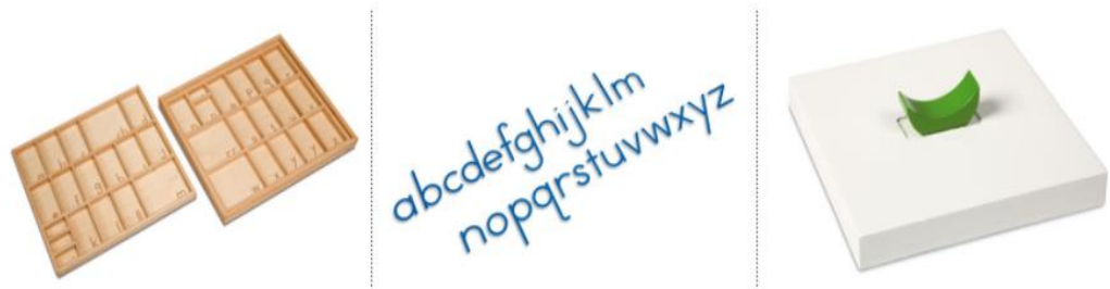
Slika 7. Pribor za razvijanje govora i jezika