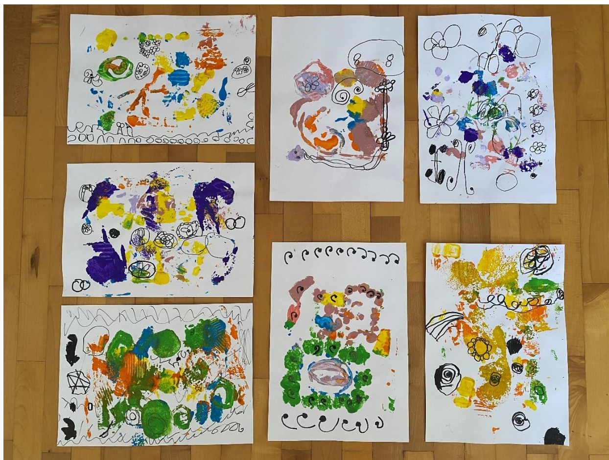
Slika 5. Završni radovi nakon otiskivanja i crtanja crnim flomasterom

Tijekom njihovog rada zamijetila sam da su se djeca fokusirala na jednu sliku koja im se najviše svidjela. Mali je broj djece pokazao interes za kombiniranje motiva s različitih slika. Samo jedno dijete se fokusiralo na jedan motiv kroz cijeli svoj rad, dok su ostala djeca kombinirali više motiva koje su uočili na slikama.