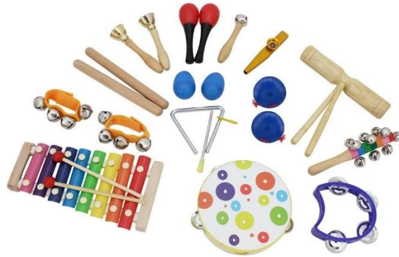
Sl. 3. Prikaz Orffovog instrumentarija

( https://www.aliexpress.com/item/4000834567686.html )