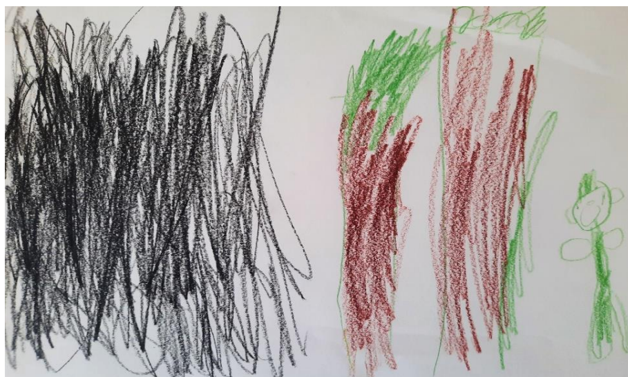
Slika 8. Osjećaj straha – dječak I. (7 god.)

Dječak I. opisuje da ga je strah da ne ostane sam u mraku u šumi. Rekao je da mu se to nikad nije dogodilo, ali da bi ga bilo jako strah da se dogodi.