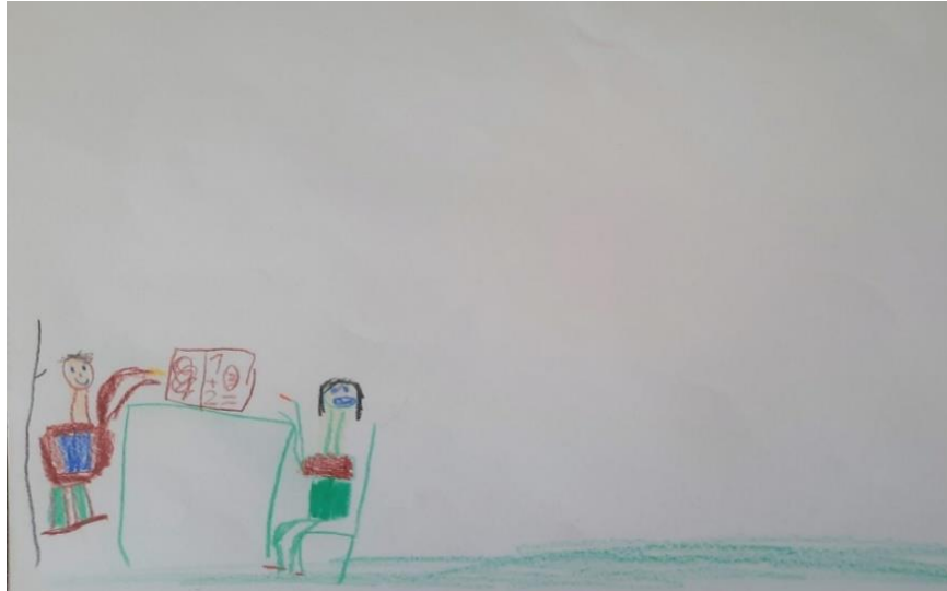
Slika 11. Osjećaj ljutnje – djevojčica M. (6,5 god)

Djevojčica M. objašnjava da ju ljuti kada joj mlađi brat pošara zadaću iz Aloha-e i onda joj se još smije u lice.