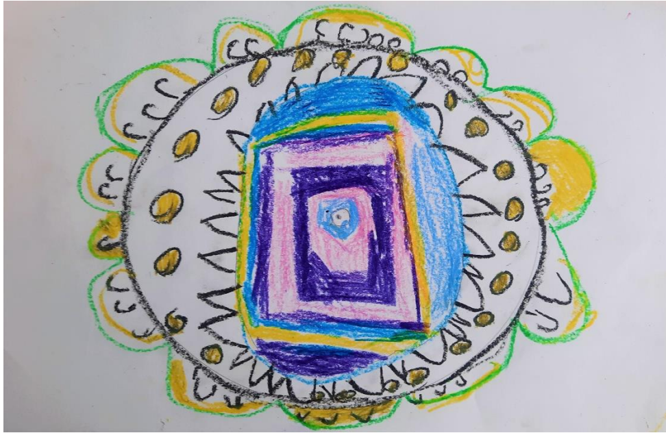
Slika 12. „Mandala“ – djevojčica D. (6 god)