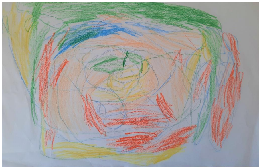
Slika 2. Scribble – dječak I. (7 god.)

Dječak T. obojio je jedan manji dio između crta, ali kako inače nema strpljenja za bojanje, počeo je bojati preko svih linija. Kada je završio, pogledao je crtež i ponosno rekao: „teta, pa ja ovdje vidim ribu!“ Sva djeca su se složila s njim i komentirala da i oni vide ribu. T. je zatim nadodao more, mjehuriće i oko.