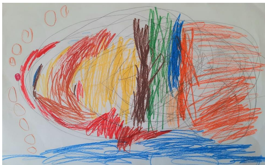
Slika 3. Scribble – dječak T. (5,5 god.)

Dječak T. obojio je jedan manji dio između crta, ali kako inače nema strpljenja za bojanje, počeo je bojati preko svih linija. Kada je završio, pogledao je crtež i ponosno rekao: „teta, pa ja ovdje vidim ribu!“ Sva djeca su se složila s njim i komentirala da i oni vide ribu. T. je zatim nadodao more, mjehuriće i oko.