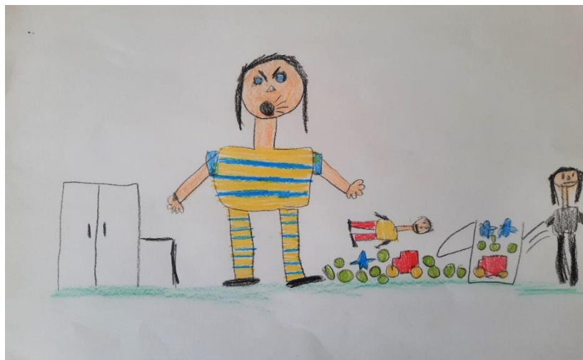
Slika 7. Osjećaj straha – djevojčica M. (7 god.)

Djevojčica M. prikazala je osjećaj straha kao mamu koja viče na njenog mlađeg brata jer je razbacao igračke po cijeloj sobi.