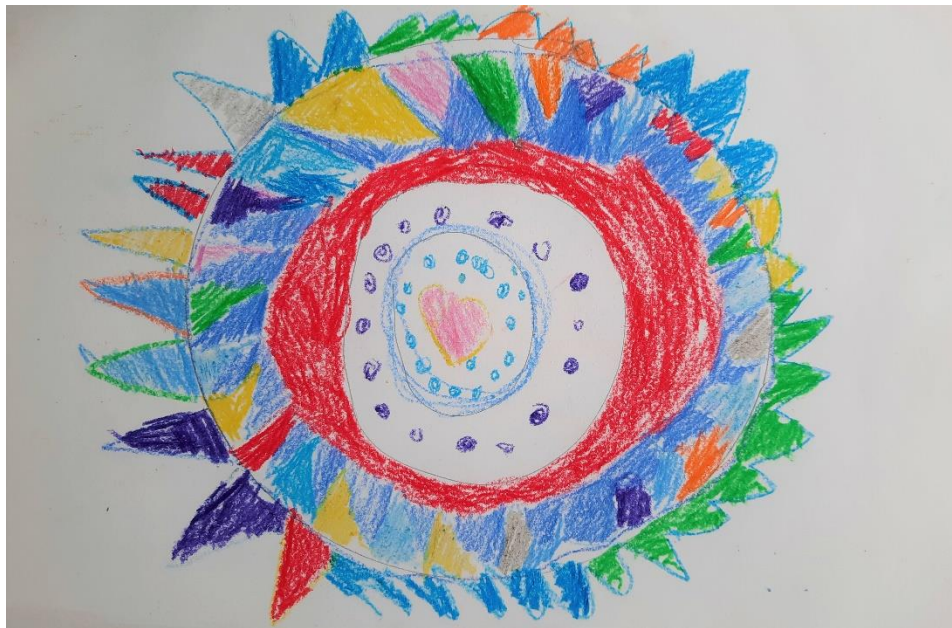
Slika 13. „Mandala“ – djevojčica M. (6 god)