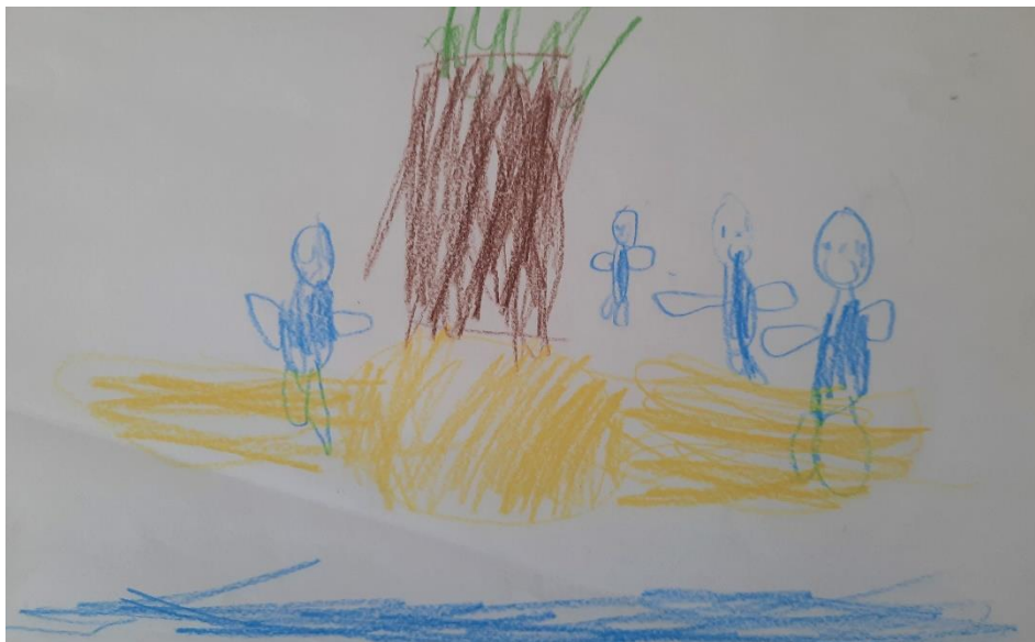
Slika 15. „Moje sigurno mjesto“ – dječak I. (7 god.)

T. je neko vrijeme razmišljao o tome što će nacrtati, mučilo ga je pitanje je li to što želi nacrtati tavan ili podrum pa je na kraju odlučio da je to ipak tavan. Dječak je opisao crtež: „ovo sam ja na tavanu, svuda oko mene je mrak, gledam zvijezde i nitko me ne može vidjeti.“ Kasnije je nacrtao i planete.