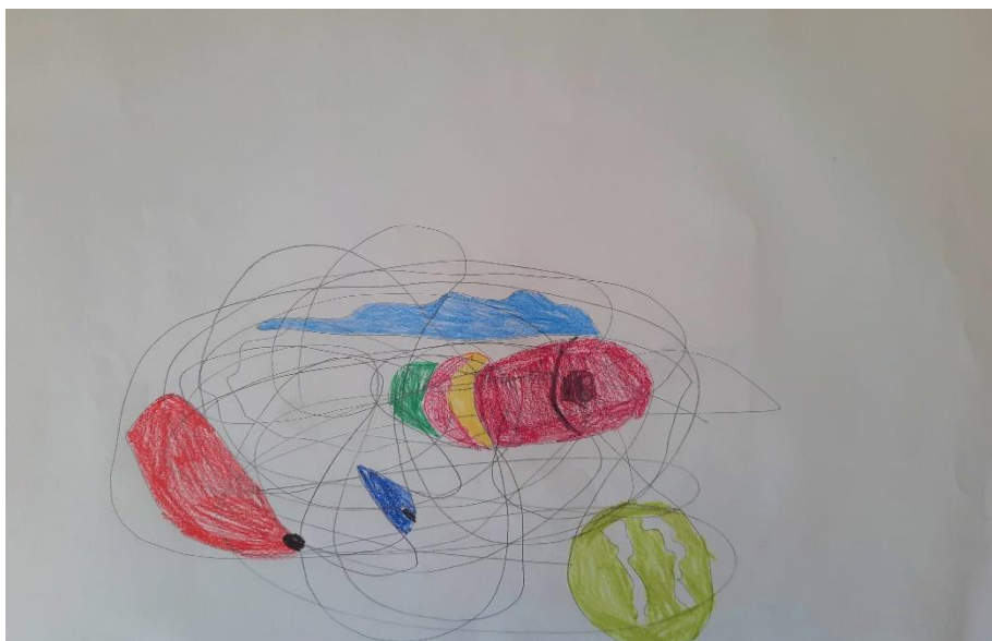
Slika 1. Scribble – djevojčica M. (7 god.)

Scribble tehnika vrlo se svidjela djevojčici M. Od samog početka aktivnosti pomno je slušala upute te se udubila u cijeli proces. Djevojčica je vrlo pedantna i obraća pozornost na svaki detalj. Prvo što je primijetila su valovi, a onda je dalje nastavila u tom nekom ljetnom tonu. Vidjela je ribu, školjku, šator i tenisku lopticu. Kada je dovršila rad, rekla je: „teta, ovo je ljetni odmor! Meni treba odmor!“