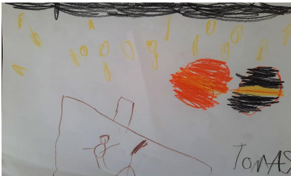
Slika 16. „Moje sigurno mjesto“ – dječak T. (6 god.)

T. je neko vrijeme razmišljao o tome što će nacrtati, mučilo ga je pitanje je li to što želi nacrtati tavan ili podrum pa je na kraju odlučio da je to ipak tavan. Dječak je opisao crtež: „ovo sam ja na tavanu, svuda oko mene je mrak, gledam zvijezde i nitko me ne može vidjeti.“ Kasnije je nacrtao i planete.