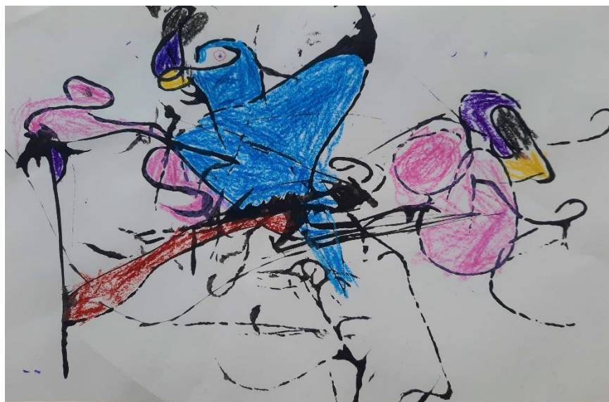
Slika 6. „Ptica na grani“ – djevojčica K. (6 god)

K. je prvo uočila pticu kojoj je samo obojila glavu, tijelo i krilo, a kasnije je uočila rep i granu na kojoj ptica sjedi. Ptica u kljunu drži ribu. Lijevo od ptice nalazi se zmija, a desno od ptice druga ptica koja je okrenula leđa. Djevojčica tijekom crtanja često postavlja pitanja poput „jesam li dobro obojila“, „smijem li ovo obojiti“ „što misliš ti teta o ovome“ i slično.