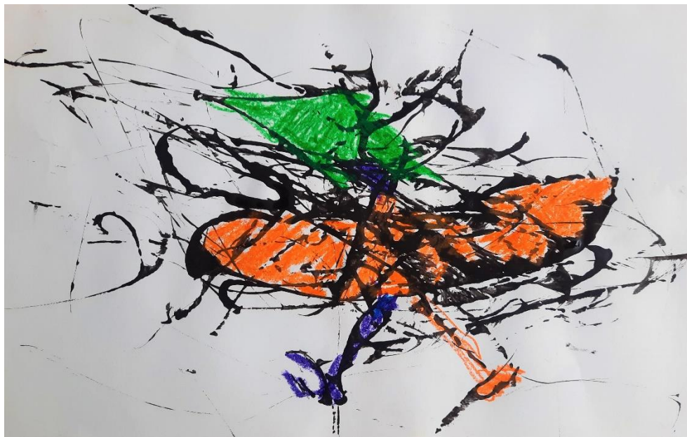
Slika 5. „Brod“ – dječak M. (6 god)

K. je prvo uočila pticu kojoj je samo obojila glavu, tijelo i krilo, a kasnije je uočila rep i granu na kojoj ptica sjedi. Ptica u kljunu drži ribu. Lijevo od ptice nalazi se zmija, a desno od ptice druga ptica koja je okrenula leđa. Djevojčica tijekom crtanja često postavlja pitanja poput „jesam li dobro obojila“, „smijem li ovo obojiti“ „što misliš ti teta o ovome“ i slično.