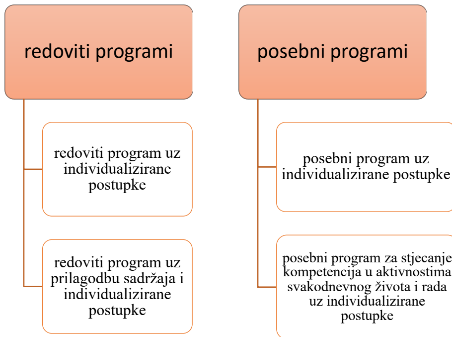
Slika 1. : Shematski prikaz primjerenih programa odgoja i obrazovanja učenika s teškoćama

Odgojno-obrazovno uključivanje učenika s teškoćama ovisi o vrsti i stupnju teškoće. Pravilnikom o osnovnoškolskom i srednjoškolskom odgoju i obrazovanju učenika s teškoćama u razvoju (NN 24/15) razlikujemo četiri primjerena programa odgoja i obrazovanja učenika, a oni su prikazani u shemi 1.