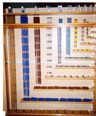
Slika 5. Materijal za matematiku (izvor: http://os-montessori-bdvranczany-zg.skole.hr/skola )