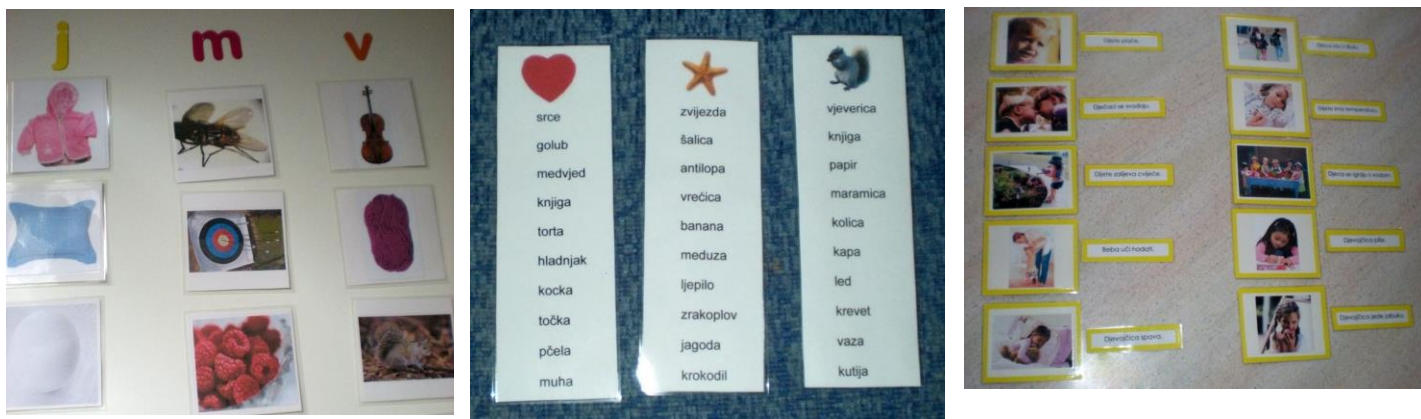
Slika 6. Materijal za jezik