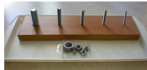
Slika 3. Materijal za praktične vježbe (izvor: http://os-montessori-bdvranyczany-zg.skole.hr/skola )