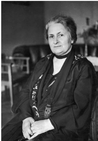
Slika 1. Maria Montessori

Kad je izbio Drugi svjetski rat Maria Montessori i njezin sin Mario boravili su u Indiji gdje je održavala tečajeve. Bila je gotovo sedam godina u Indiji i podučavala skoro 1000 učitelja. Postala je poznata i priznata u cijelom svijetu i predložena za Nobelovu nagradu za mir. Maria Montessori Po povratku u Europu živi u Nizozemskoj. Maria Montessori umrla je 6. svibnja 1952. planirajući put u Ganu, gdje je trebala podučavati afričke učitelje (Philipps, 1999; Topolovčan, Rajić i Matijević, 2017).