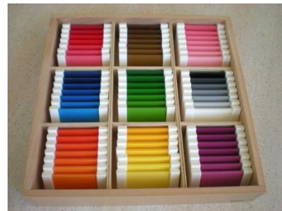
Slika 4. Materijal za razvoj osjetilnosti (izvor: http://os-montessori-bdvranyczany-zg.skole.hr/skola )