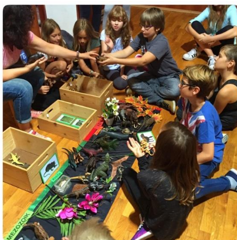
Slika 7. Kozmički odgoj (izvor: http://os-montessori-bdvranyczany-zg.skole.hr/skola )

„Kozmički odgoj potiče razvoj i praćenje individualnih talenta i interesa svakog djeteta da bi se na kraju približilo svojoj „kozmičkoj zadaći“, a to je pronalaženje svog mjesta u ovom kozmosu na vlastito zadovoljstvo i zadovoljstvo zajednice koja ga okružuje“ (Seitz i Hallwachs, 1997).