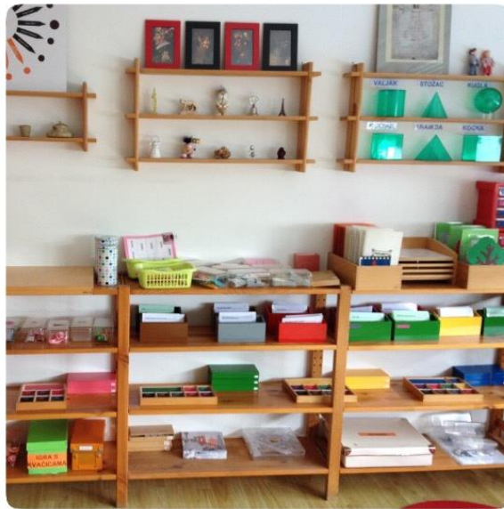
Slika 2. Materijal u Osnovnoj Montessori školi „Barunice Dédée Vranyczany“

Montessori materijali djeluje preko manualnog rada, ponavljanja i osjetilnog iskustva na duhovni razvoj djece. Djeci se pruža mogućnost samostalnog ili grupnog rada tako što se bave ponuđenim materijalom“ (Seitz i Hallwachs, 1997). Ona je razvila svoje materijale polazeći od pedagoške prakse. Većina tih materijala je još i danas tako aktualna kao što je bila i za vrijeme njezinog života. Neki materijali su već osuvremenjeni i dalje su razvijeni. Maria Montessori je označila svoj materijal „ključem koji otvara vrata u svijet“. Smatrala je važnim da se materijal ne zamijeni sa stvarnim svijetom. Materijal čini osnovu za red preko koje djeca mogu spoznati odnose i veze koje vladaju i svijetu i preko konkretnog rada mogu spoznati i sam svijet (Seitz i Hallwachs, 1997).