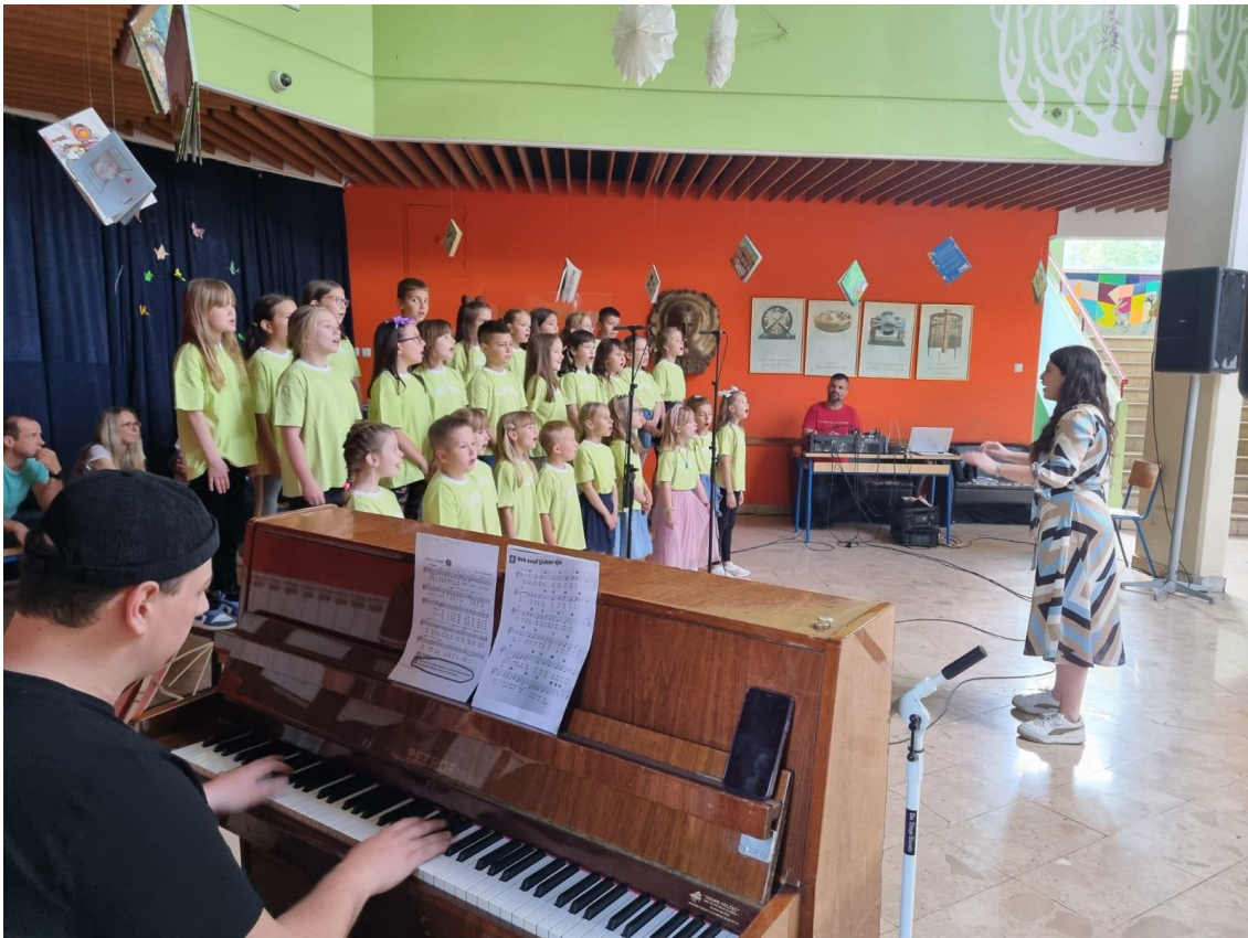
Slika 13. Otvaranje predstave s pjesmom Vjeruj u ljubav