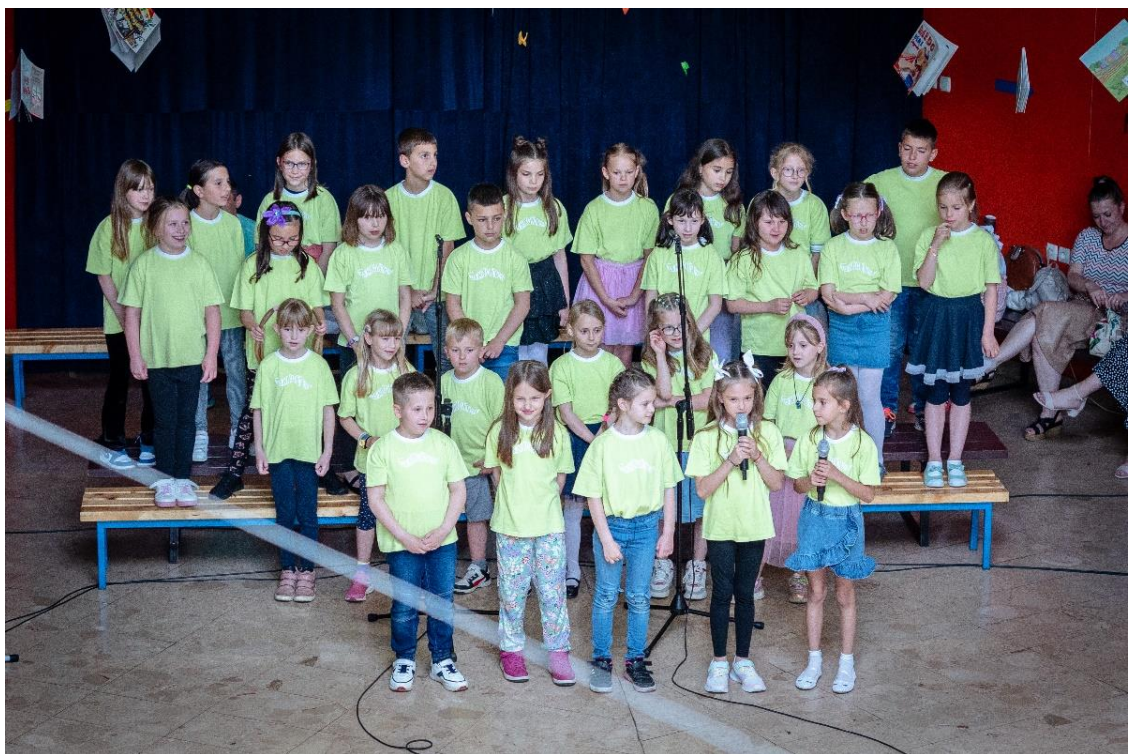
Slika 12. Recitacija učenika pjesme Roditeljska ljubav