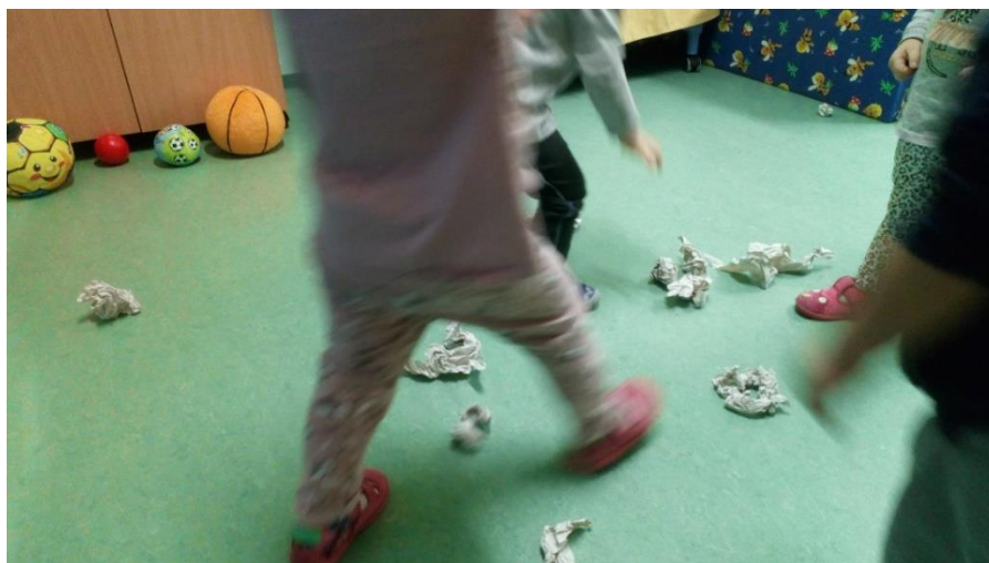
Slika 6. Igra papirom – grudanje (autorski rad)