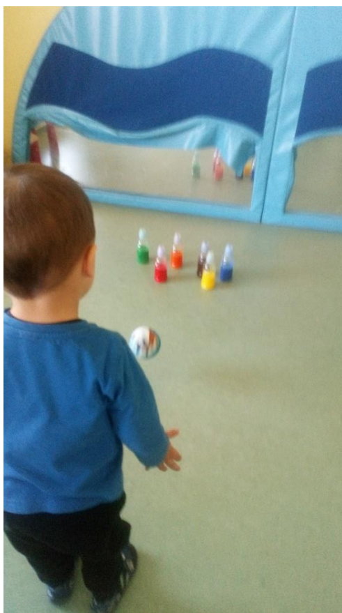
Slika 5. Igra kuglane (autorski rad)