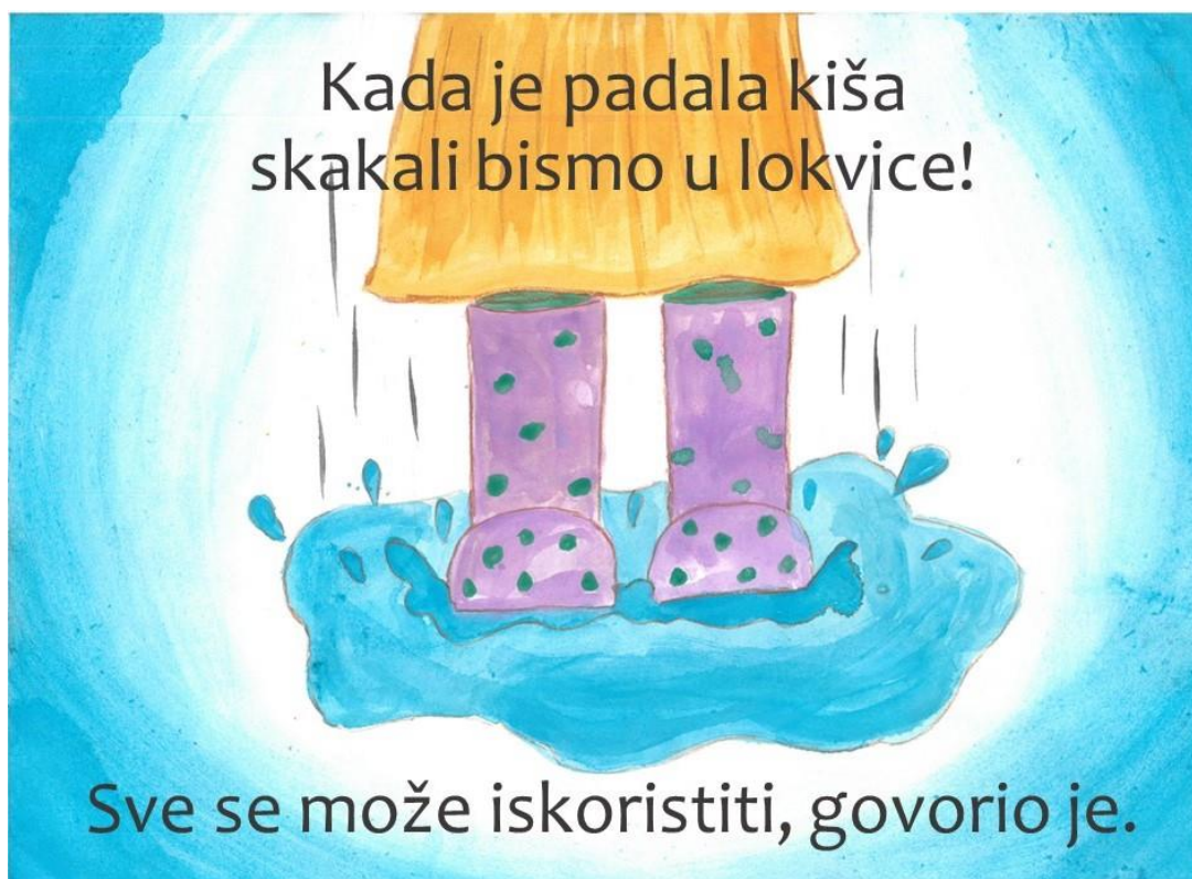
Slika 13. Jedanaesta stranica slikovnice „Ti i ja“