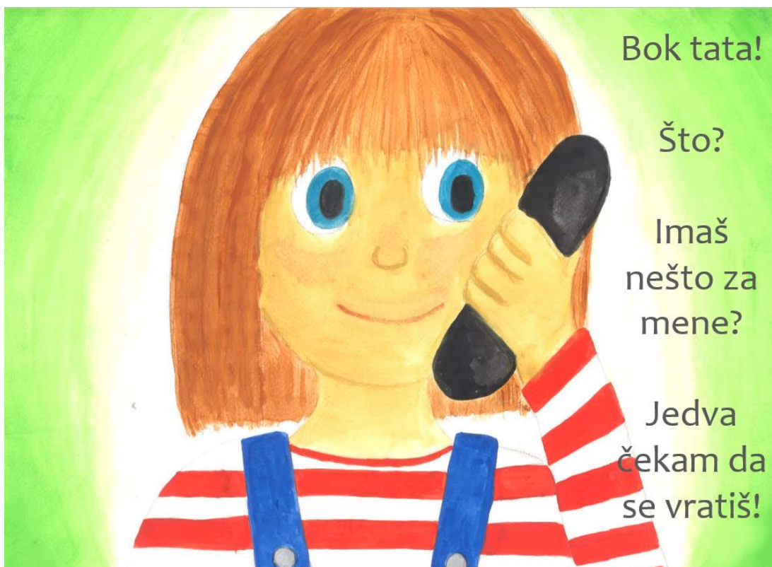
Slika 6. Četvrta stranica slikovnice „Ti i ja“