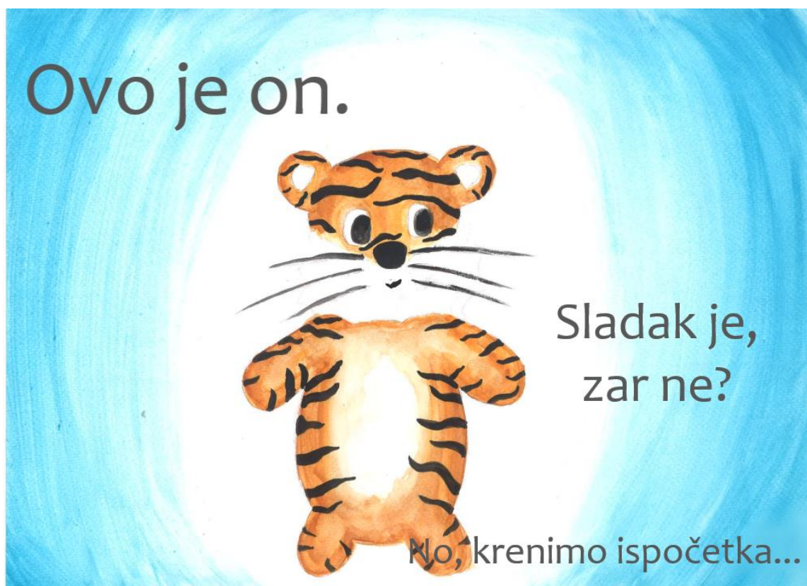
Slika 4. Druga stranica slikovnice „Ti i ja“