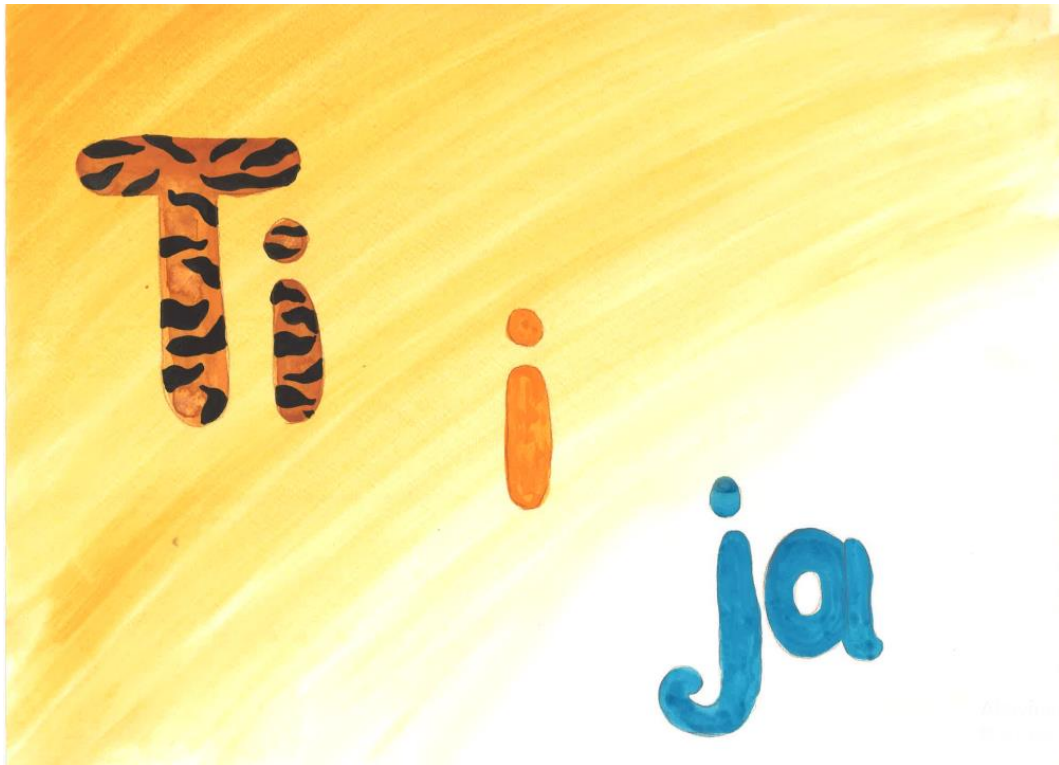
Slika 2. Naslovna stranica slikovnice „Ti i ja“