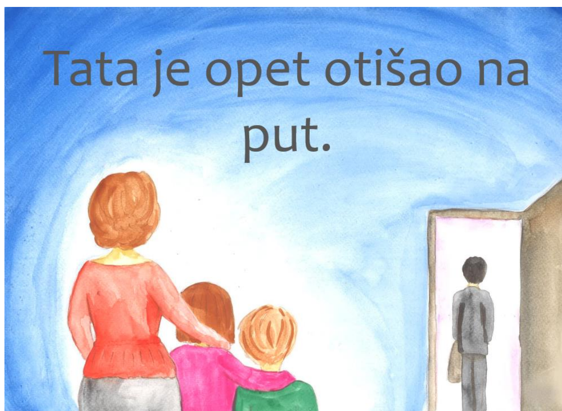
Slika 5. Treća stranica slikovnice „Ti i ja“