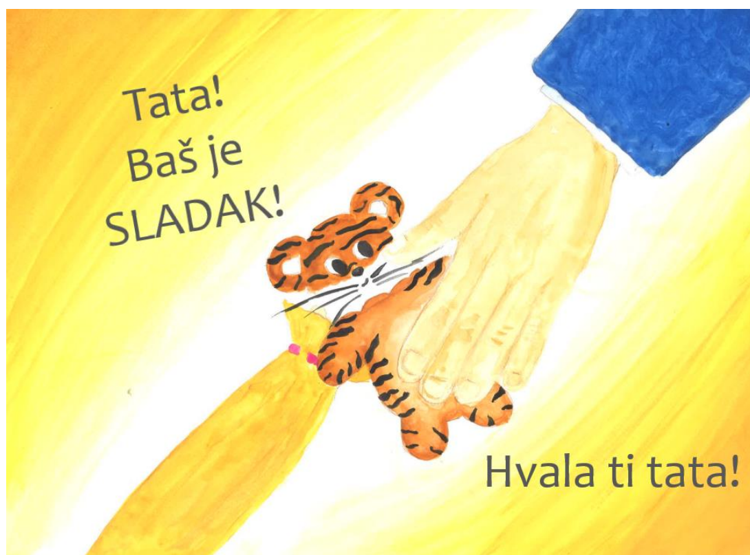
Slika 7. Peta stranica slikovnice „Ti i ja“