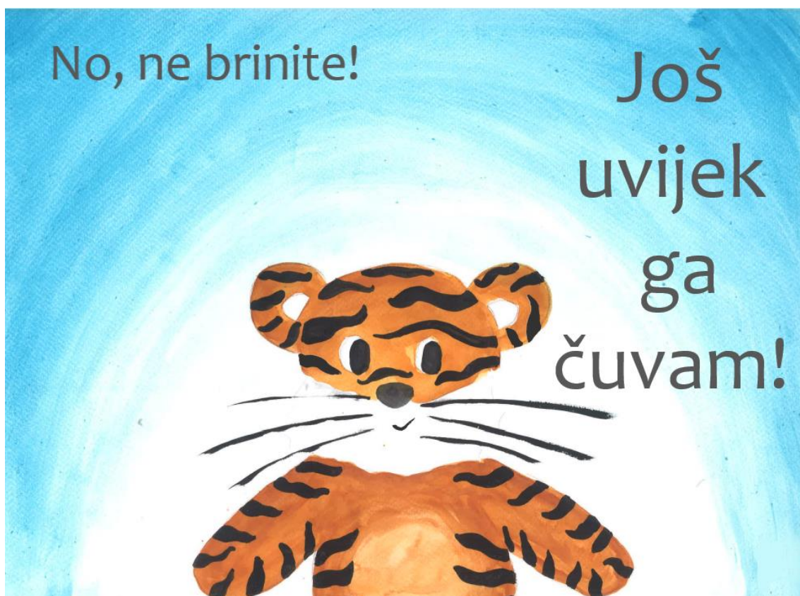
Slika 17. Petnaesta stranica slikovnice „Ti i ja“