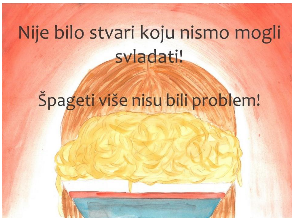
Slika 12. Deseta stranica slikovnice „Ti i ja“