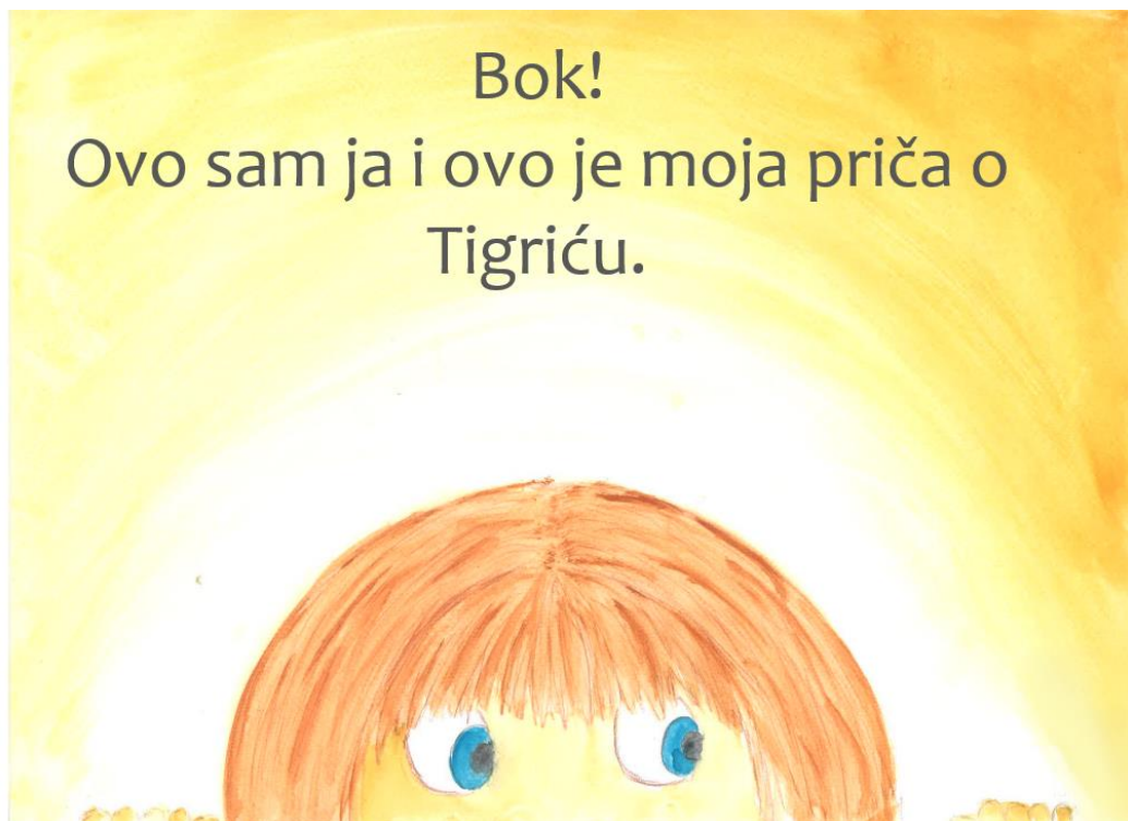
Slika 3. Prva stranica slikovnice „Ti i ja“