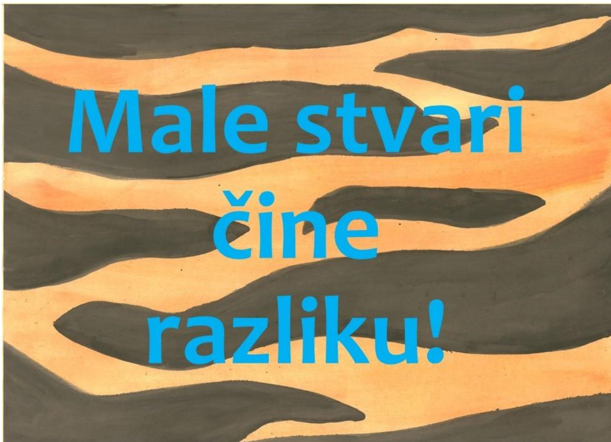
Slika 18. Posljednja stranica slikovnice „Ti i ja“