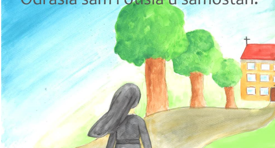
Slika 16. Četrnaesta stranica slikovnice „Ti i ja“