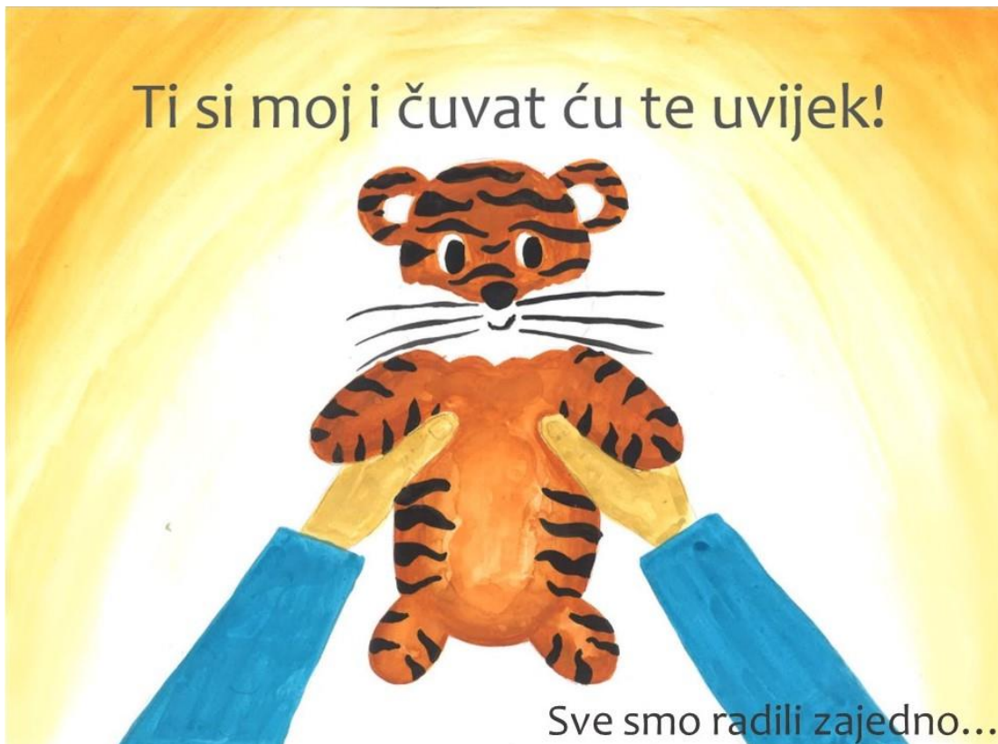
Slika 8. Šesta stranica slikovnice „Ti i ja“