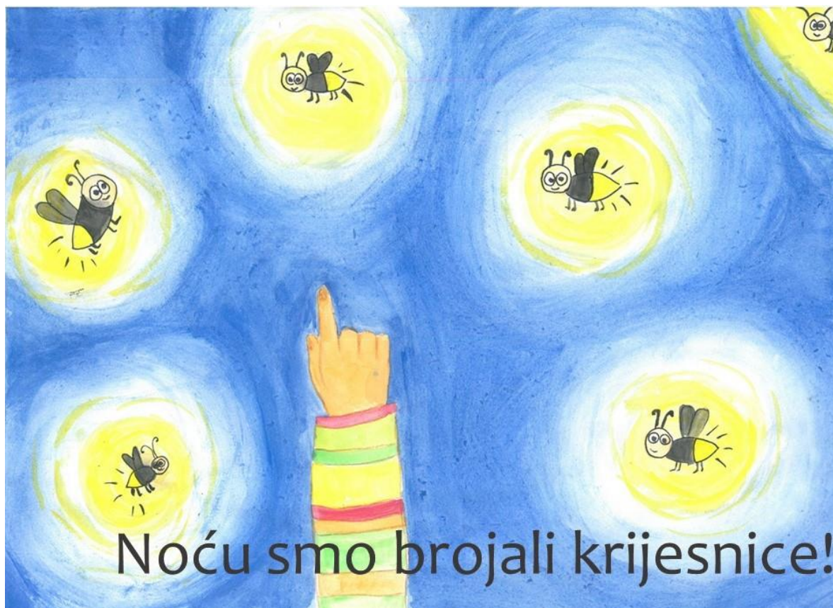
Slika 10. Osma stranica slikovnice „Ti i ja“