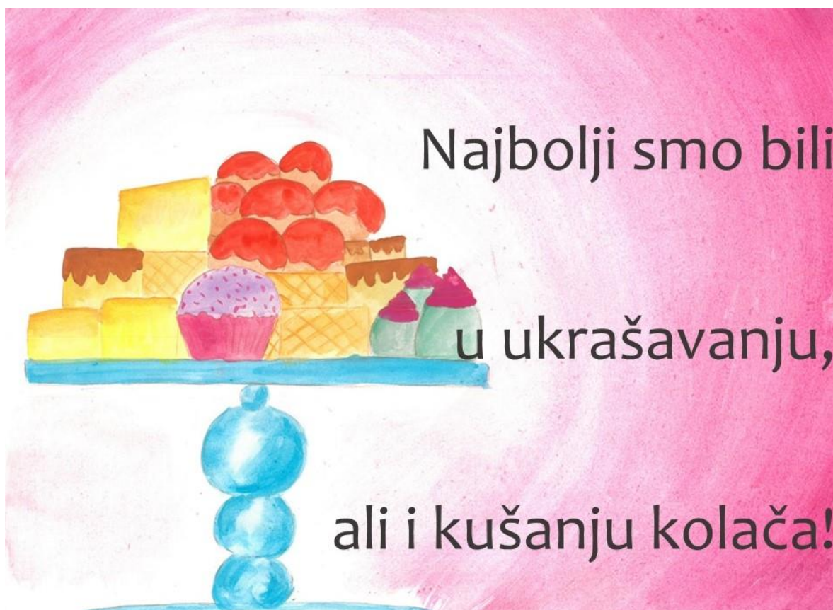
Slika 11. Deveta stranica slikovnice „Ti i ja“