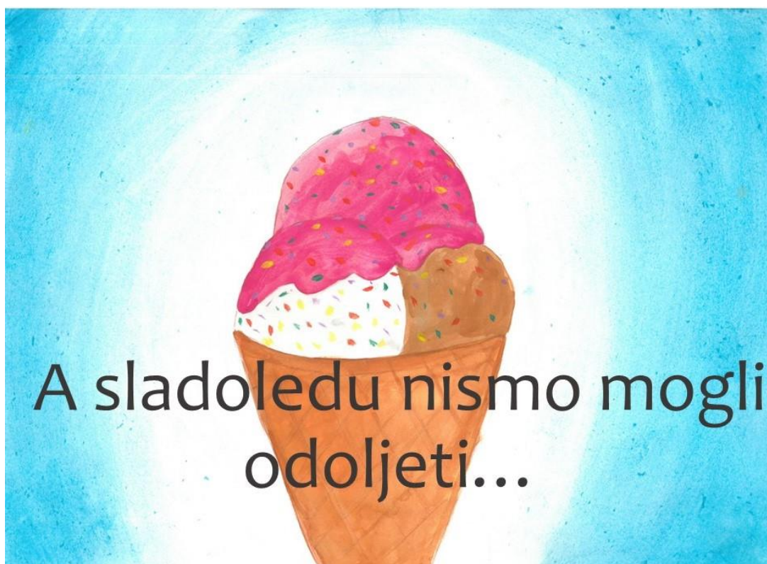
Slika 14. Dvanaesta stranica slikovnice „Ti i ja“

Osvajali smo plaže i radili najveće kule u pijesku!