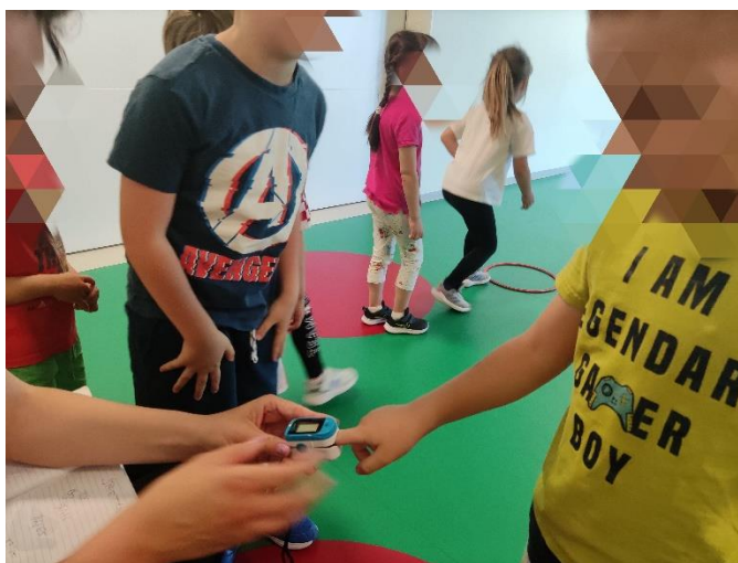
Slika 2. Mjerenje pulsa oksimetrom

Način na koji se utvrđuje fiziološko opterećenje djece za vrijeme vježbanja u ovom je istraživanju mjerenje pulsa. Dakle, svako je dijete nakon istrčanog kruga u štafeti došlo do odgojitelja koji mu je uz pomoć oksimetra izmjerilo puls. Oksimetar je digitalni prijenosni uređaj koji je namijenjen za mjerenje otkucaja srca i zasićenosti kisika, jednostavan je za primjenu i kod odraslih i kod djece. Na isti način mjerenje se provelo u obje skupine i zasebno su se bilježili rezultati kod sudionika polaznika redovnog programa i sportskog programa. Nadalje, prilikom obavljanja vježbi u poligonu, pratila se njihova sposobnost u obavljanju istih od strane autora rada te lakoća shvaćanja zadatka koji se postavio pred njih. Preciznije, kvalitativne varijable koje su se pratile su ravnoteža za vrijeme bočnog hodanja po užetu i ravnoteža čučnja po hrapavoj površini, koordinacija prilikom hodanja četveronoški oko čunjeva i sunožnih skokova u ljestvama za preskakanje, gdje se može isto tako pratiti i brzina.