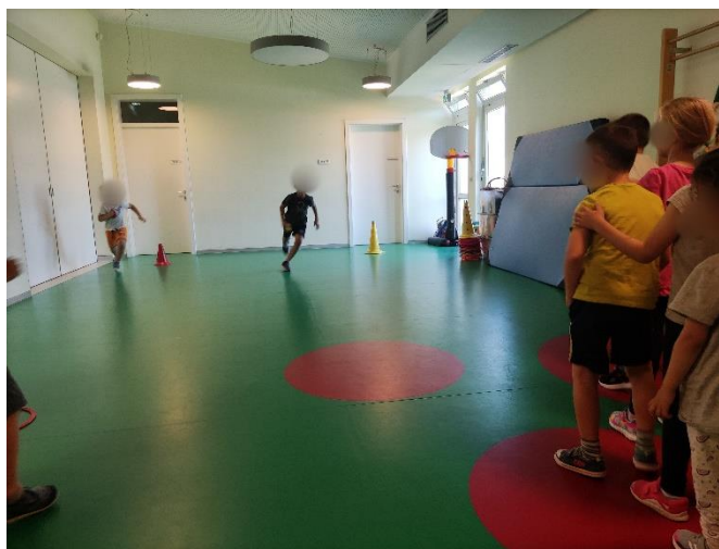
Slika 1. Štafetna igra

Ovo istraživanje provest će se na sljedeći način: održat će se dva sata tjelesne i zdravstvene kulture, jedan s djecom polaznicima sportskog programa, a drugi s polaznicima redovnog programa. Tijekom glavnog B dijela, štafetne igre, izmjeriti će se puls kod petero djevojčica i petero dječaka u obje skupine te će se pratiti njihov interes za obavljanje zadataka i promatrati suradnja s ostalom djecom za vrijeme vježbanja. Također, pratit će se i trajanje same štafetne igre, odnosno pratit će se vrijeme koje je potrebno za trčanje štafete u obje skupine. Isto tako, slušanjem njihovih komentara može se ponešto zaključiti o njihovoj zainteresiranost za rad.