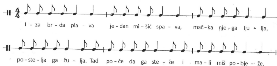
Slika 6. Brojalica Iza brda plava (Kraljić, 2016, str. 49)