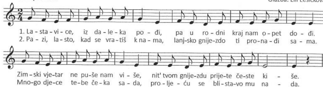
Slika 3. Pjesma Lastavica (Kraljić, 2016, str. 16)

Tekst: M. Nevolin Glazba: Lili Lesičkova