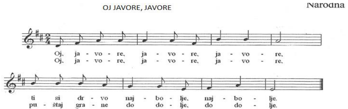
Slika 10. Pjesma Oj javore, javore (Gospodnetić, Novosel i Blašković, 2010, str. 39)

Aktivnost usvajanja pjesme može se provoditi uz aplikacije javorova lišća ili šarenih trakica koje djeca u pjesmi mogu pokretati i tako označavati javorove grane obrasle listovima.