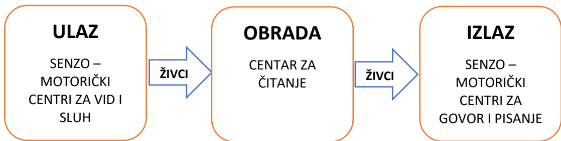
Slika 1: Proces obrade podataka u mozgu prilikom čitanja

Sukladno gore prikazanoj slici funkciju ulaza podataka u mozak ostvaruje se pomoću osjeta sluha i osjeta vida. Sluh i vid senzo-motorni su centri u mozgu koji su živcima povezani s centrom za čitanje. Podatci se kreću pomoću senzo-motornih centara i živaca do centra za čitanje u kojemu se odvija obrada podataka. Proces obrade podataka prilikom čitanja može se podijeliti na „proces jednostavne obrade i viši proces obrade“ ( Čudina – Obradović, 2008, str. 18). Proces jednostavne obrade odnosi se na samu tehniku čitanja. Tehnika čitanja ostvaruje se primjenom abecednoga načela, tj. spoznajom korespondencije između napisanoga slova i pročitanaoga glasa. Viši proces obrade odnosi se na procesuiranje i povezivanje dobivenih informacija koje će rezultirati razumijevanjem pročitanaoga. Razumijevanje pročitanaoga teksta rezultira izlaznim funkcijama govora i pisanja. Naime, nakon obrade teksta u centru za čitanje, putem živaca se obrađene i razumljive informacije šalju do senzo-motornih centara zaslužnih za govor i pisanje. Pomoću tih centara čovjek je sposoban propitivati i zapisivati informacije na temelju pročitanaoga teksta.