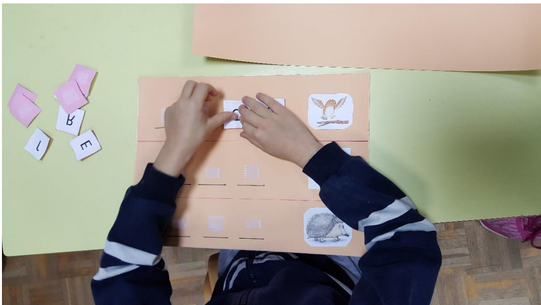
Slika 3: Igra „Sastavljanje riječi“

Druga igra u centru početnog čitanja i pisanja je igra pod nazivom „Sastavljanje riječi“. Igra je sačinjena od dvije šperploče, čička, tvrdog i običnog papira od kojeg su načinjene i pričvršćene sličice i velika tiskana slova. Na svakoj tabli nalaze se tri sličice. Vodoravno uz svaku sličicu napisan je broj crtica koliko riječ broji slova. Pomoću čička, djeca su pridodavala slova kako bi stvorila riječ na temelju slike. Riječi su povezane s pričom: (lisica, jež, sir, miš, sova, i slon). U ovoj igri djeca su uvježbavala prepoznavanje slova i korespondenciju između slova i glasova. Također je većina djece bez puno poteškoća moglo sastavljati slova u riječ. (slika 3)