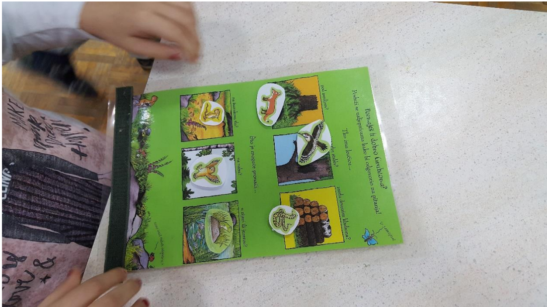
Slika 8: Igra „Pridruživanje slika odgovarajućem mjestu“

U igri pridruživanja slika na odgovarajuće mjesto, djeca su uz pomoć čička pridruživala slike životinja iz priče (miš, sova, lisica, zmija, žaba i ptica) na sličicu koja odgovara njihovom staništu, odnosno njihovom „domu“ u priči ( pod zemljom, na vrhu stabla, među drvenim kladama, na šumskom tlu, na nebu i na jezeru). (slika 8)