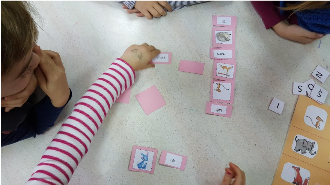
Slika 4: Igra „Memory“

U stolno manipulativnom centru nalazila se igra „Labirint“. U središtu labirinta nalazi se miš, a oko njega lisica i zmija. Zadatak je bio „izvesti miša iz šumske tmine na sigurno“, odnosno pomoću markera tražiti izlaz na plastificiranome predlošku labirinta. (slika 5)