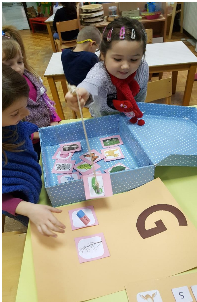
Slika 2: Igra „Pecanje“, izvor: osobni arhiv

g: (grožđe, gljiva, grubzon, grana, gitara, grablje, gol). Djeca „pecaju“ odnosno pomoću magneta i metala izvlače sličice i raščlanjuju ih prema kriteriju počinje li izvučena sličica glasom „g“ ili bilo kojim drugim glasom. Pojmove na glas „g“ stavljaju na plakat sa napisanim slovom „g“. Djeca su bila jako zainteresirana za ovu igru i više puta je iznova igrali. Većina djece znala je pridružiti sličice prema početnome glasu što znači da je fonemska svjesnost zadovoljena. Cilj je razvijanje fonemske svjesnosti kod djece koji je važan preduvjet za učenje čitanja. U ovome slučaju, djeca su osim ponavljajućeg početnog glasa „g“ pored sebe imali i predložak napisanoga glasa što odgovara učenju prepoznavanja slova. (slika 2)