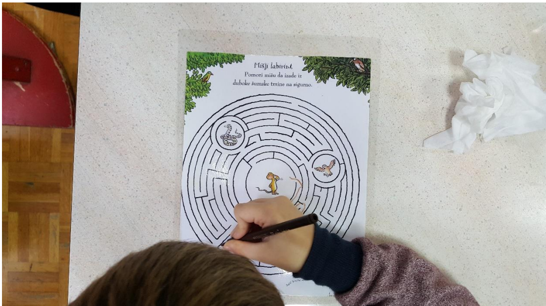
Slika 5: Igra „Labirint“

U stolno manipulativnom centru nalazila se igra „Labirint“. U središtu labirinta nalazi se miš, a oko njega lisica i zmija. Zadatak je bio „izvesti miša iz šumske tmine na sigurno“, odnosno pomoću markera tražiti izlaz na plastificiranome predlošku labirinta. (slika 5)