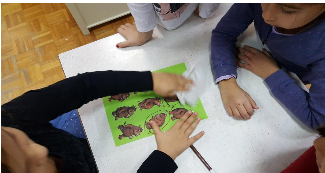
Slika 7: Igra „Uočavanje sličnosti i razlika 2“

Treća igra u stolno – manipulativnom centru djeca su između 9 sličica grubzona trebali zaokružiti dvije iste sličice grubzona. Također markerom na plastificiranome predlošku. (slika 7)