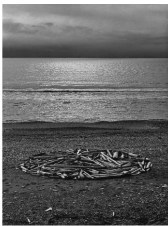
Slika 8. „Krug na Aljasci“, Richard Long, (1977).

Njegova umjetnička djela nastaju metodom premještanja, pa tako Long, sve ono što pronade u prirodi premješta kako bi kreirao novo umjetničko djelo. Na isti način nastaje i „Krug na Aljasci“ (1977), Slika 8. , „Six stone circles“ (1981), Slika 9. (Šuvaković, 2005: 342).