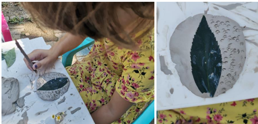
Slika 102. M. K. „Tanjur s listom i rupicama i nekim udubinama“.