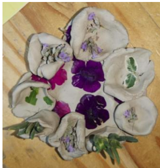
Slika 94. Tanjur s cvjetićima.

M. K. (5 godina i 8 mjeseci): „Ovo je jedan tanjur koji ima male cvjetice. Na tom tanjuru su male posudice, vaze neke sa svakakvim cvijećem. Ima osam različitih vaza sa svakakvim cvijećem za moju mamu“ ( Slika 94. ).