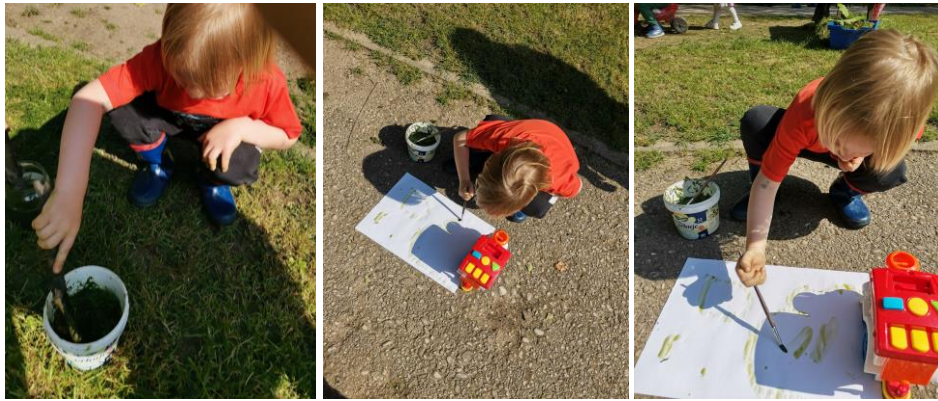
Slika 26., 27. i 28. Istraživanje sjene – slikanje bojom od trave; obris lika igračke (vlaka).

Istraživanje sjene događa se u kontekstu situacijskog poticaja. Dječak R. G. (4 godine) odvaja se od skupine djece te traži odgojitelja papir po kojem će crtati s bojom od trave. Postavlja papir na stazu. U blizini papira nalazi se igračka (vlak) te dječak primjećuje sjenu. R. G.: „Teta vidi, vidi se sjena na papiru.“ Dječak govori kako će nacrtati vlak, uzima ga i približava papiru te kistom i bojom od trave slika obrube vlaka, tj. njegove sjene. U zaključku ističe: „Teta sada kada maknem vlak ostat će vlak koji sam nacrtao, pogledaj“. Dječak miče igračku te u obrisima raspoznaje lik vlaka kojeg je naslikao.