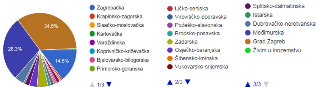
Slika 3. Zastupljenost ispitanika po županijama

U istraživanju je sudjelovalo ukupno 144 ispitanika (N=144) s područja Republike Hrvatske. Većina županija je zastupljena, od čega najviše Grad Zagreb, te Međimurska i Zagrebačka županija (Slika 3).