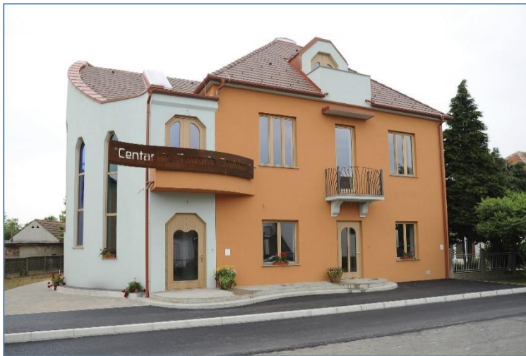
Slika 2. Centar dr. Rudolfa Steinera u Donjem Kraljevcu, (izvor: https://centar-rudolf-steiner.com/rodna-kuca/ )

Antropozofija (grčki: antrophos – čovjek i sofia – mudrost) je mudrost o čovjeku, ali i put spoznaje, koji želi duhovno u ljudskom biću dovesti ka duhovnom u svemiru (Santrić, 2011). U svojoj knjizi „Aspekti valdorfske pedagogije“ (2001) Steiner govori da antropozofija spaja teoretsko promatranje svijeta s neposrednim promatranjem života. Antropozofija polazi od prirodoznanstvenih temelja, ali traži i put do duhovne biti onoga što djeluje u prirodi.