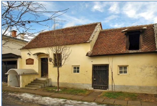
Slika 1. Rodna kuća dr. Rudolfa Steinera

Dr. Rudolf Steiner utemeljitelj je waldorfske pedagogije. Osim područja pedagogije, bavio se još i prirodnim znanostima, filozofijom, umjetnošću (arhitektura, slikarstvo i drugo) i književnošću temeljenima na duhovno-znanstvenom radu.