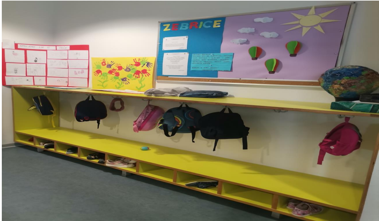
Slika 5. Garderoba vrtičke odgojne skupine