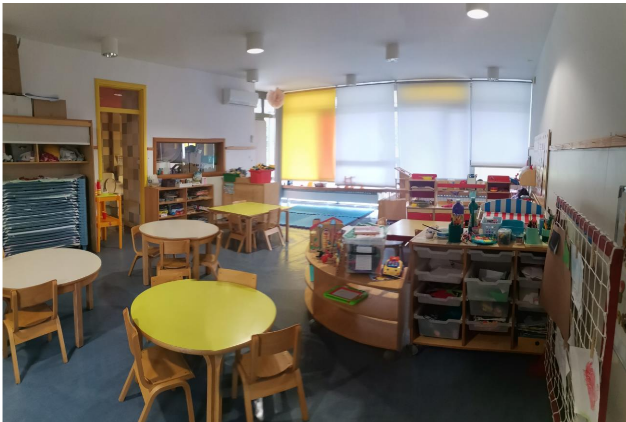
Slika 8. Soba dnevnog boravka starije jasličke odgojne skupine

S lijeve strane na prvom katu može se uočiti vizualno povezivanje svih soba dnevnog boravka što je postignuto postavljenim staklom uzduž zida s desne strane s kojim su povezana ulazna staklena vrata koja daju vizualni pregled cijele sobe već prilikom samog ulaska (Slika 9). Sobe vrtičkih odgojnih skupina pružaju dojam prozračnosti, ne samo zahvaljujući postavljenom staklenom zidu te vratima, već i prozorima koji su postavljeni po dužini nasuprotnog zida čime je ostvarena bolja preglednost i povezanost odgojnih skupina (Slunjski i sur., 2015). Uzimajući u obzir pedagoški aspekt, Miljak (2009) ističe da tradicionalno prostorno oblikovanje karakteriziraju izolirane sobe dnevnog boravka što se ovakvim dizajnom željelo izbjeći. Slunjski i sur. (2015) spominju neprikladnu uporabu staklenih površina kao mogući nedostatak arhitektonskih izvedbi prostora po mjeri djeteta, no može se zaključiti da ugradnja staklenih površina u sobama dnevnog boravka stvara bolju povezanost odgojnih skupina ne narušavajući privatnost djece.