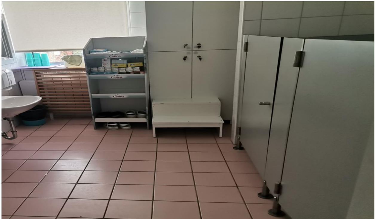
Slika 11. Sanitarije vrtičke odgojne skupine