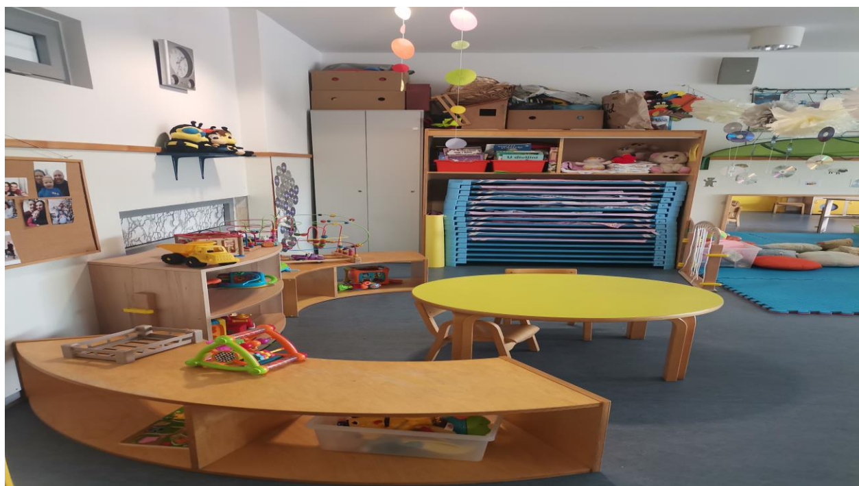
Slika 6. Soba dnevnog boravka mlađe jasličke odgojne skupine

Što se tiče prozora, Metikoš i sur. (1960) preporučili su veće dimenzije od samog poda kako bi djeci bila omogućena preglednost vanjskog prostora koji okružuje ustanovu. Baveći se kriterijima Reggio prostora, Petrović-Sočo (2007) navodi da je važno povezati ustanovu za rani i predškolski odgoj i obrazovanje s lokalnom zajednicom i cjeloukupnim okruženjem. Domljan i sur. (2015) ističu povezanost interijera s eksterijerom kao jedan od elemenata kvalitetnog prostora, što je ovakvim dizajnom prozora postignuto.