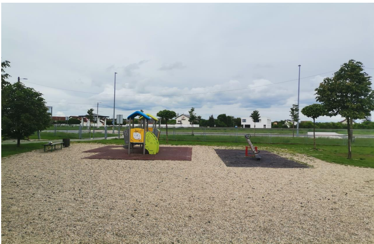
Slika 13. Sprave na dječjem igralištu

Promišljanje o sigurnosti djece vidljivo je postavljanjem antistresnih i gumenih podloga ispod svake sprave (Slika 13). Hansen i sur. (2001) te Vredenburgh i Zackowitz (2008) ne preporučuju tvrde materijale poput betona ili asfalta ispod ili oko opreme već antistresne, mekane podloge u svrhu zaštite djece prilikom pada ili materijale za ispunjavanje poput pijeska, šljunka i gume.