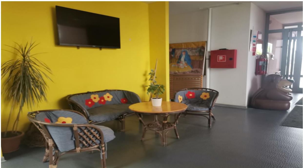
Slika 2. Ulaz u ustanovu za rani i predškolski odgoj i obrazovanje