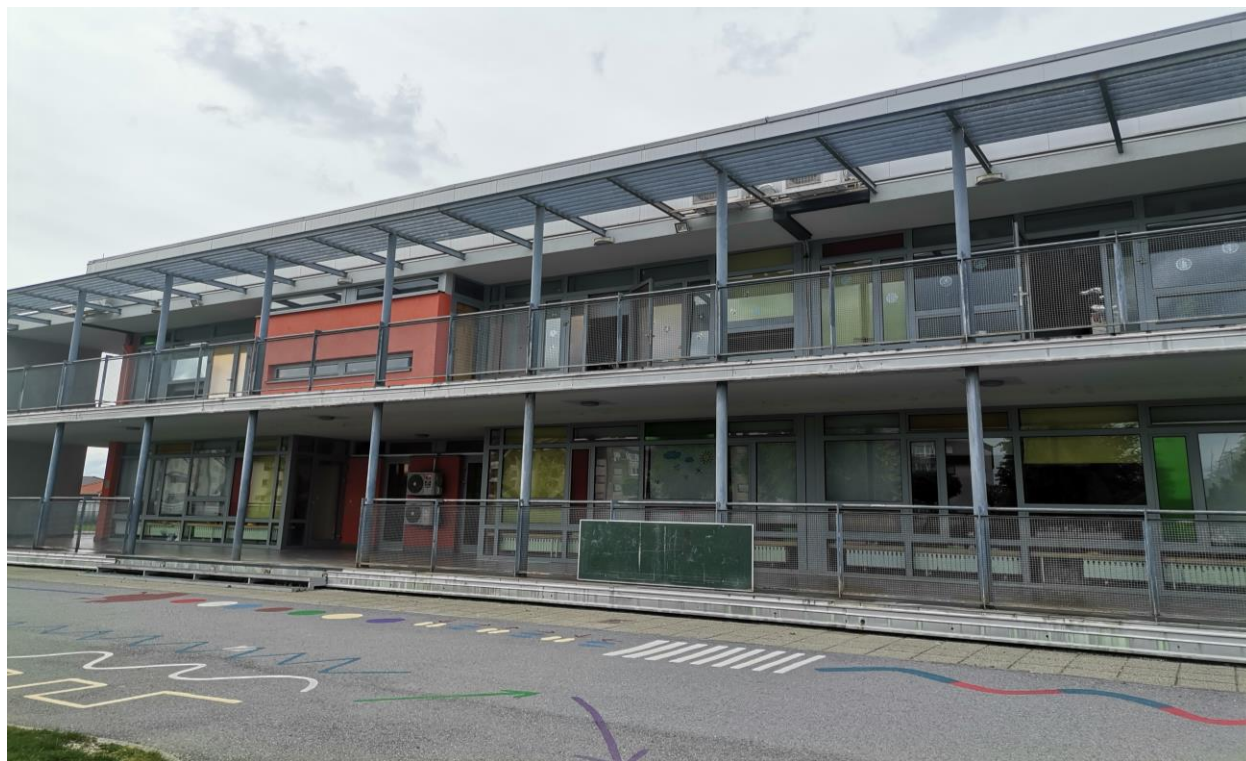
Slika 12. Arhitektura vanjskog dijela ustanove za rani i predškolski odgoj i obrazovanje

Osim arhitektonskog oblikovanja zgrade, potrebno se osvrnuti na dvorište na kojem djeca svakodnevno provode svoje vrijeme. Državni pedagoški standard (2008) propisuje površinu zemljišta za izgradnju zgrade najmanje 30 metara 2 po djetetu obuhvaćajući prilazne putove, igrališta, slobodne površine, gospodarsko dvorište i parkirališta. Korisna površina obuhvaća 24 metra 2 po djetetu od čega je četiri metra 2 površina za opremu i rekvizite te 20 metra 2 slobodna površina (Metikoš i sur., 1960). Ukupna površina vanjskog dijela analizirane ustanove iznosi 3997 metara 2 (Žinić, I., 2017). Po tome bi se moglo zaključiti da je okružje dovoljno prostrano za boravak djece. Oko cjeloukupnog vanjskog prostora dvorišta prostire se željezna ograda s lokotom na vratima koja nisu u doseg djece, čime se izbjegava da djeca nehotice pobjegnu na cestu (Stipanec i Bartolac, 2015) što se ovakvim sigurnosnim mjerama željelo izbjeći (Državni pedagoški standard, 2008).