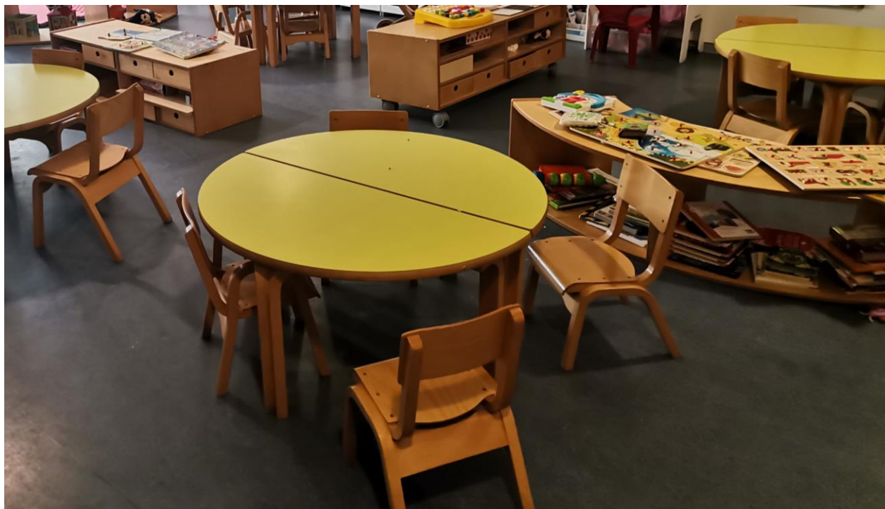
Slika 7. Soba dnevnog boravka srednje jasličke odgojne skupine

Uz sobu dnevnog boravka mlađe jasličke skupine nalazi se soba za djecu srednje jasličke skupine. U prostoru je vidljivo više pokretnih ormarića koji dijele sobu na centre aktivnosti nego što je to za mlađu jasličku dob. Podjela prostora na manje cjeline, odnosno tematske centre, omogućava spontano grupiranje djece u manje skupine (Slunjski, 2008) što omogućava kvalitetniju interakciju (Petrović-Sočo, 2007). Jedan od kriterija dizajniranja prostora primjerenih za djecu, prema Isenberg i Jalong (1997), obuhvaća otvorene police kako bi materijali i poticaji djeci bili stalno dostupni za uporabu što je omogućeno u svakoj sobi dnevnog boravka. Petrović-Sočo (2009) ističe da je tradicionalno uređenje obuhvaćalo visokostrukturirane materijale smještene u visokim ormariima čime su djeci bila nedostupna za uporabu, što je ovakvim namještajem izbjegnuto (Slika 7). Prema Slunjski i sur. (2015) dijete može usmjeravati interese prema vlastitom izboru ukoliko je prostor pedagoški oblikovan. Tome ide u prilog, ne samo stalna dostupnost materijala i poticaja, već i mogućnost spajanja stolova manjih dimenzija jer je od velike važnosti omogućiti namještaj koji će biti prilagodljiv (Stipanec i Bartolac, 2015). Takav dizajn stolova nije vidljiv u sobi dnevnog boravka mlađe jasličke dobi. Kod dizajna stolica također je primijećena razlika. Stolice za srednju jasličku skupinu napravljene su bez naslona za ruke za razliku od onih za mlađu jasličku dob.