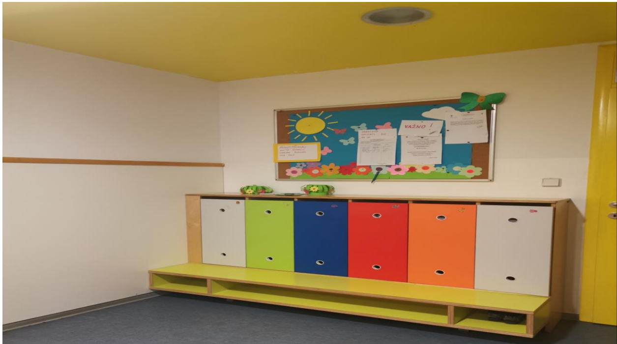
Slika 4. Garderoba jasličke odgojne skupine

Nakon analize garderobe jasličke dobi, stepenicama ili liftom omogućen je dolazak na prvi kat gdje su smještene sobe dnevnog boravka vrtičke dobi. Dok su djeca jasličke dobi u prizemlju, na prvome katu su smještena djeca vrtičke dobi. Takvo arhitektonsko uređenje prati preporuke Metikoš i sur. (1960).