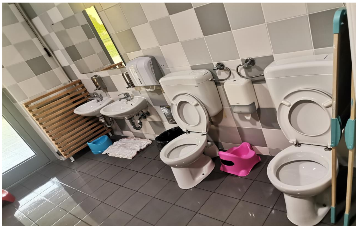
Slika 10. Sanitarije jasličke odgojne skupine

Vrtičke odgojne skupine imaju drugačije ergonomске elemente sanitarnog čvora od jasličkih. Prostorom dominiraju vrata iza kojih se nalaze toaletne školjke kojih je ukupno tri. Ovo idejno rješenje omogućuje privatnost djeci, ali i mogućnost kontrole odgojitelju. Postavljena su tri umivaonika koje se nalaze ispred prozora koji spaja sobu dnevnog boravka i sanitarni čvor (Slika 11). Na prozorima se nalaze rolo zavjese zbog mogućnosti reguliranja sunčeve svjetlosti, a drugi razlog je vezan za privatnost djece. U njihovim sanitarnim prostorima nije projektiran izlaz na terasu, već se vrata nalaze u sobama dnevnog boravka.