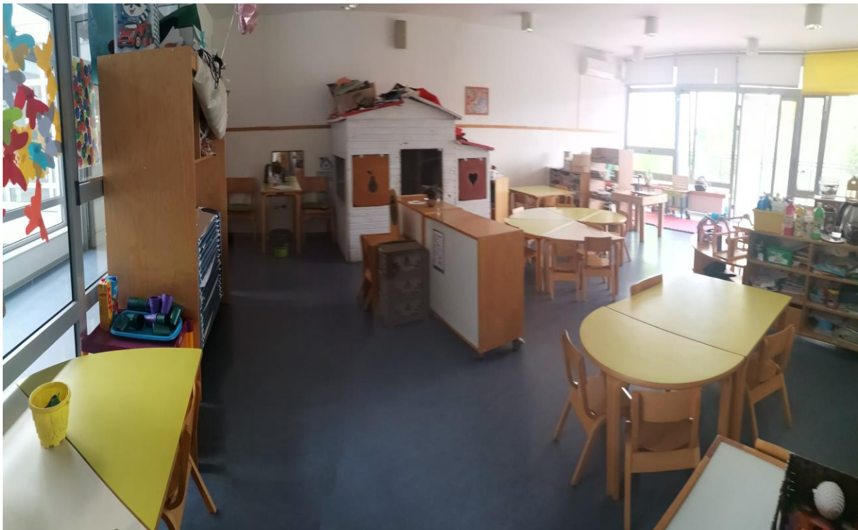
Slika 9. Soba dnevnog boravka srednje vrtićke odgojne skupine

Za postizanje odgojno-obrazovnih vrijednosti, osim stolova i stolica, omogućena je bijela kućica postavljena uz zid budući da Miljak (2009) naglašava važnost prostora za osamu čemu služi ovakav namještaj. Iako su u vrtićkim odgojnim skupinama omogućene ležaljke za odmor, vidljivo je da je manji broj djece kojima je potreban popodnevni odmor nego što je to u jasličnim odgojnim skupinama. Zid nasuprot spremljenim ležaljka podiže kvalitetu boravka u sobi budući da je sačinjen od stakla koje, ne samo da omogućuje ulazak svjetlosti i prozračivanje, već zahvaljujući ugrađenim vratima omogućen je izlaz na terasu kako bi se određene aktivnosti mogle tamo provoditi.