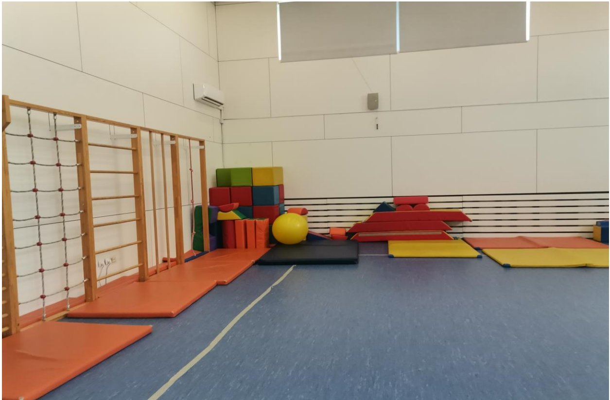
Slika 3. Dvorana

Na zidovima su također smješteni prozori što odgovara propisanim preporukama autora Metikoš i sur. (1960), odnosno bliže su stropu dvorane kako bi izvor svjetlosti bio ujednačen. Rolo zavjesama regulira se ulazak sunčeve svjetlosti (Državni pedagoški standard, 2008). Osim prirodnog osvjetljenja, na stropovima je projektirana umjetna rasvjeta kako bi došlo do kombinacije izvora svjetlosti, što preporučuju autori Metikoš i sur. (1960).