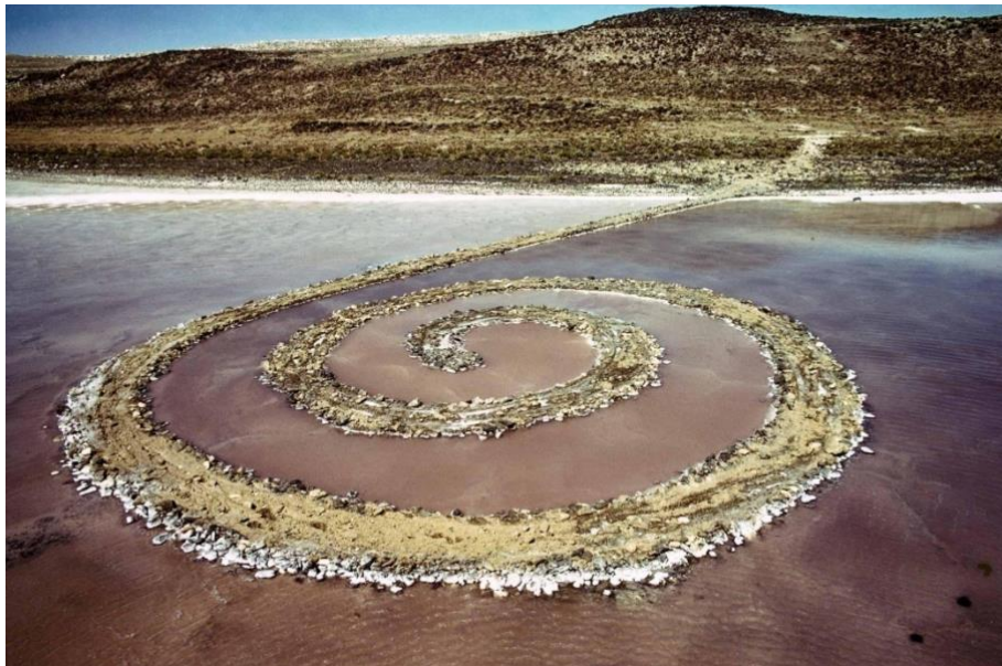
Slika 1. Robert Smithson, Spiralni Jetty (1969. - 1970.)