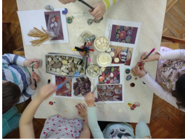
Slika 20. Crtanje po kamenju

mandale) što ih je posebno motiviralo i usmjerilo u aktivnosti. Koristili su različite boje, linije, oblike ( Slike 21. i 22. ). Jedna djevojčica, iznimnog interesa, oslikala je niz drvenih oblutaka i kamenja koristeći cijeli spektar boja ( Slika 22. ).