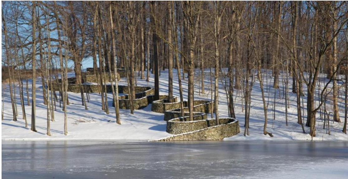
Slika 5. Andy Goldsworthy, Storm King Wall (1997. - 1998.)

Jedno od poznatih Goldsworthyjevih djela velikih dimenzija upravo je zakrivljeni zid Storm King Wall (1997. - 1998.) izgrađen u šumi (u New Yorku, SAD) dajući poseban dojam „šuljanja“ i „vijuganja“ između drveća ( Slika 5. ).