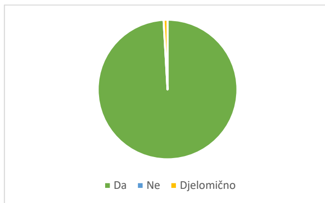
Grafikon 2. Upoznat/a sam s pojmom rodna ravnopravnost .