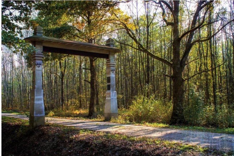
Slika 13. Vrata od krča