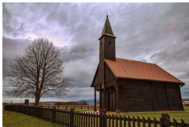
Slika 19. Kapela Ranjenog Isusa