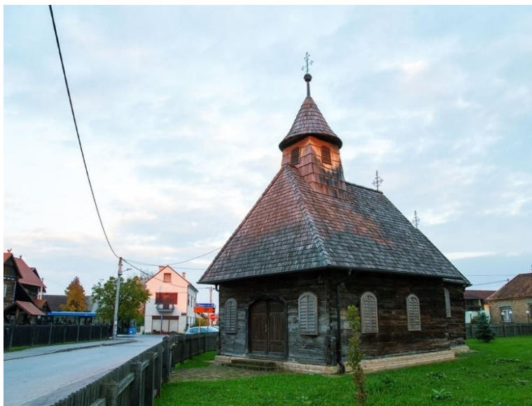
Slika 17. Kapela svetog Apostola / svetog Ivana Krstitelja

Kapela svetog Apostola nalazi se u Buševcu (Slika 17). Građena je pod utjecajem zidane arhitekture i baroka te unosi razvoj i postaje uzor u sakralnoj gradnji Turopolja. Glavni kip koji se nalazi u kapeli je kip svetog Ivana Krstitelja te je zbog toga prozvana i kapelom svetog Ivana Krstitelja (Maroević, 1997). Prema pisanim izvorima datira iz 1668. godine, ali prema zvonima i kaležu koji se u njoj nalaze vjeruje se da je postojala i prije (Matković Mikulčić, 2010). Sama kapela je opremljena i izgrađena uz financijsku pomoć plemićkih obitelji čija su imena vidljiva na računima i slikama u kapeli. Plemićke obitelji koje su održavale kapelu bile su Černko, Detelić, Lacković, Kovačević, Katulić i Robić.