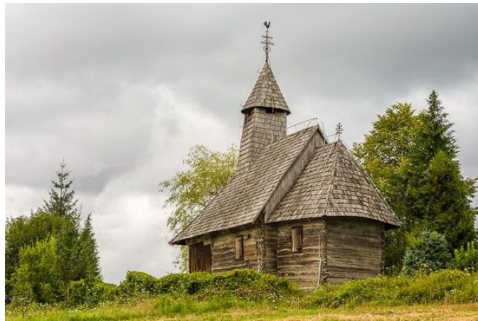
Slika 18. Kapela svetog Jurja

O kapeli svetog Jurja u Lijevim Štefanima brinulo se selo (Cvitanović, 2008). Kapela je podignuta 1677. godine te je jedan od najizvornijih primjera tlocrtno razvijene kapelice (Slika 18). Izgrađena je na mjestu gdje se ranije nalazila kapela, ali je 1704. godine premještena na pogodnije mjesto (Maroević, 1997). Kapela je teško oštećena tijekom Domovinskog rata, ali je obnovljena i danas krasi Lijeve Štefanke (Matković Mikulčić, 2010).