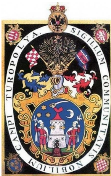
Slika 2. Grb Plemenite općine Turopolje