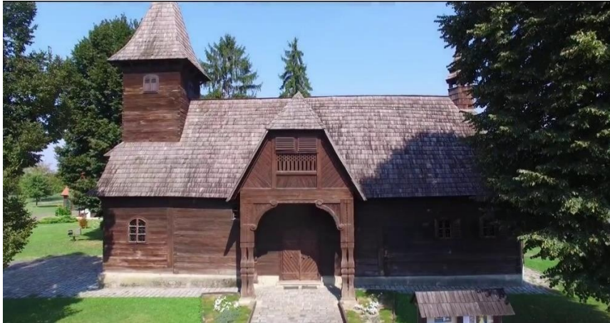
Slika 16. Kapela svete Barbare