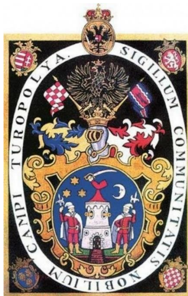
Slika 2. Grb Plemenite općine Turopolje