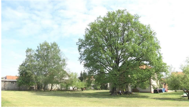
Slika 3. Hrast lužnjak