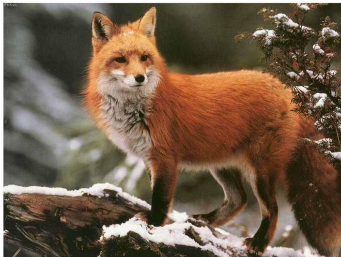
Slika 10. Lisica

Od sisavaca mogu se nabrojati razne vrste rovki (npr. poljska, šumska), šišmiša (npr. rani večernjak, patuljasti, šumski i riječni šišmiš), dabar ( Castor fiber ), vidra ( Lutra lutra ), lasica ( Mustela nivalis ), jazavac ( Meles meles ), srna ( Capreolus capreolus ), jelen ( Cervus elaphus ), divlja svinja ( Sus scrofa ), europski zec ( Lepus europaeus ) te lisica ( Vulpes vulpes ) (Slika 10).