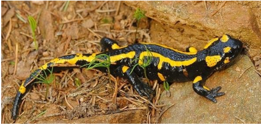
Slika 7. Pjegavi daždevnjak

Od vodozemaca može se nabrojati pjegavi daždevnjak ( Salamandra salamandra ) (Slika 7), mali vodenjak ( Lissotriton vulgaris ), smeđa krastača ( Bufo bufo ), livadna smeđa žaba ( Rana arvalis ), itd.