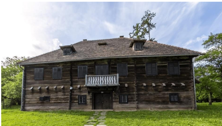
Slika 15. Kurija Modić-Bedeković

Bogatiji ljudi i plemenitaši na području Turopolja živjeli su u kurijama ili dvorovima te su one bile vrhunac graditeljstva u 19. stoljeću. Oko njih nalazili su se parkovi i ostatak gospodarskog imanja. U Turopolju je sagrađeno mnogo kurija, ali većina njih danas ne postoji. One koje su opstale su župni dvor Staroga Čiča, dvor obitelji Zlatarić, dvor obitelji Pintarić koji su se nalazili u Bukevju te najpoznatije kurije Alapić i Modić-Bedeković. Kurija Alapić nalazi se u Vukovini te je danas u vrlo lošem stanju. Pripadala je obitelji Alapić čiji je pripadnik bio Gašpar Alapić, poznat kao sudionik Seljačke bune. Kurija Modić-Bedeković je izgrađena 1806. godine u Donjoj Lomnici (Slika 15). Ona je danas očuvana zbog restauratora Muzeja Turopolje. Oko nje nalazi se park. U prizemlju su gospodarske prostorije, a ostatak se nalazi na katu. U njoj se može naći stilski namještaj, peć za grijanje, umjetnička djela, porculan, klavir i slično.