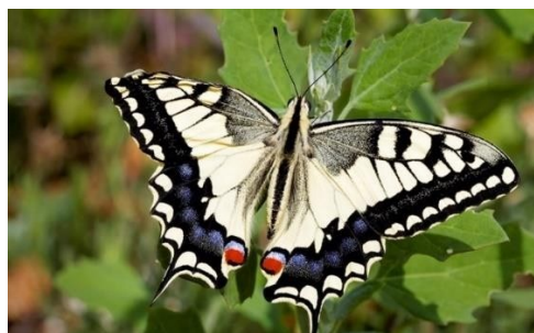
Slika 6. Lastin rep

Neki od zaštićenih leptira su lastin rep ( Papilio machaon ) (Slika 6), prugasto jedarce ( Iphiclides podalirius ) i velika modra preljevica ( Apatura iris ).