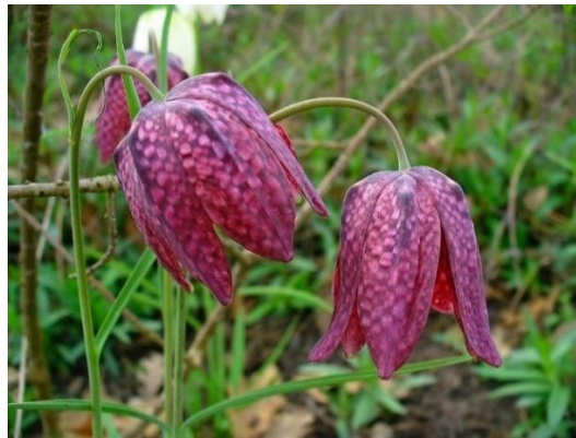
Slika 5. Kockavica

Turopoljske šume nastanjivale su i turopoljske svinje koje su stočari u njima slobodno uzgajali. One su se hranile žirom koji su se nalazili u šumi, ali i svim drugim što su uspjeli pronaći na šumskom tlu. Tu pasminu svinja i danas mnogi ljudi uzgajaju u turopoljskom kraju, kao i konje hrvatske posavce koji su se u prošlosti koristili za rad u polju te su karakteristični za ovo područje (Matković Mikulčić, 2010). Turopolje obiluje biljkama i životinjama, te prema podacima iz 2015. godine u Hrvatskoj je ugroženo 226 biljnih vrsta, a najveći broj vrsta živi u poplavnim i močvarnim područjima kao što je Turopolje. U knjizi Magna silva objavljen je popis zaštićenih i ugroženih vrsta biljaka i životinja, a koje se mogu naći u Turopolju te će u nastavku od svake skupine biti nabrojano nekoliko vrsta. Biljke koje su zaštićene, a nalaze se na području Turopolja su kockavica ( Fritillaria meleagris ) (Slika 5) i vratizelja ( Anacamptis pyramidalis ).