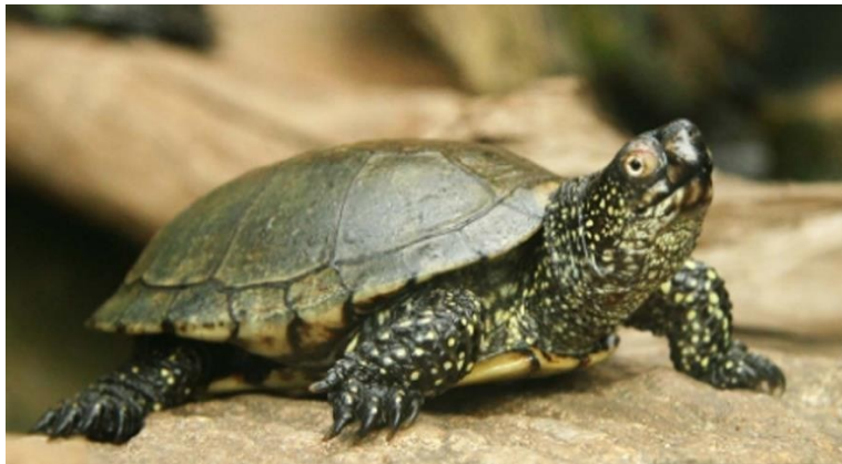
Slika 8. Barska kornjača

Zaštićeni gmazovi su barska kornjača ( Emys orbicularis ) (Slika 8), livadna gušterica ( Lacerta agilis ), sljepić ( Anguis fragilis ), bjelouška ( Natrix natrix ).