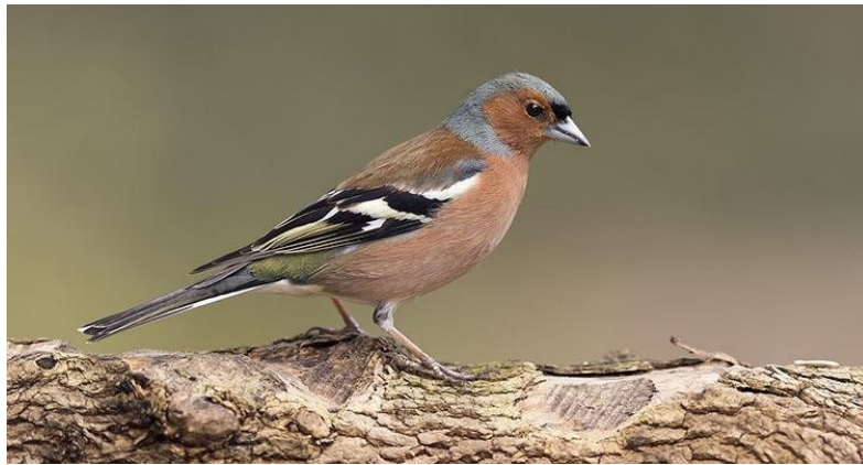
Slika 9. Zeba

( Turdus merula ), zeba ( Fringilla coelebs ) (Slika 9) te se navodi kako konačan broj ptica koje su zaštićene broji 123 vrste.