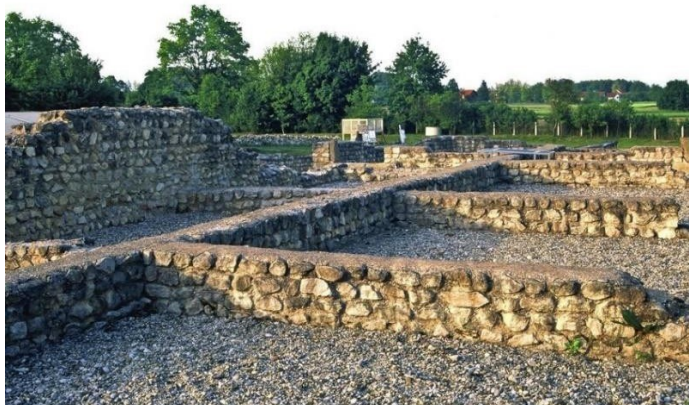
Slika 12. Andautonia

Prvi arheološki park u Hrvatskoj upravo je Andautonia koja se nalazi u današnjem selu Šćitarjevu. Andautonia je nekadašnji rimski grad (Slika 12) koji je od 1. do 4. stoljeća služio kao luka i važna prometnica. Grad je otkriven te je iskapanje započelo 1969. godine. Danas se u njemu mogu vidjeti ostatci rimske ulice, dvije zgrade i gradsko kupalište. U nalazištu je pronađeno mnogo predmeta koji se danas nalaze u muzeju Turopolje i Arheološkom muzeju u gradu Zagrebu (Turistička zajednica grada Velike Gorice, 2015).