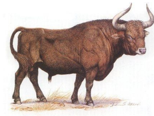
Slika 4. Pragovedo tur

Turopolje je dobilo naziv po izumrlom pragovedu tur koje je obitavalo na području Turopoljskog luga, ali i šire. Tur je bio jedno od najvećih goveda koja su ikada nastanjivala područje Europe, a porijeklom je iz Azije. Mužjak tura bio je visok do dva metra, a dug od 3 do 3,2 metra (Slika 4). Pragovedo tur težilo je od 800 kilograma do jedne tone. Mužjaci su imali dlaku crne boje, a ženke crvenosmeđe boje te su živjeli u krdima. Nastanjivao je područja gustih šuma koje su se nalazile u nizinama te je obitavao i u Turopoljskom lugu. Pragovedo tur bilo je biljojed te se hranilo travom, raslinjem, lišćem, ali i žirom koji je plod hrasta lužnjaka, karakterističnog za Turopolje. Zimi se hranio granama grmlja, korom drveća, ali imao je sposobnost izvlačenja vodenog i močvarnog bilja koje se nalazilo ispod vode. Zbog klimatskih promjena, krčenja gustih šuma, izlova i bolesti pragovedo tur je izumrlo. Posljednji tur u Europi, to jest ženka tura, uginula je 1627. godine od starosti (Božić i Sakoman Božić, 2016).