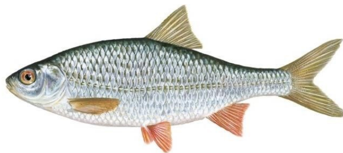
Slika 11. Crvenokica

Rijeke Turopolja: Kupa, Sava i Odra staništa su različitih vrsta riba. Prema Čaleta i sur. (2019) u rijeci Savi je zabilježeno ukupno više od 60 vrsta riba od čega barem polovina vrsta obitava i na području nizvodno o Zagreba. Isti autori za Kupu spominju gotovo 60 zabilježenih vrsta u čitavom toku, a vjerojatno više od 30 između Karlovca i Siska. O ihtiofauni rijeke Odre nema puno podataka, ali je Leiner (1998) u rijeci Odri, odnosno dolini Turopolja zabilježio čak 22 vrste. U rijeci Odri od autohtonih vrsta mogu se nabrojati crvenokica ( Rutilus rutilus ) (Slika 11), plotica ( Rutilus virgo ) i uklija ( Alburnus alburnus ) te osim njih tamo obitavaju i štika ( Esox lucius ), klen ( Squalius cephalus ), grgeč ( Perca fluviatilis ), smuđ ( Sander lucioperca ), som ( Silurus glanis ) i ostale.