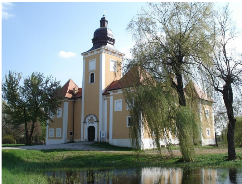
Slika 14. Lukavec grad

Lukavec grad dokaz je turopoljskog plemićkog statusa. Čine ga toranj, bočne kule za obranu i puškarnice, a oko utvrde nalaze se vodeni kanali (Slika 14). Utvrda je renesansnog izgleda te je jedini povijesni zidani objekt. Prvobitno je izgrađena od hrastova drveta, između 1474. i 1479. godine te je služila za obranu od Osmanlija. Kasnije je srušena i ozidana, ali prema arheološkim istraživanjima utvrđeno je da je prije toga bila drvena. Do 1848. godine služila je kao objekt za obranu, arhiv te sjedište tadašnje općine turopoljske (Matković Mikulčić, 2010).