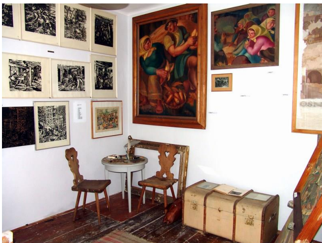
Slika 3. Razgledavanje pokućstva, razgovor o životnom prostoru i analiziranje slikarevih djela