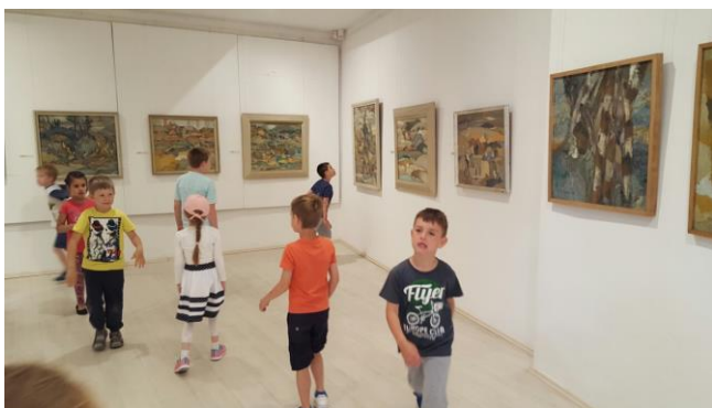
Slika 5. Razgledavanje galerije slika