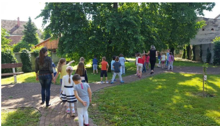
Slika 7. Djeca taktilno percipiraju i proučavaju trešnju