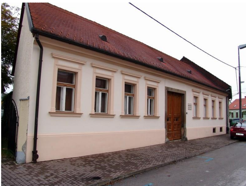
Slika 1. Ulaz u rodnu kuću slikara Ladislava Kralja Međimurca

Ispričala sam djeci da je slikar Ladislav Kralj Međimurec je poznati hrvatski slikar koji se rodio u gradu Čakovcu. Ladislav bi bio jako sretan kada bi znao da će oni danas biti u njegovoj rodnoj kući i vidjeti gdje je on živio i što je naslikao. Zato je njihov zadatak da naslikaju pastelama ono što će im se najviše svidjeti. To može biti likovno djelo, a može biti i dio kuće ili dvorišta koji ćemo vidjeti. Neka slikaju tako da njihova djela budu još ljepša od svega što su vidjeli pa da mogu pokazati svima u vrtiću kao i roditeljima gdje su bili i što su radili.