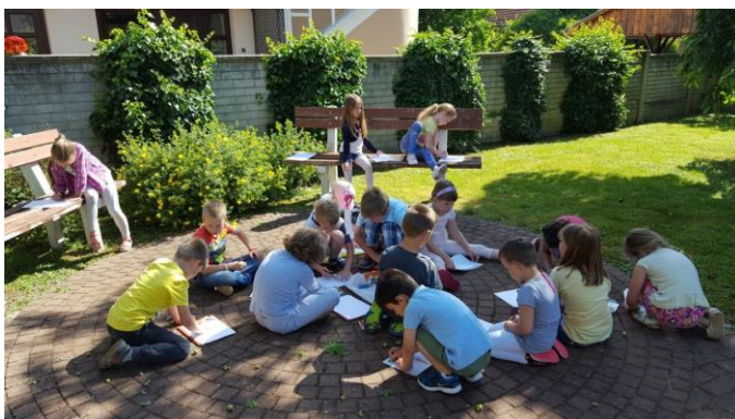
Slika 9. Neka djeca su slikala na podu a neka djeca na klupama