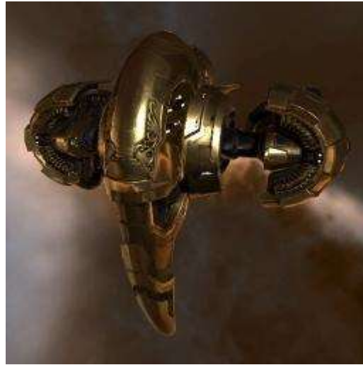
Slika 6. Gold Magnate. https://wiki.eveuniversity.org/Gold_Magnate

Monetizacija tehnologije virtualne stvarnosti ide toliko daleko da se ne prodaju samo uređaji i pripadajuće aplikacije, već se prodaju i sami sadržaji unutar aplikacija. Portal Vidi.hr donosi informaciju kako je poznati YouTuber Scott Manley postao vlasnikom vjerojatno najskupljeg virtualnog svemirskog broda u povijesti, kupivši u igri EVE Online svemirski brod Gold Magnate za čak 30 000 dolara ili 202 588 kn.