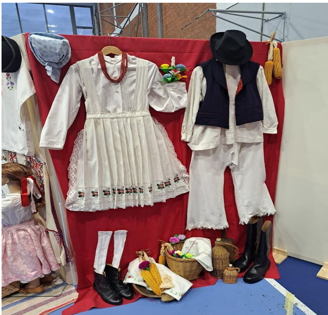
Slika 5. Prikaz ženske i muške zagorske narodne nošnje

KUD „Matija Gubec“ posjeduje svoje nošnje no nije ni to bio laki proces. Pri osnivanju društva došlo je do problema što s nošnjama. Žene su odlazile u sela i tražile nekoga tko zna sašiti nošnje. U selu Brezju našle su staru gospođu koju su zvali Bučanica, donijele su joj platno od kojega će sašiti nošnje. Velika je odgovornost oko nošnji i to pogotovo njihovo održavanje. Uvijek se vodi briga na urednost, čistoću i na način oblačenja kako su ih i prije oblačile naše prabake.