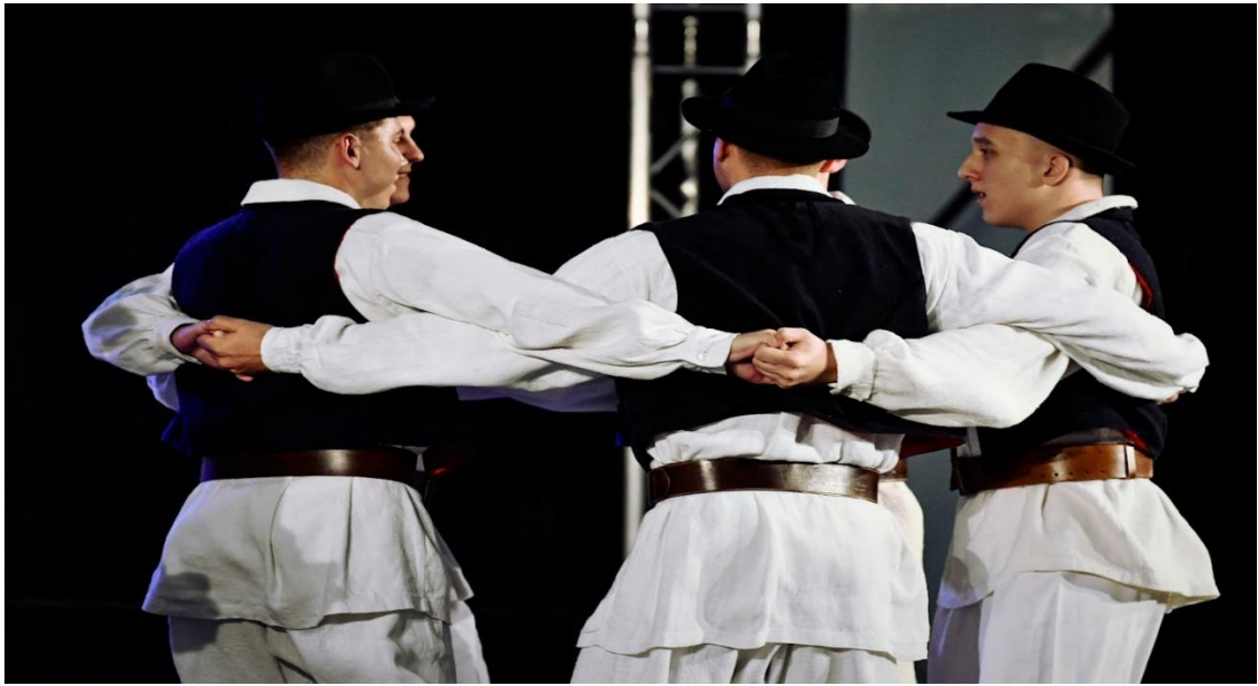
Slika 6. Prikaz držanja