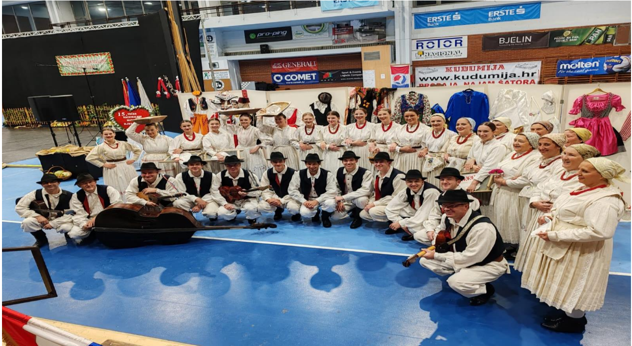
Slika 4. Starija mješovita skupina i tamburaški sastav na 15. večeri nacionalnih manjina u Bjelovaru

Folklorna sekcija djeluje u četiri grupe prema uzrastima, od 6 do 100 godina i tamburaški sastav.