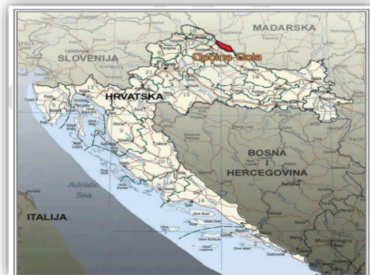
Slika 1. Geografski položaj mjesta Gole

Ime mjesta dolazi iz mađarskog jezika i znači roda, što je prikladno s obzirom na veliki broj roda koje se gnijezde u tom području. Općina je dio Koprivničko-križevačke županije. Prema popisu stanovništva iz 2001. godine, općina Gola imala je 2.760 stanovnika, raspoređenih u pet naselja: Gola (995), Gotalovo (404), Novačka (396), Otočka (247) i Ždala (718) (Program ukupnog razvoja Općine Gola za razdoblje 2017-2020., 2018;22). Stanovnici se uglavnom bave poljoprivredom, pri čemu je ratarstvo i stočarstvo dominantno, dok se manji broj bavi uzgojem povrća. Najznačajniji prirodni resurs općine Gola je poljoprivreda, koja je temelj ekonomije ovog područja.