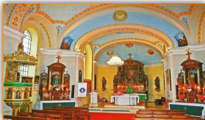
Slika 2. Unutrašnjost župe Gola

Ovi povijesni događaji ilustriraju proces formiranja i razvoja župnih struktura te duhovnog života u Goli i Ždali tijekom 19. stoljeća. Gradnja zidane župne crkve započela je 1839. godine, a 10. svibnja 1840. postavljen je blagoslovljen kamen temeljac (Večenaj, 1994). U 1842. godini izgrađen je toranj crkve, te je crkva ožbukana iznutra i izvana, dok su obnovljene orgulje prenesene iz stare kapele.