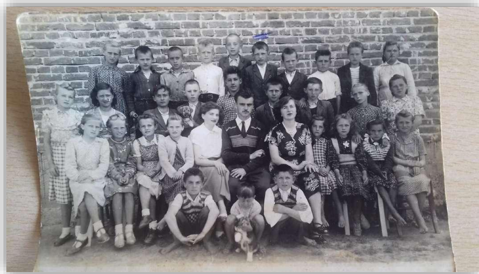
Slika 3. Fotografija generacije iz 1945. godine škola Gola