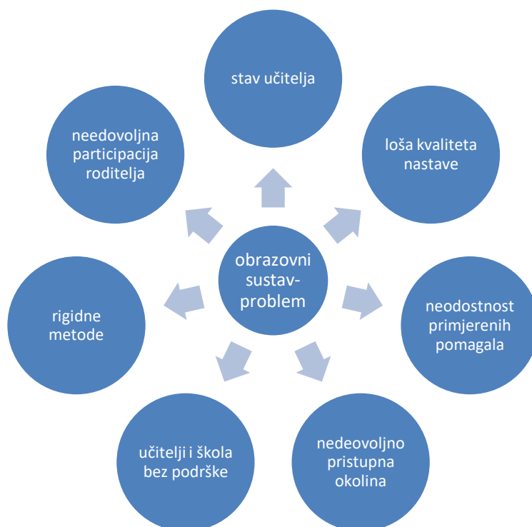
Slika 1: Inkluzivno obrazovanje (Cerić, 2004)