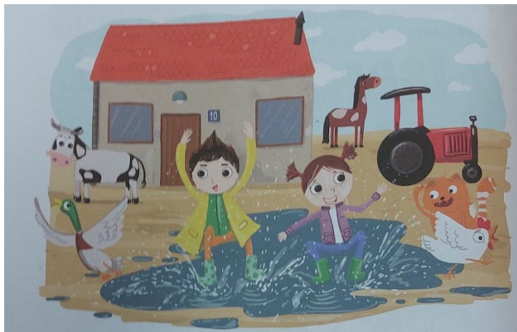
Slika 9. Ilustracija koju učenici promatraju (Težak, Gabelica, Marjanović, Škribulja Horvat, 2021: 10)

- učenici promatraju ilustraciju u udžbeniku i imenuju sve što vide na njoj: