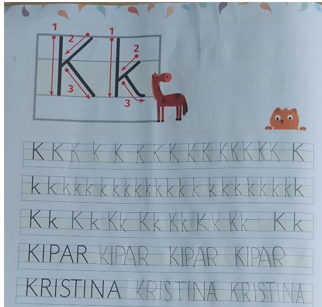
Slika 12. Učenikovo pisanje slova K, k u pisančici A (Težak i sur., 2021: 11)

- učenici u pisančici A pišu slova K, k i riječi kipar i Kristina