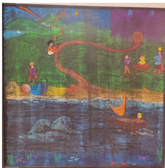
Slika 1. Slika na ploči prema priči

- ponavljanje sadržaja od prethodnog dana: