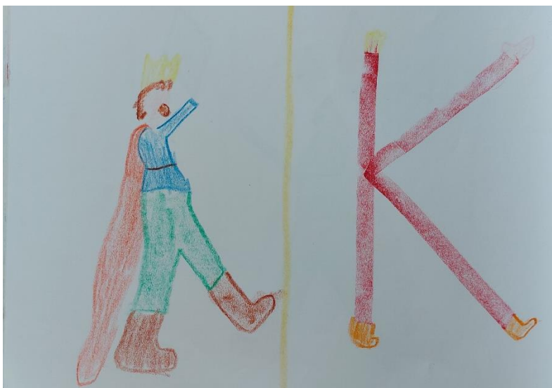
Slika 5. Učenikov crtež kralja Krunoslava i pisanje slova K

- spremanje stvari u torbu, učiteljica započinje uz pjesmu i pridružuju joj se učenici: