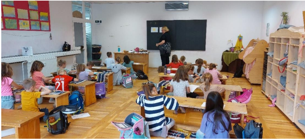
Slika 13. Opremljenost učionice učenika prvoga razreda Osnovne waldorfske škole u Zagrebu (Osobna arhiva, 2024, Osnovna waldorfska škola u Zagrebu)

Likovnu kulturu), vješalica za učeničke haljinice za nastavni sat Euritmije, slike i biljke ( Slika 13 ).