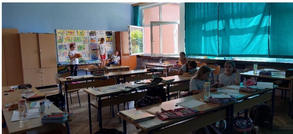
Slika 14. Opremljenost učionice prvoga razreda Osnovne škole Dragutina Tadijanovića u Petrinji