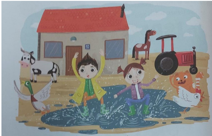
Slika 9. Ilustracija koju učenici promatraju (Težak, Gabelica, Marjanović, Škribulja Horvat, 2021: 10)

- učenici promatraju ilustraciju u udžbeniku i imenuju sve što vide na njoj: