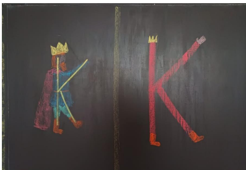
Slika 4. Od kralja Krunoslava do pisanja slova K (Osobna arhiva, 2024, Osnovna waldorfska škola u Zagrebu)

Učiteljica crta na ploču kralja Krunoslava i na njemu prikazuje pisanje slova K, a zatim ga i piše.