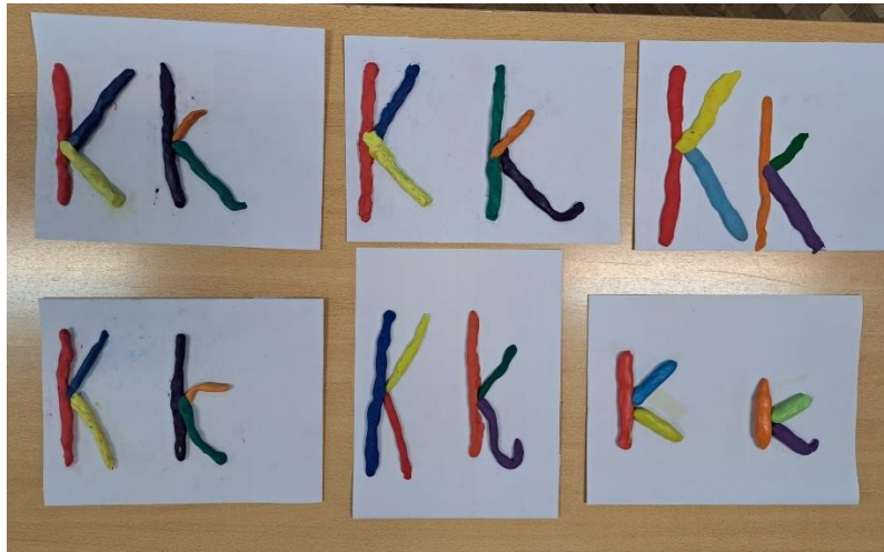
Slika 10. Učenički radovi oblikovanih slova K, k plastelinom

- učenici pišu slova K, k u udžbeniku i čitaju zadani tekst