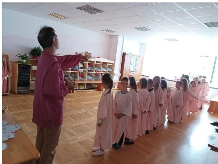
Slika 6. Prikaz ravne crte i početak uživljavanja u svijet upjevane bajke (Osobna arhiva, 2024, Osnovna waldorfska škola u Zagrebu)