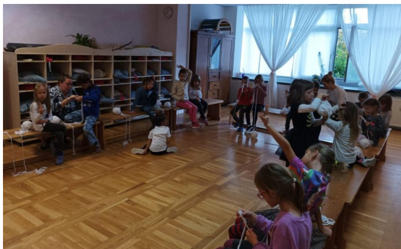
Slika 8. Pletenje (Osobna arhiva, 2024, Osnovna waldorfska škola u Zagrebu)