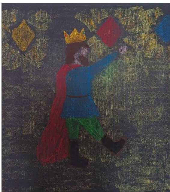
Slika 2. Učiteljčin crtež na ploči kralja Krunoslava

Učiteljica i učenici crtaju kralja Krunoslava.