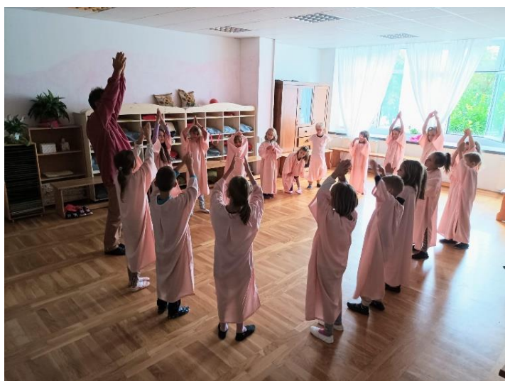
Slika 7. Učenje oponašanjem u krugu kao osnovnom, uživljenost u svijet upjevane bajke hodanjem, stapanjem, skakutanjem i koračanjem poput diva