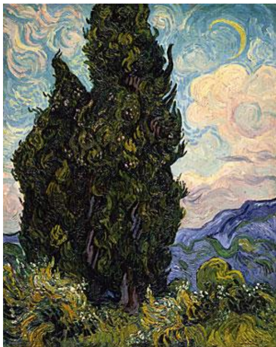
Slika 2 "Dva čempresa"

„Žitno polje s gavranima“ (slika 3) iz 1890. godine također je u tehnici ulja na platnu, dimenzija 50,5 cm x 103 cm. Prijeteće nebo, gavrani i puteljci bez kraja izražavaju tugu i samoću, ali i prikazuju Van Goghovo viđenje snažne prirode. Koristio je snažne kontraste plavog neba i žutog polja, te crvenkaste puteljke naglašene zelenom travom. (www.vangoghmuseum.nl preuzeto 26.7.2017.)