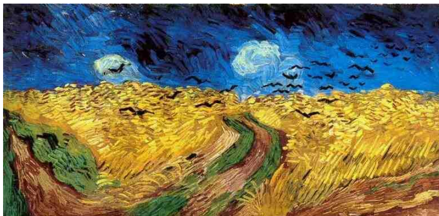
Slika 3 "Žitno polje s gavranima"

Kod promatranja ovog djela najjače prevladavaju osjećaji neugode, nemira i napetosti. Tmurno plavo nebo nad jarkim žutim žitom koje se kreće u različitim smjerovima podsjeća na kaos prilikom dolaska olujnog nevremena.