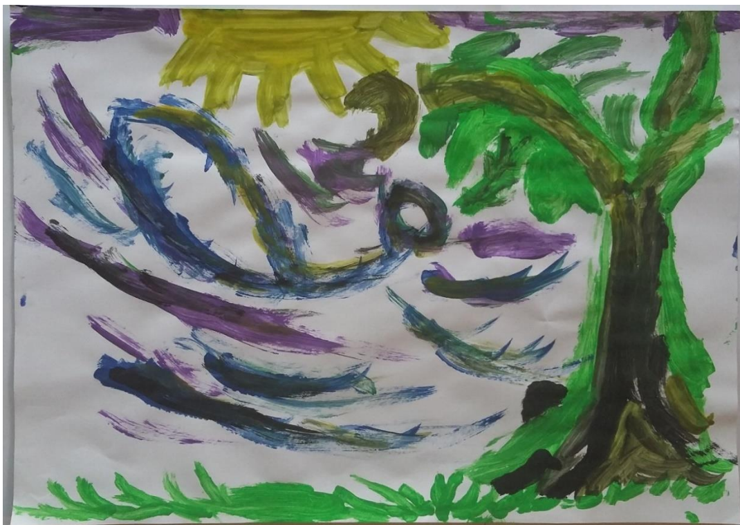
Slika 15 Roko (6) „Vjetar puše i grane se zibaju“

Dora (6) je najviše bila zainteresirana za djelo „Žitno polje s gavranima“. Naslikala je put u sredini rada i oko njega travu te žito. Zanimljivo je da dijete žitu daje više prostora na papiru, a time i veći značaj. Međutim, istovremeno je vidljiv i snažan dojam koji na dijete ostavljaju gavranovi. Iznad žita vidljivo je tmurno nebo baš ako i na umjetnikovom djelu. Na nebu dominiraju gavrani koji su predimenzionirani i naslikani shematskim prikazom, izlomljenom linijom. (slika 16)