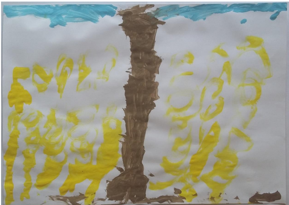
Slika 12 Dino (5) „Ovo je pšenica i put kroz pšenicu“

Dino (5) je laganim kružnim pokretima prikazao žito u pokretu također prema djelu „Žitno polje s gavranima“. Žito je žute boje kao i na djelu, a iz linija možemo vidjeti da se igrao tijekom slikanja koristeći kružne pokrete u ritmu koji predstavljaju kretanje na vjetru. Kao kontrast svijetlim bojama, u sredini rada nalazi se široki put kroz pšenicu u tamnoj boji kojeg je primijetio na djelu. (slika 12)