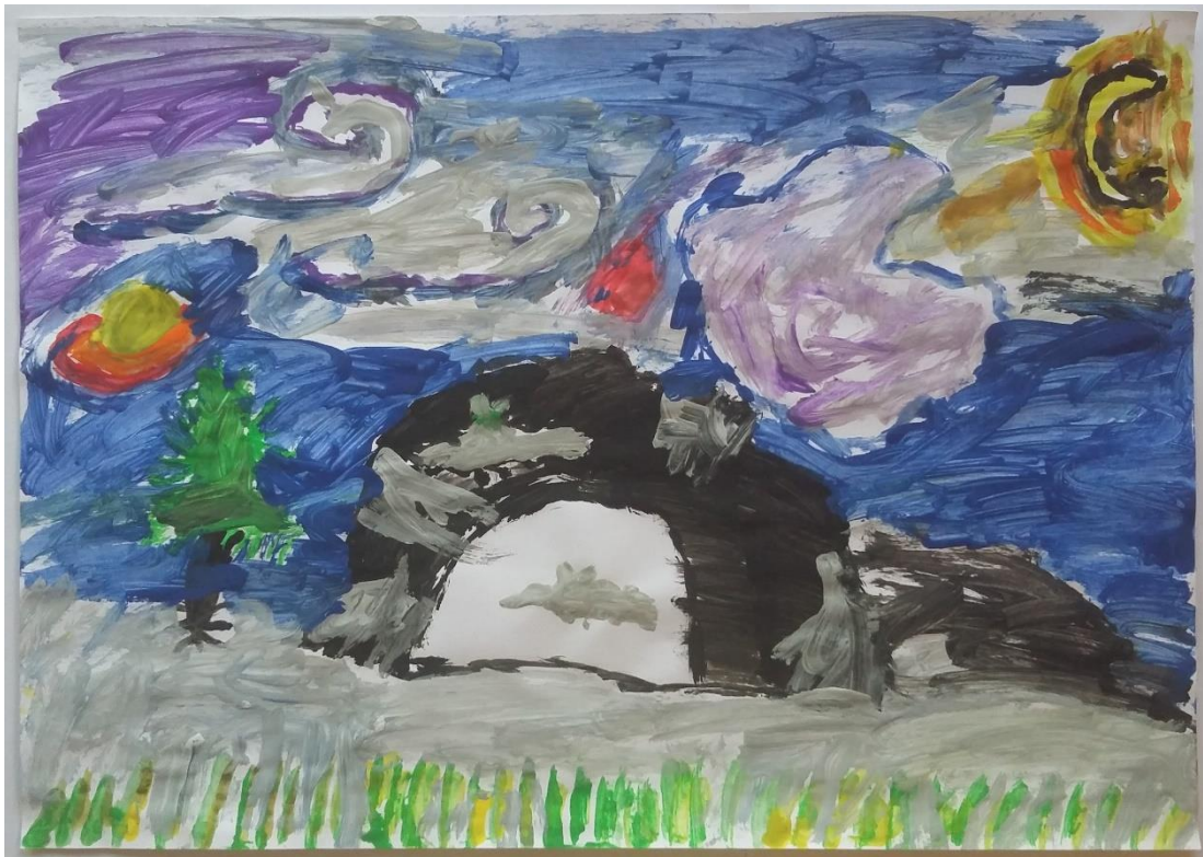
Slika 14 Dante (6) „Šišmiši su v špilji jer vani puše jako vjetar“

nebu. Vidljiva je tehnika slikanja kratkim potezima. Dante je od samog početka aktivnosti iskazivao najviše zanimanja i najdulje je proveo u procesu slikanja. Pažljivo je promatrao odabrana djela što je vidljivo u preuzetim detaljima. Iako se pojavljuje mnoštvo detalja kao i na djelima „Zvezdana noć“ te „Žitno polje s gavranima“, stvorio je pejzaž iz mašte u koji je uklopio motive. Svoje je slikanje pratio i pričom o šišmišima koji traže zaklon od jakog vjetra. (slika 14)