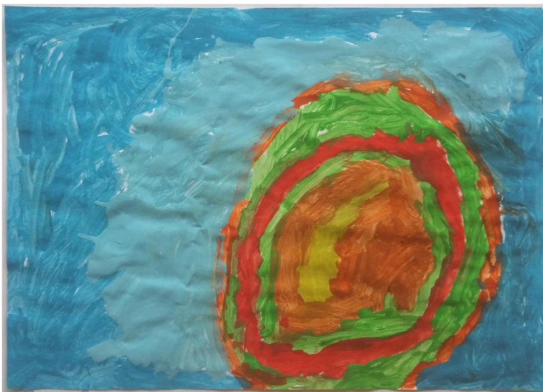
Slika 6 Teo (4) „Na nebu je nevrijeme i vjetar ide v krug“

Teu (4) je najviše zanimanja pobudilo također nebo. U svojem je radu prikazao samo nebo i kretanje vjetra, ne i ostali pejzaž. Nebo je naslikano u plavoj boji na kojoj se ističe kružni oblik koji prema njegovim riječima predstavlja kretanje vjetra.