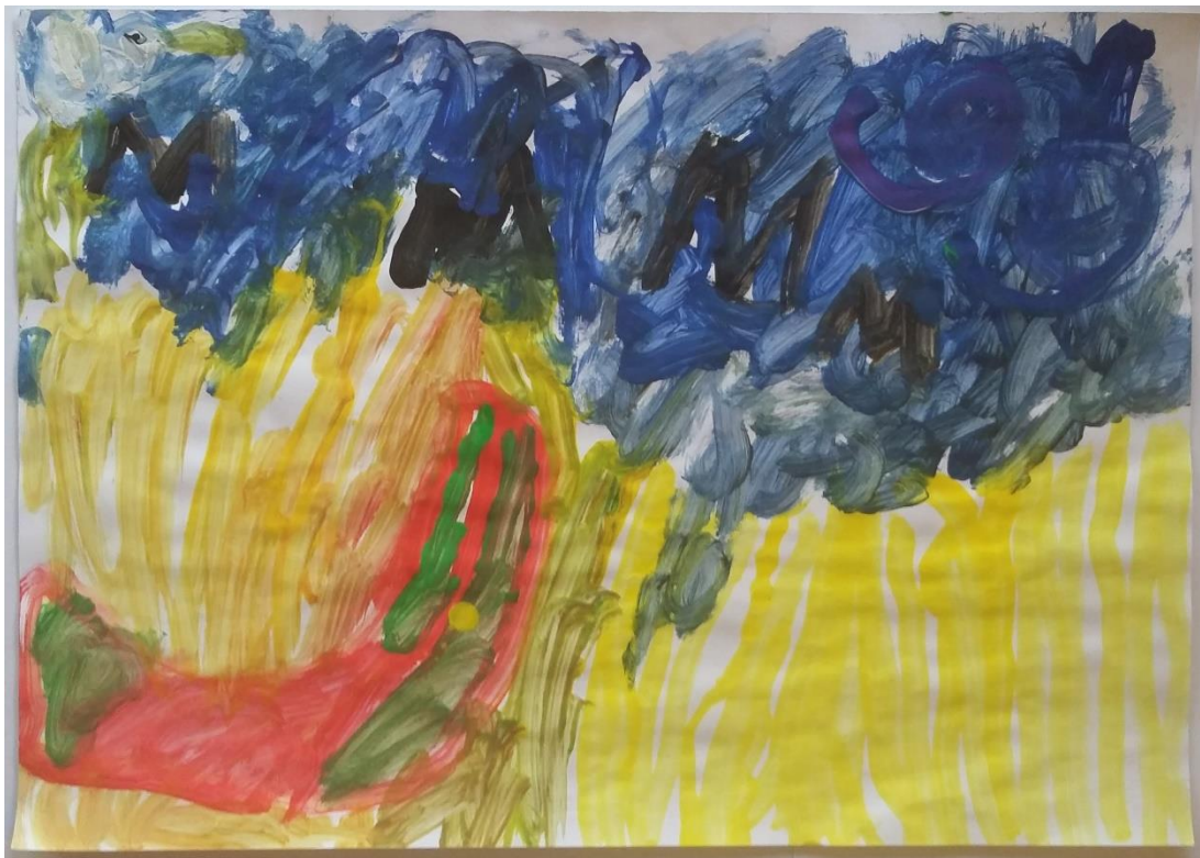
Slika 17 Vita (6) „Cipela se skriva u žitu“

Vita (6) je također reproducirala Van Goghovo djelo „Žitno polje s gavranima“ te je rad nadopunila svojim motivom cipele koja se skriva u žitu. Naslikala je tmurno nebo kružnim pokretima pa se stvara dojam jakog kretanja. Žito je prikazano duljim potezima kista u kojem se ističe velika crvena cipela. Na nebu se javlja nekoliko gavrana naslikanih izlomljenom linijom. (slika 17)