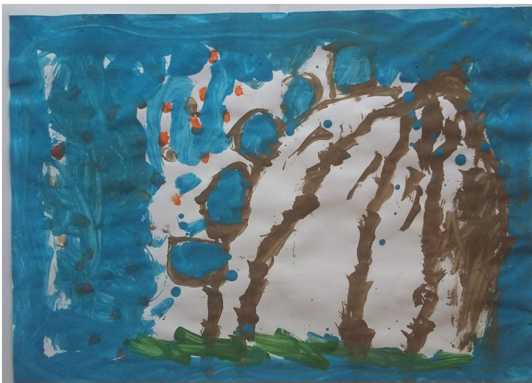
Slika 13 Jakov (5) „Vjetar je na planini i pretvara se v tornado“

Jakov (5) je naslikao pejzaž prema zamišljanju. Odabrao je planinu na kojoj puše vjetar. Planina je naslikana linijama smeđe boje i ovdje možemo vidjeti crtanje bojom koje se javlja u shematskoj fazi dječjeg stvaralaštva. Na planini je plavom bojom naslikan vjetar koji postupno prelazi u tornado. Taj prijelaz i kretanje su vidljivi u pokretima kista. S jačanjem vjetra raste učestalost pokreta kista kako bi se stvorila napetost. Motiv vjetra koji je vidljiv kod Van Goghovih djela te asocijacija na nevrijeme na temelju neba na „Zvjezdanom nebu“ potaknuli su ga na maštanje. Jakov se istaknuo tijekom aktivnosti jer se jako udubio u slikanje i najviše se oslobodio. Slikanje vjetra popratio je zvukovima što nam govori da je cijeli proces shvatio kao igru. Isto tako je zatražio „vjetrovitu boju“ kako bi naslikao taj isti vjetar što dodatno govori o uživiljenosti u samom procesu. (slika 13)