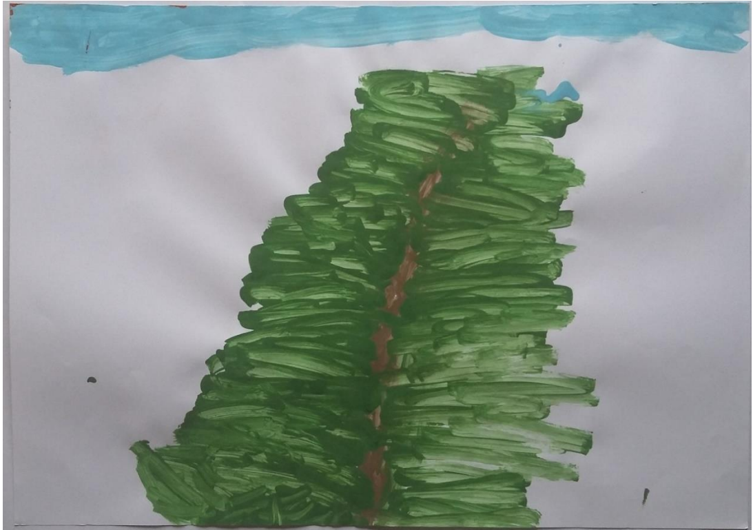
Slika 8 Iva (4) „Jedno drvo i grane“

Lovro (5) je zamislio vlastitu čarobnu šumu u kojoj puše vjetar. Možemo uočiti krošnje stabala i puteljak, a najviše se ističe vjetar u zelenoj boji. Zbog načina slikanja vjetra kratkim potezima u određenim smjerovima dobiva se dojam puhanja vjetra baš kao i