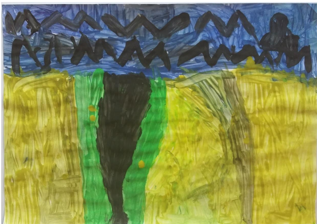
Slika 16 Dora (6) „Put kak ide i okolo je trava i grdo nebo“

Dora (6) je najviše bila zainteresirana za djelo „Žitno polje s gavranima“. Naslikala je put u sredini rada i oko njega travu te žito. Zanimljivo je da dijete žitu daje više prostora na papiru, a time i veći značaj. Međutim, istovremeno je vidljiv i snažan dojam koji na dijete ostavljaju gavranovi. Iznad žita vidljivo je tmurno nebo baš ako i na umjetnikovom djelu. Na nebu dominiraju gavrani koji su predimenzionirani i naslikani shematskim prikazom, izlomljenom linijom. (slika 16)