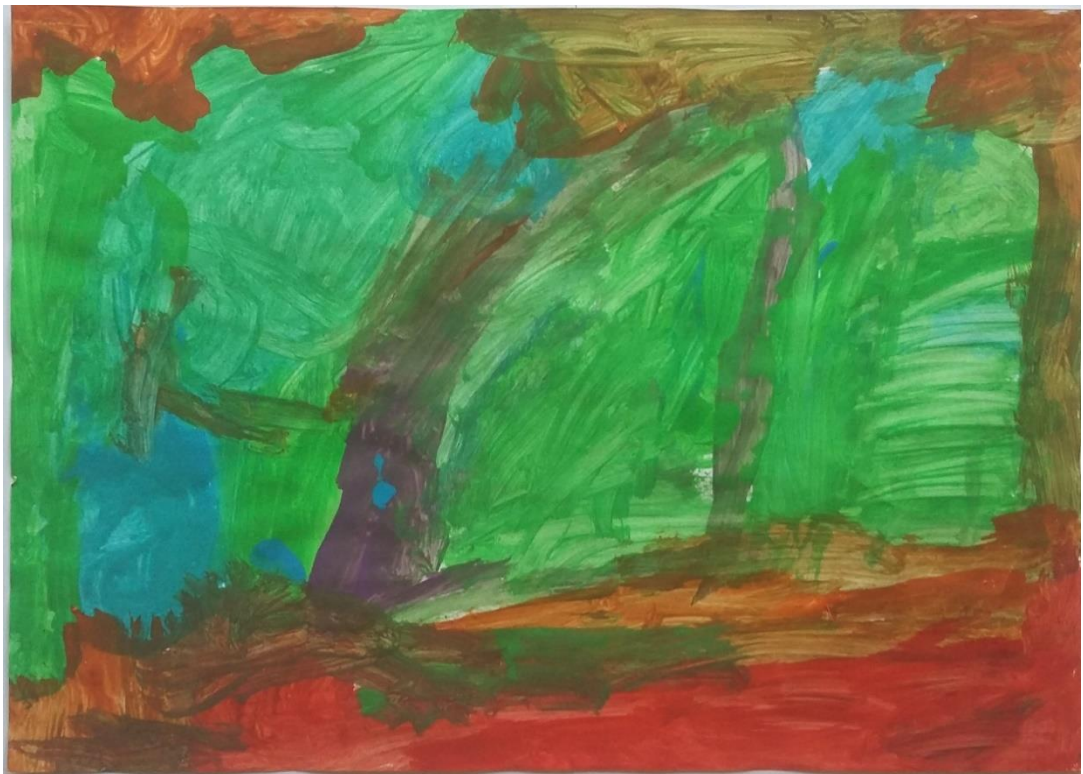
Slika 9 Lovro (5) „Čarobna šuma de su drva i staza i more puhati vjetar“

Lovro (5) je zamislio vlastitu čarobnu šumu u kojoj puše vjetar. Možemo uočiti krošnje stabala i puteljak, a najviše se ističe vjetar u zelenoj boji. Zbog načina slikanja vjetra kratkim potezima u određenim smjerovima dobiva se dojam puhanja vjetra baš kao i