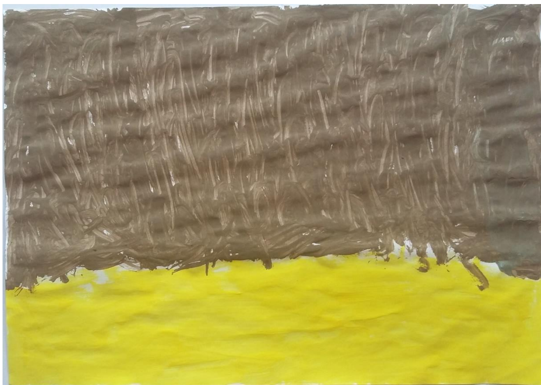
Slika 5 Petar (5) „Jako je tamno nebo“

Teu (4) je najviše zanimanja pobudilo također nebo. U svojem je radu prikazao samo nebo i kretanje vjetra, ne i ostali pejzaž. Nebo je naslikano u plavoj boji na kojoj se ističe kružni oblik koji prema njegovim riječima predstavlja kretanje vjetra.