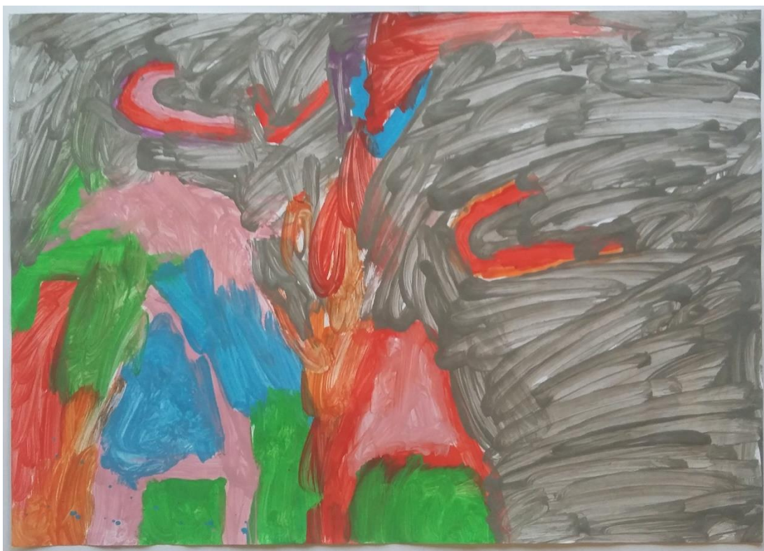
Slika 7 Sara (5) „Nevrijeme je, a tu su kućice“

Sara (5) je zamijetila gradić u podnožju na djelu „Zvezdana noć“ te je na svom radu naslikala kućice. Iznad kućica možemo vidjeti zakrivljene linije u crvenoj i ružičastoj te narančastoj boji koje predstavljaju kretanje vjetra. Na sivoj podlozi koja je naslikana potezima kista u različitim smjerovima možemo u sredini vidjeti i linije u crvenoj boji. Crvenom bojom naslikan je grom koji udara u naslikane kućice. Vidljiv je utjecaj Van Gogha u odabranim motivima, ali i u načinu slikanja koji se najviše može razabrati u prikazu vjetra. (slika 7)