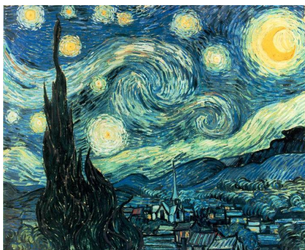
Slika 1 "Zvezdana noć"

„Zvezdana noć“ (slika 1) iz 1889. izrađena je tehnikom ulja na platnu u dimenzijama 73,7 cm x 92,1 cm. Na ovom djelu umjetnik je iskazao unutarnji, subjektivni doživljaj prirode. Korišteni su debeli namazi boje, a čempresi koji podsjećaju na plamen spajaju uzburkano nebo i mirno selo.