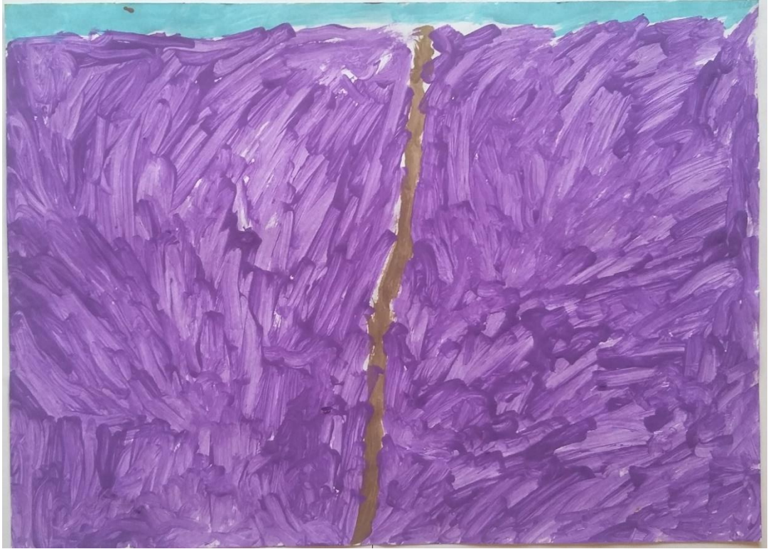
Slika 11 Lara (5) „To je put kroz travu veliku“

Dino (5) je laganim kružnim pokretima prikazao žito u pokretu također prema djelu „Žitno polje s gavranima“. Žito je žute boje kao i na djelu, a iz linija možemo vidjeti da se igrao tijekom slikanja koristeći kružne pokrete u ritmu koji predstavljaju kretanje na vjetru. Kao kontrast svijetlim bojama, u sredini rada nalazi se široki put kroz pšenicu u tamnoj boji kojeg je primijetio na djelu. (slika 12)