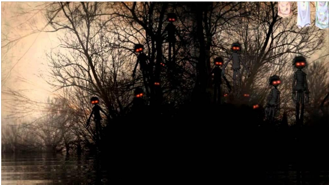
Slika 2. Autorska ilustracija Zdenka Bašića u knjizi Sjeverozapadni vjetar , bića zvana Mraki 8

Druga nagrada ravnopravno je dodijeljena autorima koji se koriste potpuno različitim tehnologijama i stvaralačkim strategijama. Zdenko Bašić koristi tehniku kompjutorske grafike kojom na začudan način oblikuje snoviti nadrealni svijet bogat realističkim detaljima. Svojim stvaralačkim postupcima Bašić se približio suvremenom senzibilitetu mladih kojima je elektronska tehnologija bliska od najmlađe dobi, a istodobno je ostavio široko otvoren put u svijet mašte...“ (Bašić, 2011:7).