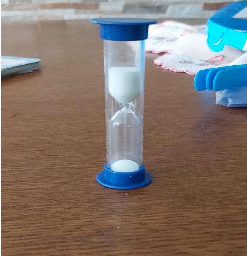
Slika 2. Pješčani sat kojim se mjerilo vrijeme pogađanja u igri Tko je to