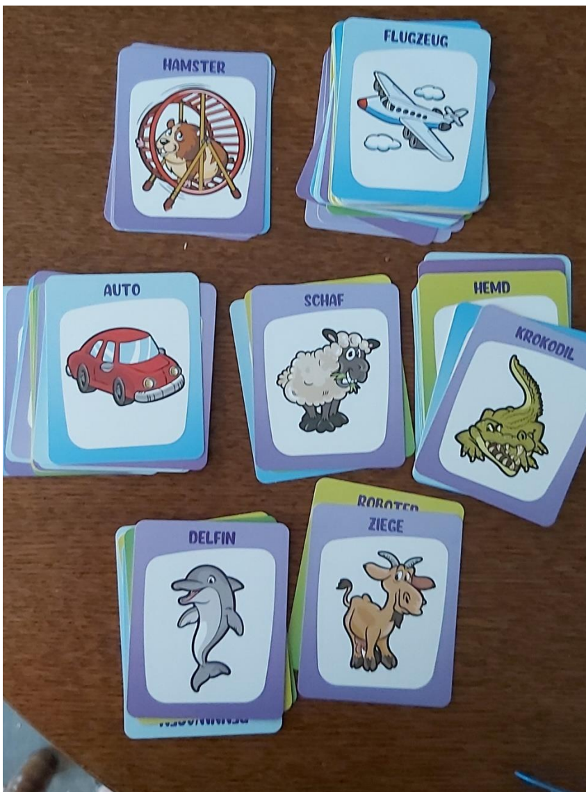
Slika 1. Sličice iz društvene igre Overheadz za igru Tko je to?