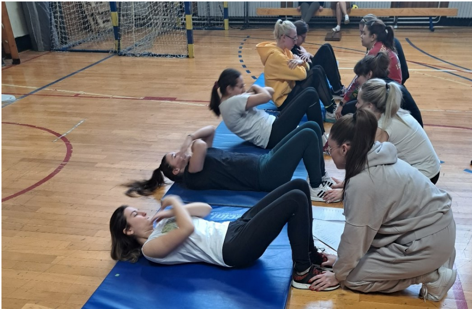
Slika zadatka „Podizanje trupa“