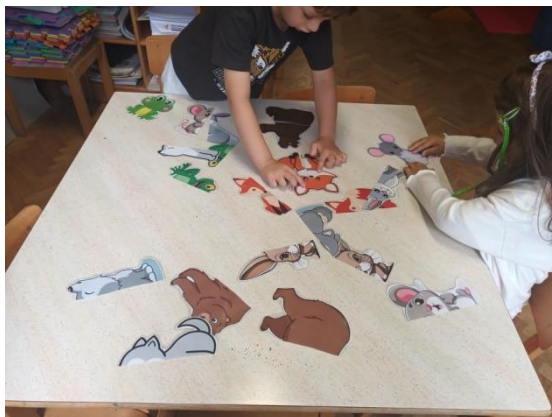
Slika 20. Spajanje dvaju dijelova životinje

Aktivnost potiče spoznajni razvoj, logičko razmišljanje te razvoj govora. Aktivnost je prvenstveno bila namijenjena mlađoj djeci jer u skupini imam djecu u 3. i 4. godini života. Dok sam s njima provodila individualni rad te ih poticala na govor, u igru su se uključili i stariji dječaci, koji su tu igru pretvorili u natjecateljsku. Natjecali su se tko će složiti više životinja. U igri razgovaraju o boji, veličini životinja, ali i uočavaju da su od svake životinje po dvije slagarice te dolaze do zaključka da su iste životinje različite.