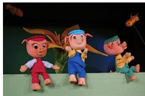
Slika 1. Lutkarska predstava s ginjol lutkama

Glava ginjol lutke može se napraviti od različitih materijala, poput drva, papira, tkanine i sl. Djeca jako vole ginjol lutke jer kada je žele oživjeti animacijom, mogu je kontrolirati i nesputano se uživjeti u predstavu s njom.